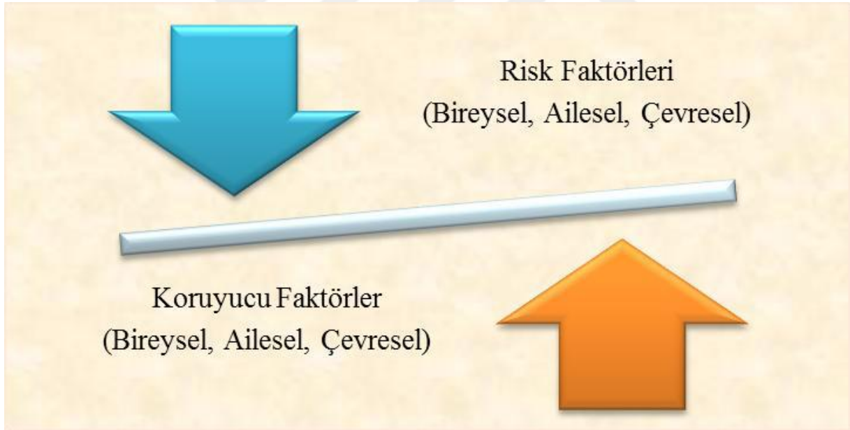
Şekil 1: Psikolojik Dayanıklılığın Niteliği

Psikolojik dayanıklılığın ilerleyebilmesi açısından, ön şart olarak kişinin bir tehdide uğrama ihtimaline maruz kalması gerekmektedir. Bu tehdide uğrama ihtimali etkenlerinin olumlu olmayan tesirinin azalış göstermesi ya da tamamen gitmesi açısından muhafaza edecek etkenlerin sağlanması önemlidir. Risk: Bir sorunun açığa çıkması, sürmesi veya da daha da zor bir hal alma ihtimalini yükselten sıradan bir olay, durum veya da yaşantıdır. Muhafaza eden etkenler ise, risklerin ve olumsuz gerekliliklerin negatif yönünü eksilten veya fazlalaştıran etmenlerdir. Kişilerin, çalışma hayatlarında maruz kaldıkları ihtimal dâhilinde riskli durumlar ve edinmiş oldukları koruyucu etmenler de psikolojik dayanıklılığa olan sirayeti düşünülmektedir. Bilhassa çalışma hayatında birçok risk etmenine maruz kalan, her durumda güç halde rahatsızlığa sahip bireylere profesyonel sağılatım vermek, hastayı daha iyi duruma getirmek için uğraşan hemşirelerde de psikolojik dayanıklılık terimi oldukça önemlidir (Çam ve Büyükbayram, 2017).