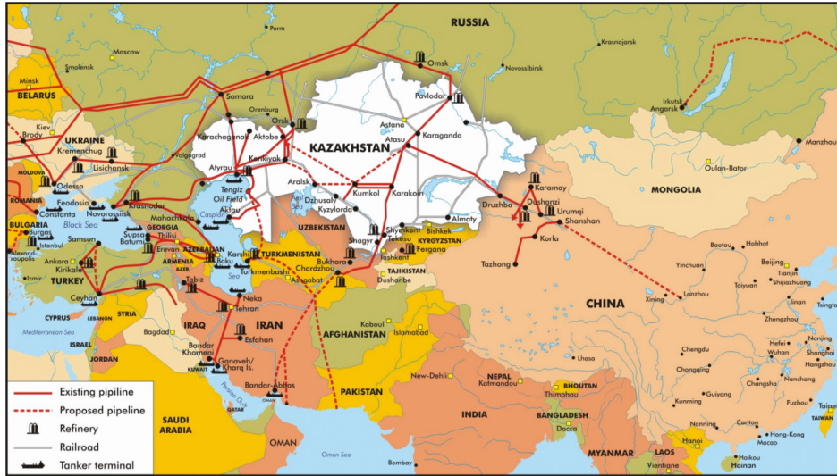
Tablo 2. Kazakistan Rusya Arasında Mevcut Boru Hatları, (European Tribune: Erişim tarihi 15.06.2011 http://www.eurotrib.com/story/2005/12/16/72028/741 )

Orta Asya devletlerinden petrol ve doğal gazı dünya fiyatlarının çok altında almakta ve bunları Avrupa'ya ve dünya pazarlarına rayiç fiyatlardan satmaktadır. Elbette Kazakistan karar alıcıları bu durumu bilmektedir. Fakat Kazakistan için RF'yi by-pass edebilecek bir alternatif bulunmadığından, ilişkiler aynı şekilde devam etmektedir. Diğer taraftan Kazakistan'da devlet bürokrasisindeki ve yönetimdeki ulusal çıkarlar konusundaki yaklaşım sorunlu durumdadır.