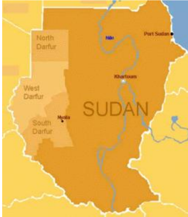
Şekil 3: Sudan’ın Darfur Bölgesini Gösteren Harita

Kaynak:(The United Human Rights Council; 17.03.2014)