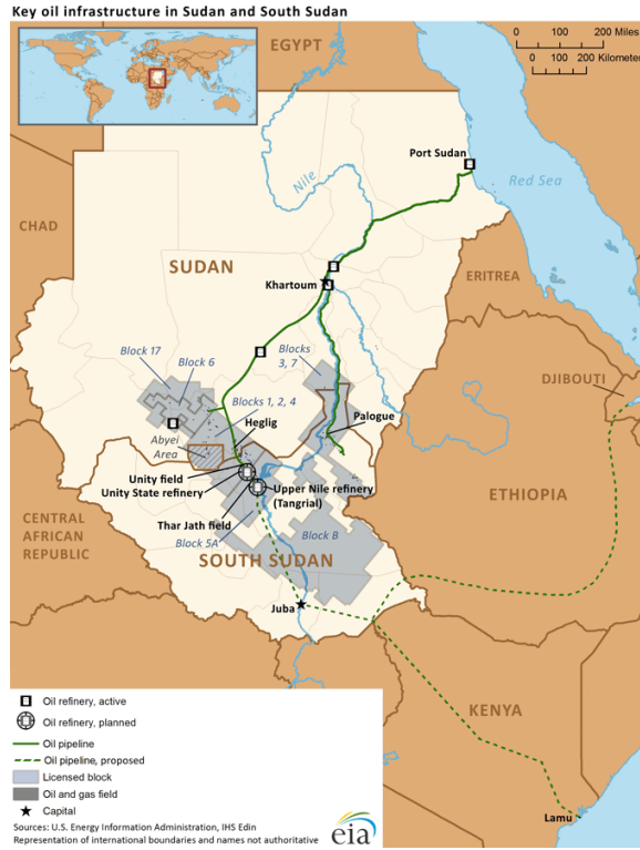
Şekil 4: Sudan ve Güney Sudan'daki Petrol Bölgelerini Gösteren Harita