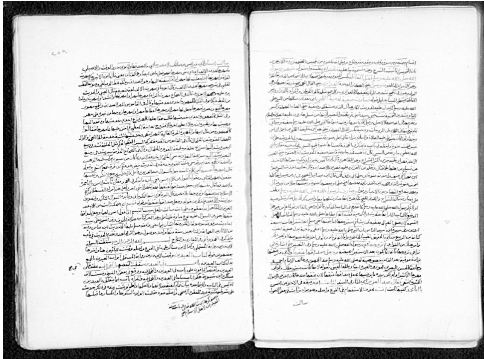
الصفحة الأولى من كتاب العيدين من النسخة الشامية.