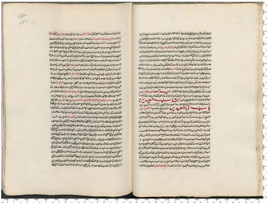
الصفحة الأولى من كتاب العيدين من النسخة الإسطنبولية.