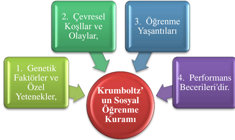
Şekil 4: Kariyer Kararı Faktörleri

Genetik Faktörler ve Özel Yetenekler: Bireylerin eğitimsel ve mesleki tercihlerini, becerilerini ve karar vermelerini sınırlandırabilir. Örneğin müzik yeteneđi meslek olasılıkları, genetik potansiyel ve çevresel koşulların etkileşimiyle daha uygun hale gelmektedir ( Deveci, 2011).