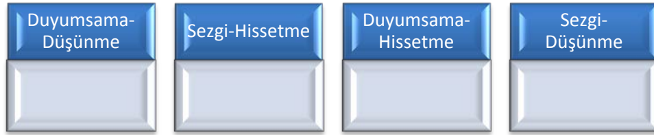
Şekil 7: Algı ve Karar Verme Boyutları

Algılama ve karar vermenin farklı boyutları bir insanda dört farklı birleşimden birini gerçekleştirecek şekilde bir araya gelir.