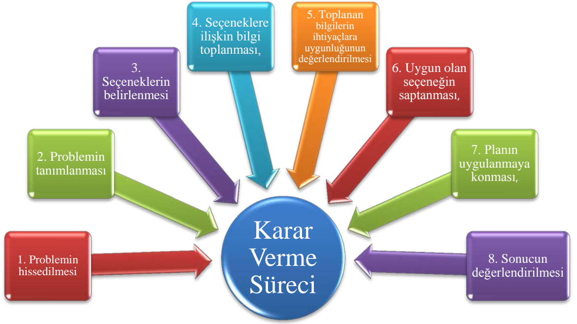
Şekil 2: Akılcı Karar Verme Süreci

Şekil 2’de görüldüğü gibi, akılcı bir karar sürecinin ilk ve en önemli aşaması bir güçlüğü hissedilmesi ve karar sorumluluğunun üstlenilmesidir. Sorumluluğu üstlenmek karşılaşılabilecek tüm problemlerle baş etmeyi göze almaktır. Bundan sonra sorunu ortadan kaldıracak seçeneklerin araştırılıp sıraya konması, seçeneklerin sağlayacağı olanakların ve bireye yükleyeceği bedellerin belirlenmesi ve her birinin değerleri ile benzer ve farklı yönlerinin saptanması gerekir. Karar verme ciddi bir akıl yürütme sürecidir. Seçeneklerin kişisel istekleri ve kişinin de seçeneklerin gereklerini karşılayabilme derecesi bakımından değerlendirilmesi işlemi, kendini iyi tanıma koşulu ile başarılı biçimde gerçekleştirilebilir.