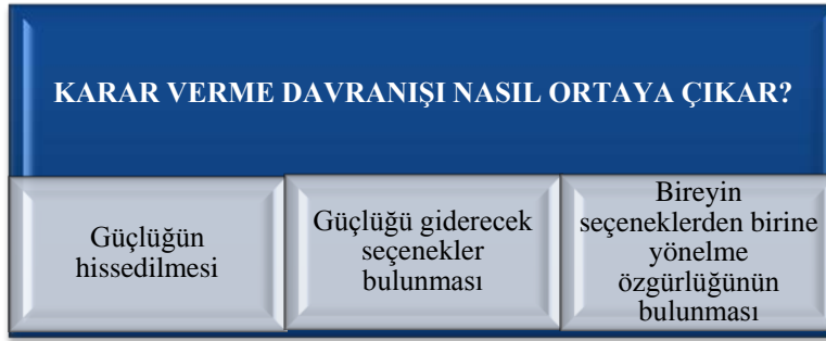
Şekil 5: Karar Verme Davranışını Ortaya Çıkışı

Karar verme işleminin başlayabilmesi için o güne kadar gidilen yolun tıkanması ya da daha çekici özellikleri olan yeni olanakların açılması, bunun karar verecek kişi tarafından algılanması ve durumda bir değişiklik yapma gereksiniminin hissedilmesi gerekir.