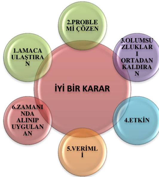
Şekil 3: İyi Bir Kararın Özellikleri

Buradan mantıklı ve yerinde karar vermenin yaşamsal önem taşıdığı anlaşılmaktadır. Psikolojik Danışma ve Rehberlik alanında görev yapan profesyonel uzmanların önemli bir yardımı, bireylerin eğitsel, mesleki, kişisel ve sosyal alanlardaki kararlarını vermelerine rehber olmaktır.