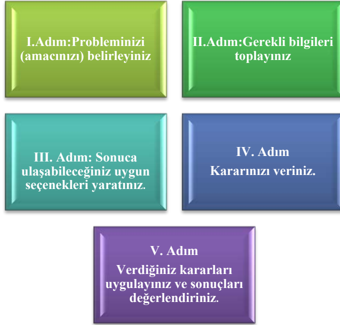
Şekil 1: Karar Verme Sürecine Klasik Yaklaşım (Adair'den aktaran Deniz, 2002).

Karar verme sürecinde yararlanılabilecek adımları Adair (2000), beş kategoride toplamıştır. Bu kategoriler şekil 1’de aşağıda gösterilmiştir: