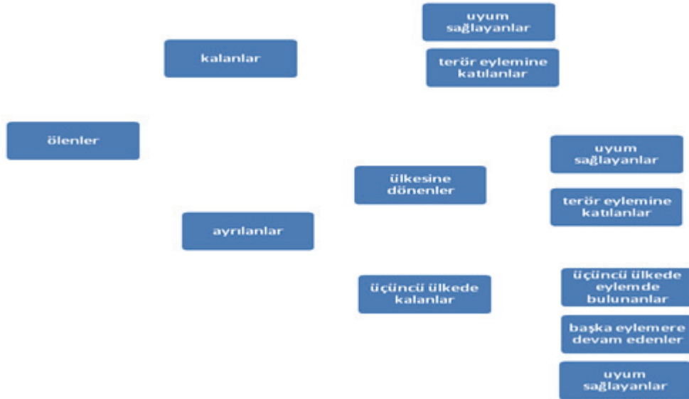
TABLO 6: Yabancı Terörist Savaşçı Döngüsü

Radikal örgütlerin Suriye’ye geçmeleri için seyahat kılavuzları hazırlanmıştır. Bu kılavuzlar yardımıyla, radikal eğilimleri olan kişiler Suriye kuzeyindeki muhalif gruplara katılmaktadırlar. Türkiye-Suriye sınırınının 911 km. olması bu savaşçıları kendisine çekmiş ve Suriye’ye geçmek için Türkiye transit ülke olarak kullanılmıştır. Özgür Suriye Ordusu’na destek veren Türkiye, yabancı savaşçıların geçişleri için ilk başlarda bu olaya bir güvenlik meselesi olarak bakmamış, IŞİD’in bahsedilen bölgede ilerleyişinin hızlanması ve selefçi-cihatçı etkinin güçlenmesiyle, Türkiye’nin “Yabancı Terörist Savaşçıları” konusundaki hassasiyeti artmıştır. Türkiye’nin ilk başlardaki bu hamlesi ve Körfez ülkeleriyle iyi ilişkiler batılı ülkeler tarafından Teröristlerin geçişine destek verip vermediği konusunda tartışmalar başlatsa da bu konuda Türkiye’nin önemi iyice artmış ve Türkiye bir takım ek tedbirler almıştır (Özdemir ve Kardaş, 2015).