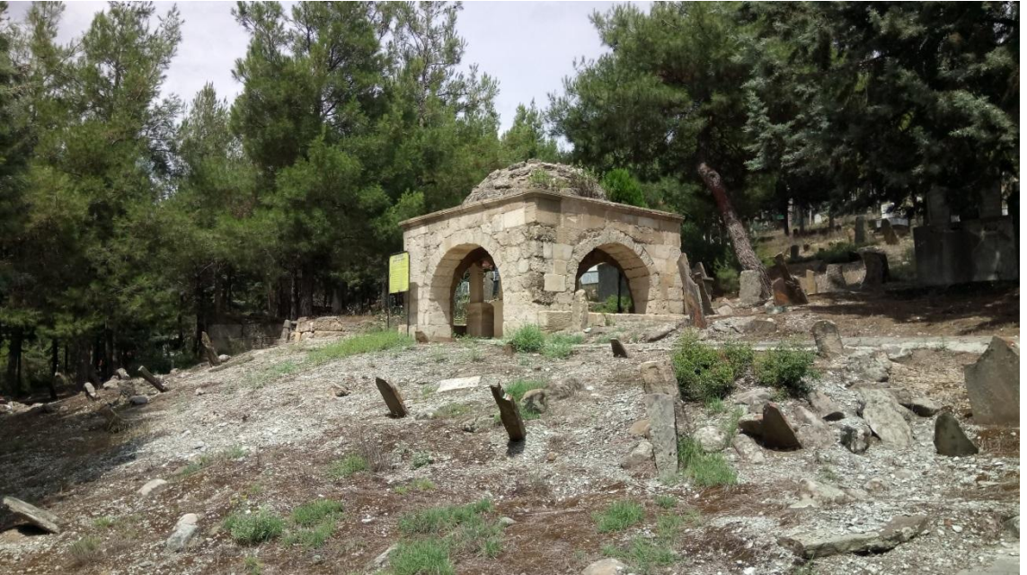
İLÇE MEZARLIĞINDA BULUNAN AĞCA BEY VE YAKINLARININ MEZARININ İÇİNDE BULUNDUĞU KÜMBET