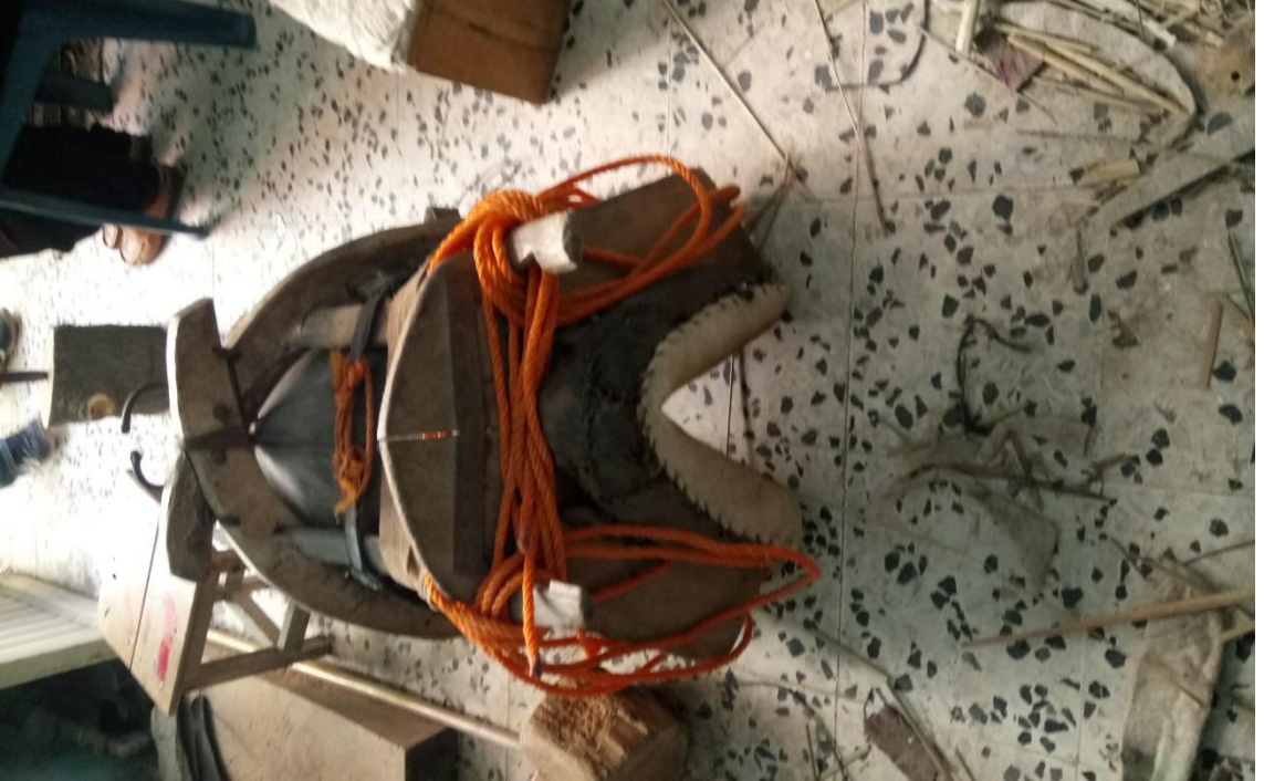
İLÇEDE AYAKTA DURMAYA ÇALIŞAN SEMERCİLİK