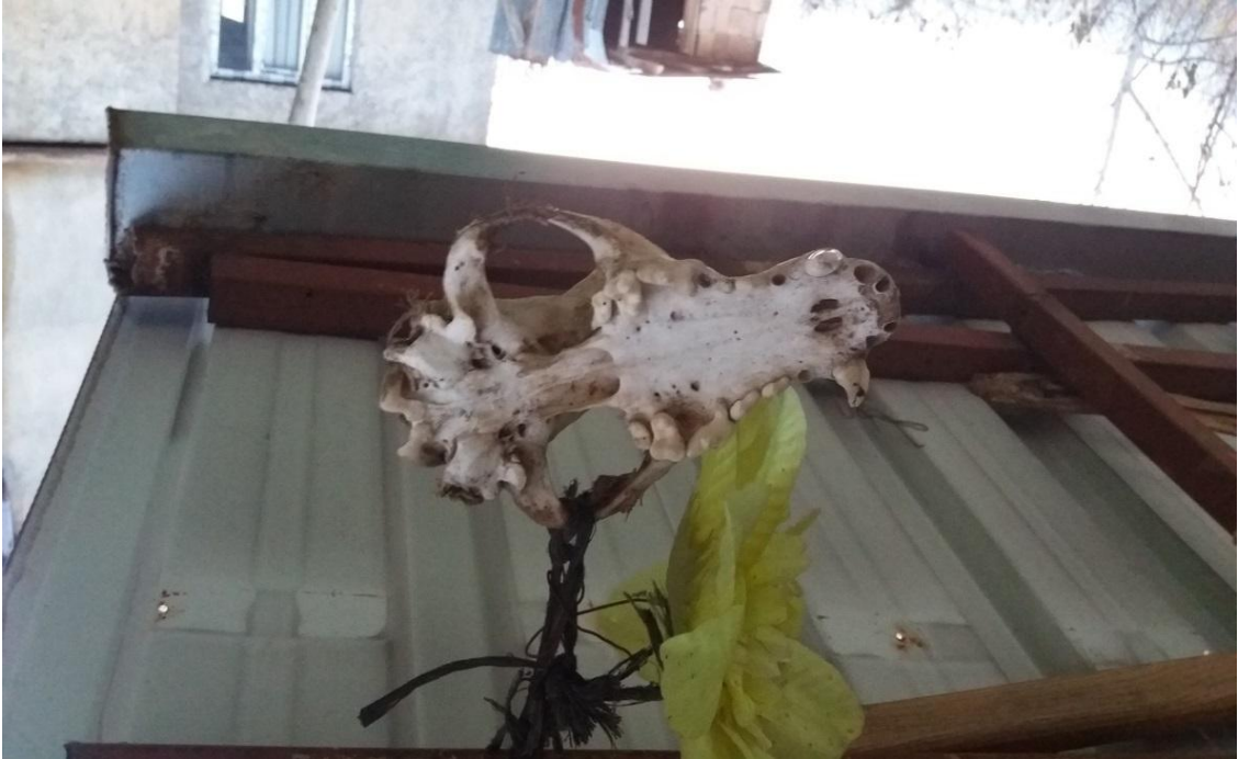
NAZARDAN KORUNMAK İÇİN EVİN ÇATISINA ASILAN HAYVAN (KÖPEK) KAFATASI