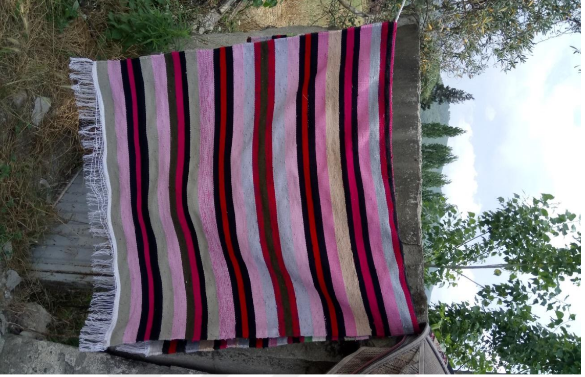
İLÇEDE DOKUNAN KİLİM ÖRNEĞİ