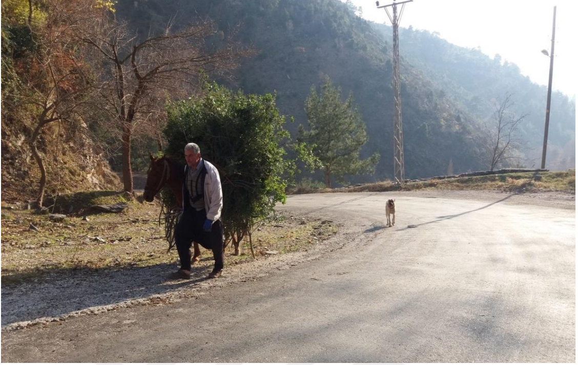
PEKDEMİR KÖYÜNDE AT İLE HAYVANLARINA DAL TAŞIYAN KÖYLÜ