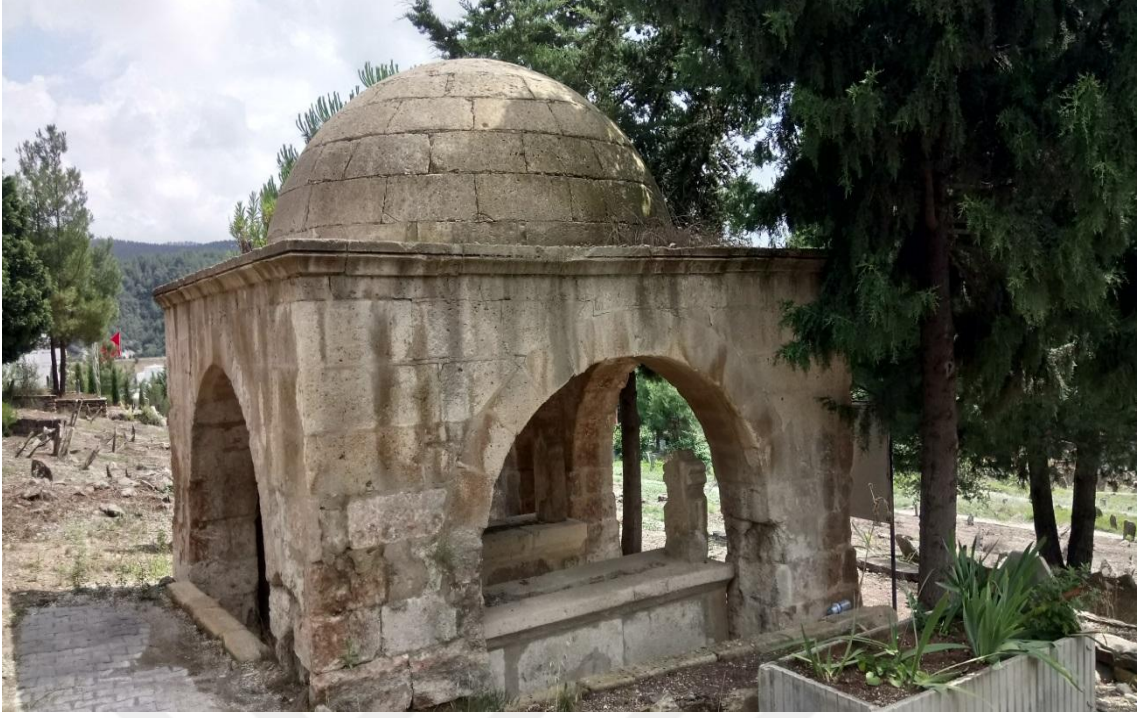
İLÇE MEZARLIĞINDA BULUNAN AĞCA BEY VE YAKINLARININ MEZARININ İÇİNDE BULUNDUĞU KÜMBET