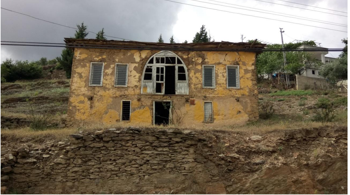
KARŞIYAKA MAHALLESİNDE ESKİ BİR BAHÇE EVİ (Bölgenin Ermeni işgalinde Ermenilerin kumanda merkezi)