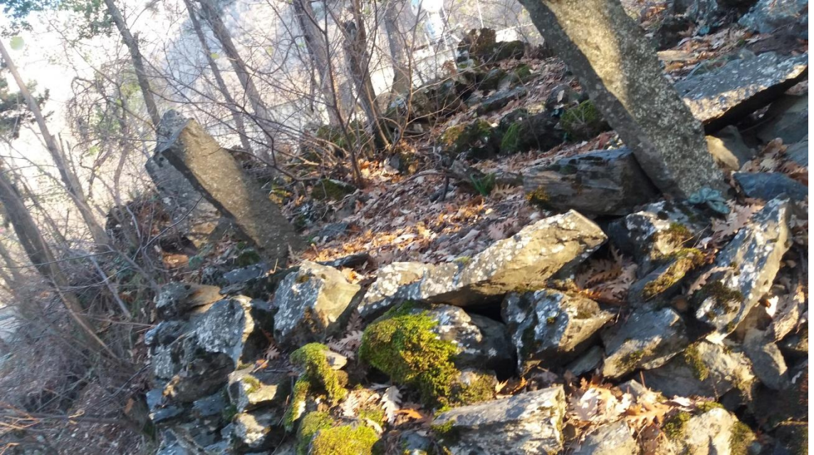
BAHÇE İLÇESİ BİLALİK MEVKİDE ESKİ BİR MEZARLIK