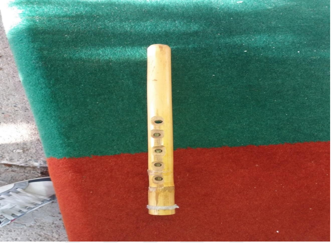
KAVAL ÖRNEĞİ (Beş delikli kara düzen)