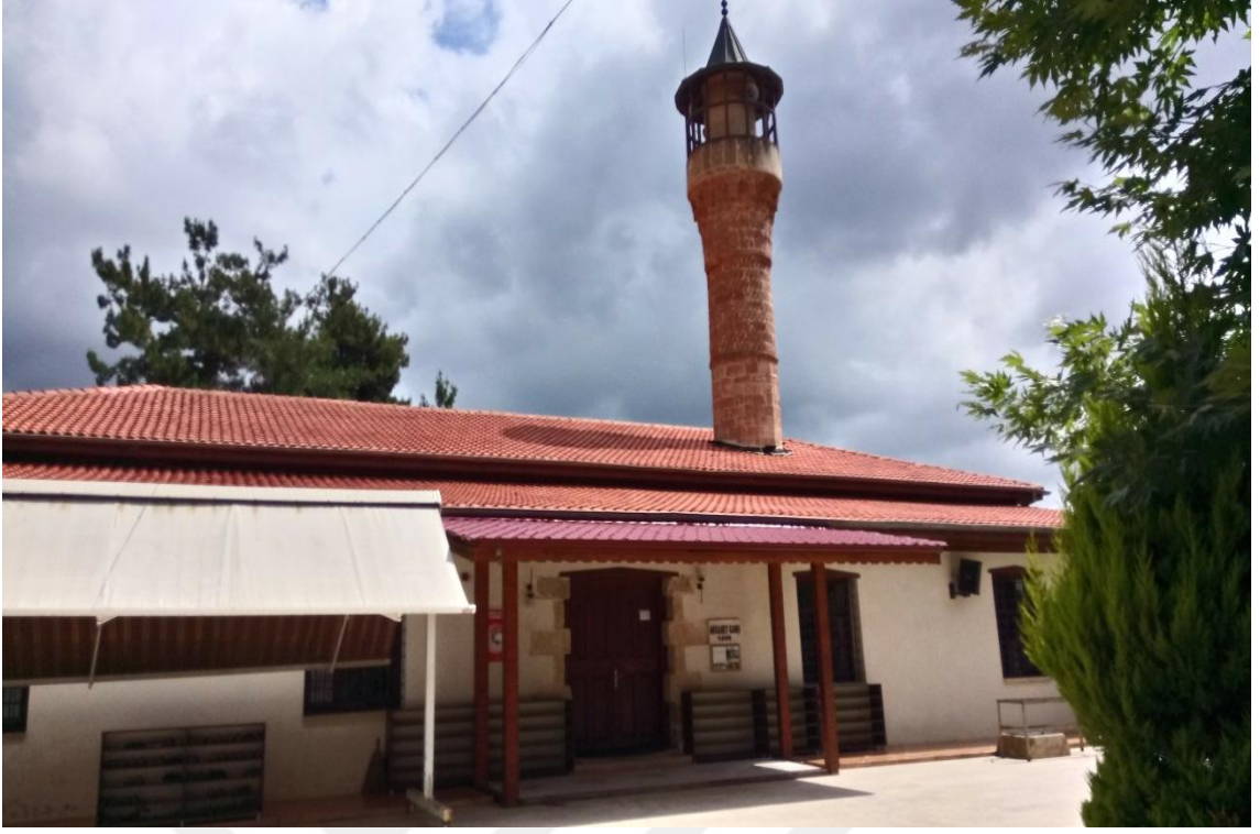
TARİHİ AĞCA BEY CAMİ