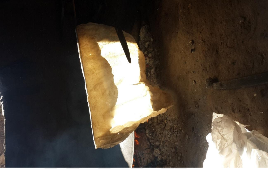
SACDA YAPILAN YUFKA EKMEĐİ