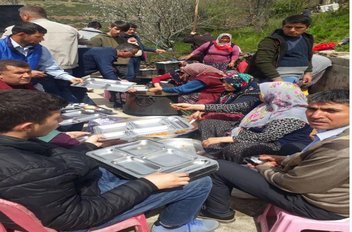
ARICAKLI KÖYÜ TIRŞİK FESTİVALİNDEN