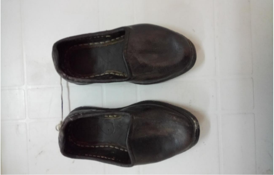
İLÇEDE BİTMİŞ OLAN EL ZANAATLARINDAN MARAŞ LASTİK YEMENİSİ