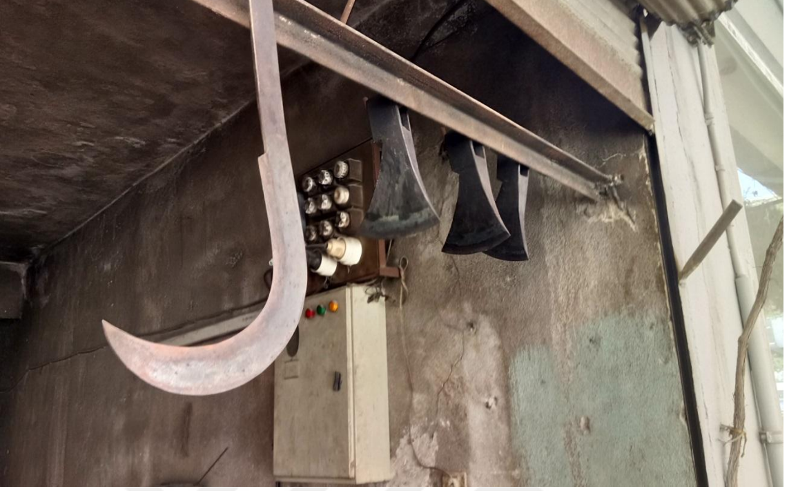
DEMİRCİLİK ZANAATINDAN BALTA VE TAHRA ÖRNEĞİ