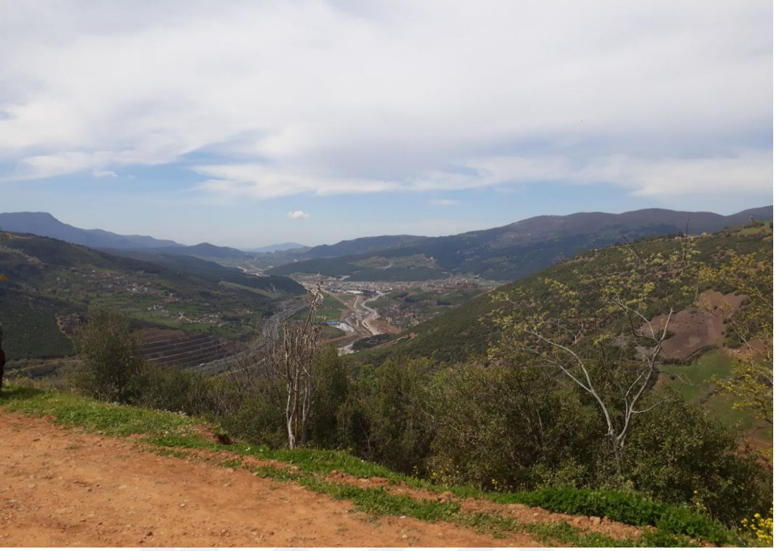
ARICAKLI KÖYÜNDEN BAHÇE İLÇESİNN GÖRÜNÜŞÜ VE GÂVUR DAĞLARI