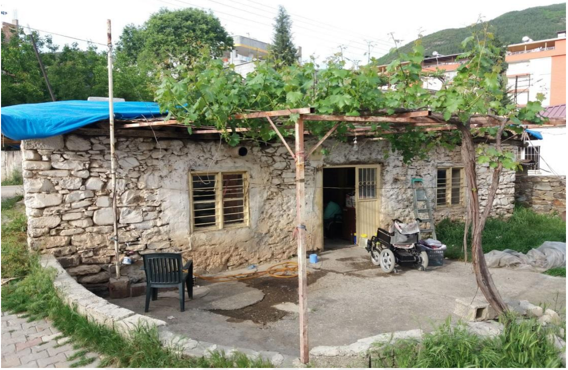
İSLAM MAHALLESİNDE YAKLAŞIK 100 YILLIK BAHÇE EVİ