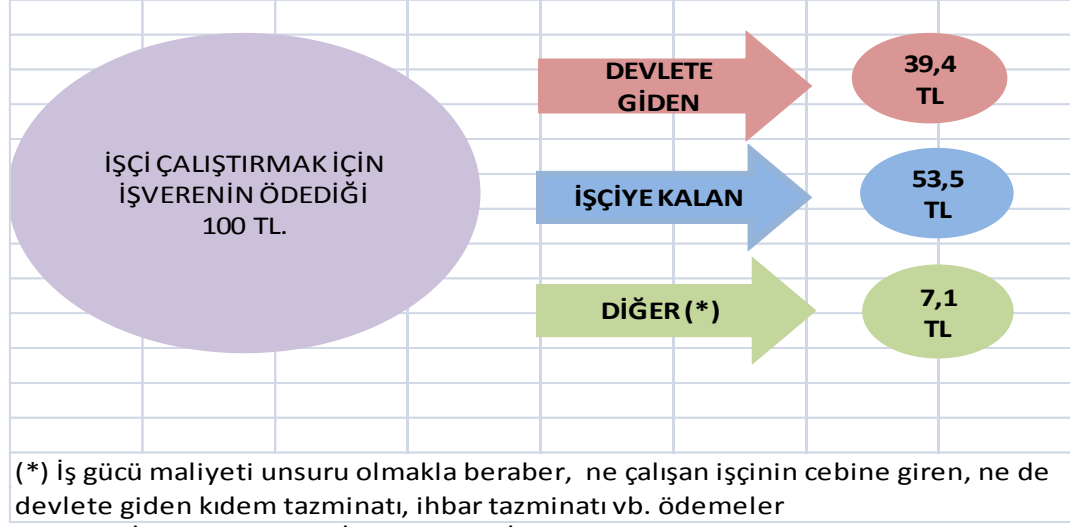
Şekil 1: 2015 Yılında İşçi Geliri Açısından Devletin Aldığı Vergi Oranı (100 TL Üzerinden)

Kaynak: TİSK, 2015 Çalışma İstatistikleri ve İşgücü Maliyeti Araştırması.