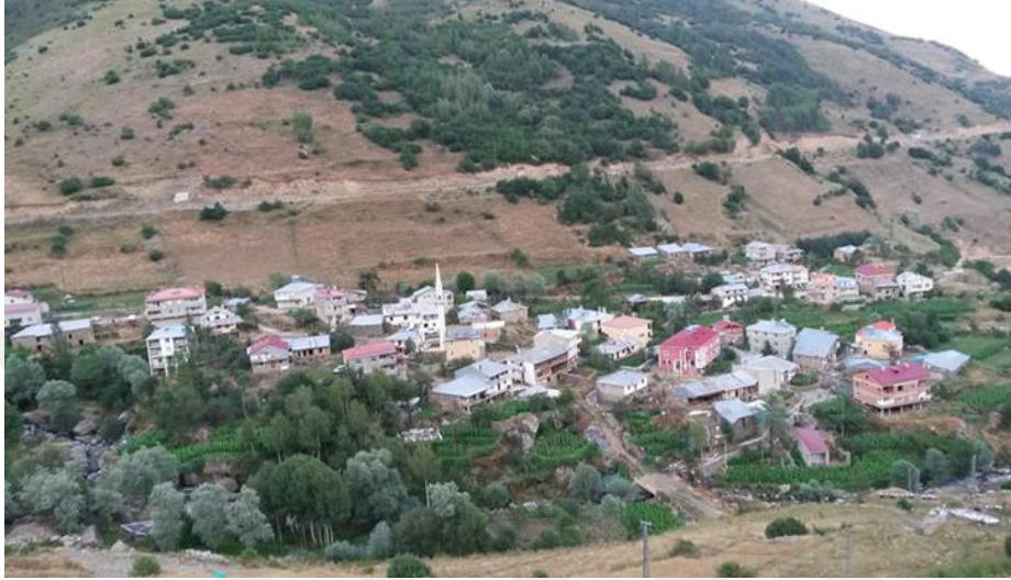
Görsel 9. Kopuz köyü

Kopuz köyü Torul ilçesine 31 km uzaklıktadır. 2017 tarihli nüfus sayımına göre köyün 11'i erkek 17'si kadın olmak üzere toplam nüfus 28'dir. Bu köyün gerçek nüfusu çeşitli sebeplerle göç etmiş, nüfus ve yerleşim oranı düşmüştür. Köyün 1 camisi bulunmaktadır (Üçüncüoğlu, 1988e, s.263).