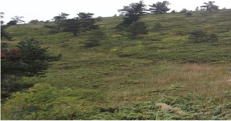
Görsel 10. Urus yolu