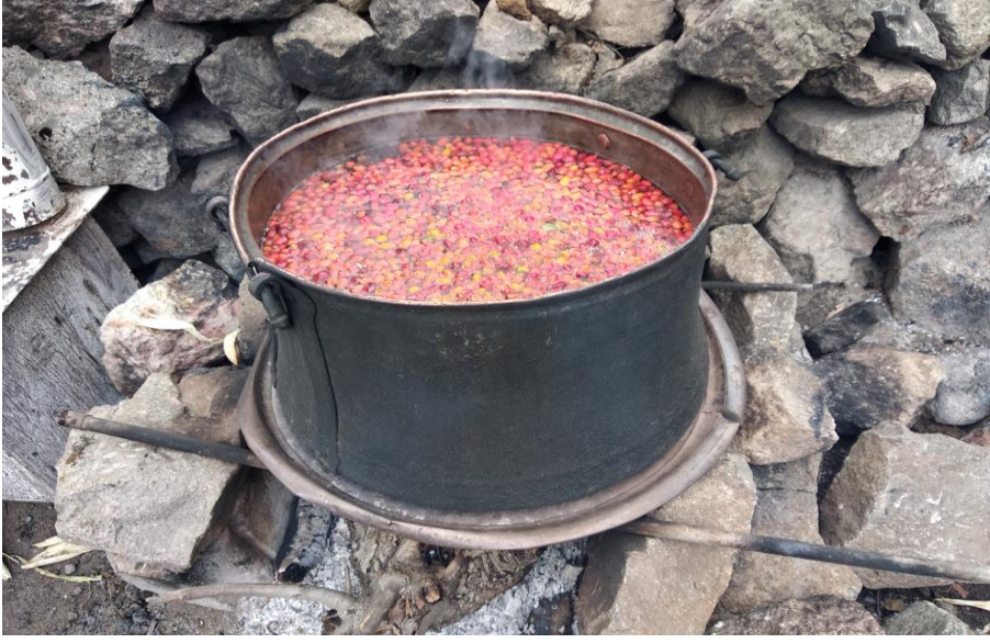
Görsel 33. Kuşburnu kaynatma

Olgunlaşmış turuncu veya kırmızı rengi almış kuşburnular bekletilmeden yıkanır. Çiçekleri ve dipleri kesilerek temizlenir, reçel yapılacak tencereye koyulur. Kuşburnular ezilme kıvamına gelinceye kadar kaynatılır. İyiye yumuşayan kuşburnular kaynama suyu ile birlikte süzgeçten geçirilerek çekirdek ve zarlarından arındırılır. Elde edilen kuşburnu ezmesi ince un eleğinden geçirilir. İstenen kıvama gelinceye kadar bu işlem birkaç kez tekrarlanır. Un eleğinin altına geçen ezme bir kazanda toplanır. Kazanın içine biraz su eklenir ve kaynamaya bırakılır. Kısık ateşte kıvamını alıncaya kadar pişirilir. Ocaktan indirmeye yakın şekeri ilave edilir. Şekerin erken ilave edilmesi renginin daha koyu olmasını sağlamaktadır. Sıcakken kavanozlara koyulur ve kavanozun ağzı sıkıca kapatılır. Serin yerde muhafaza edilir (KK1, 21, 18, 5).