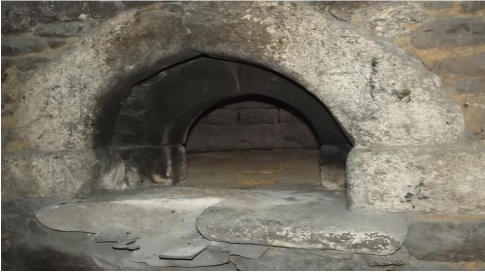
Görsel 16. Rumlardan kalma fırın

Köylerde her mahallenin birbirine yakınlığı veya uzaklığı dikkate alınmadan kilise inşa edilmesi, Rumların dinî vazifelerine ne kadar önem verdiğini göstermektedir. Demirkapı köyünün eski mahallelerinden biri olan Arpalı Köyü'nde papaz yetiştirme okulunun olduğu ve buradan yetişen papazların her pazar ayin için mahallelere ve diğer köylere gönderildiği bilinmektedir (KK10, 12). Rumların yörede tarım için inşa ettikleri yapıların sağlamlığı yöre halkını şaşkın bırakmakta, teknoloji olmadan bunu yapabilmiş olmaları yöre halkınca hayranlıkla karşılanmaktadır (KK8).