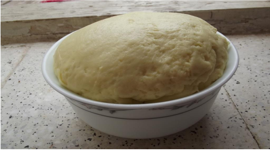
Görsel 28. Deleme

Çiğ süt ekşitildikten sonra ocağa konulup hafif ısıtılır. Isınan süt bir torbaya dökülüp sızdırılır. Sütün artık suyu sızdıktan sonra bir kapta ufalanır ve bekletilir. Ocağa tekrar süt koyulur ve kaynatılır. Kaynayan sütün üzerine ufalanan malzeme dökülür. Malzeme ile kaynayan süt tekrar bir torbaya dökülür ve suyunun çıkması beklenir. Suyu çıkan ve katı hâle gelen malzeme sıcakken bir kaba dökülür. Kaba dökülen malzemeye biraz kaymak, tereyağı ve tuz eklenip hızlıca karıştırılır. Yoğurularak katılaştıran bu karışım küçük kaplara koyularak soğuk yerde bekletilir. Bu peynir yapı olarak kaşar peynirine benzemektedir (KK1, 8).