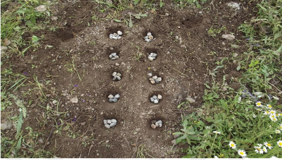
Görsel 22. Pısl oyunu kümeleri

yapan çocukların vakit geçirmek için oynadığı oyundur (KK2, 18, 19, 23, 32, 24, 13, 14, 35).