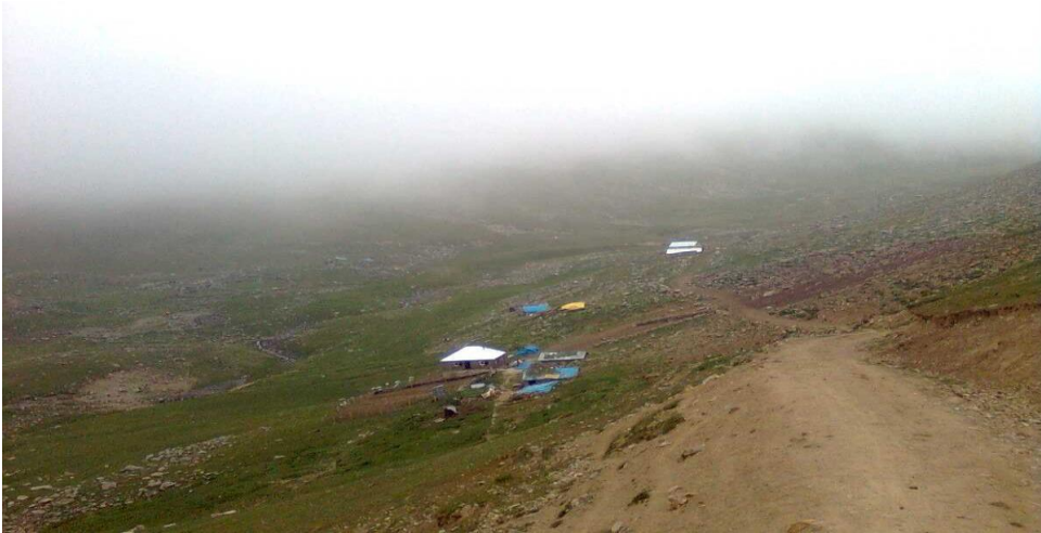
Görsel 24. Olukman yaylası

Cizere köylerinde yaylaya çıkış mevsimi abril beşinden sonra üçüncü fırtınanın geçtiği mayısın son haftasıyla haziranın ilk haftasıdır. Yaylaya çıkışın kesin tarihi hava şartlarına göre belirlenir ve yaylaya toplu olarak aynı gün çıkılır. Yaylaya çıkış tarihlerinde hava sıcaklıklarına bağlı olarak bazı değişimler görülse de en yaygın tarih Haziran başıdır (KK21, 1, 9).