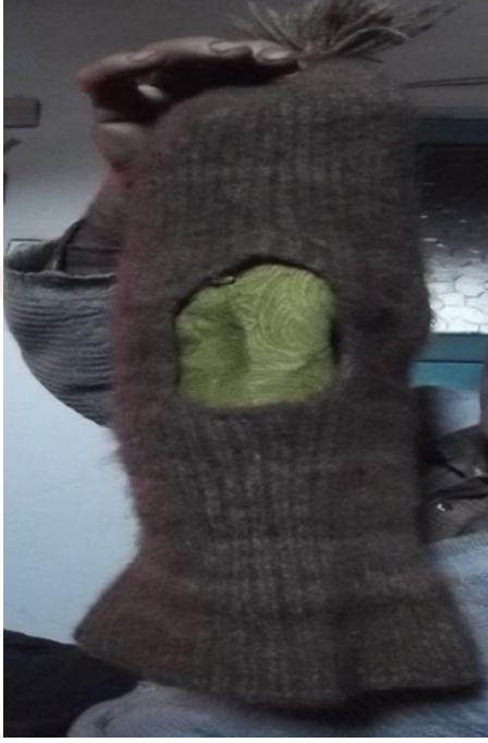
Görsel 25. Tiftikten yapılan bere

Cizere köylerinde dayanıklılığı, iyi boyanması ve rengini uzun süre muhafaza etmesiyle en çok tercih edilen giyimlerden biridir. Keçiler kırıldıktan sonra tüyler iyice yıkanır. Yıkanan sert kıllar yün tarağından geçirilir ve altında kalan yumuşak ve ince tüyler kirmen ve terşide ip hâlini alır. İp olan keçi yününden çorap, bere ve atkı yapılır. Genelde kış aylarında ava çıkan köylüler tarafından kullanılır (KK12).