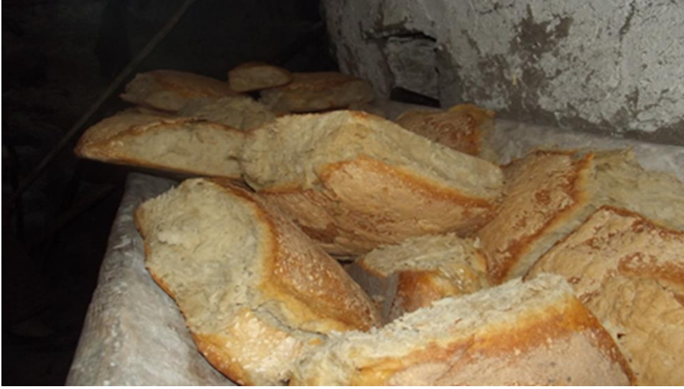
Görsel 18. Sıcaklık adı verilen köy ekmeği