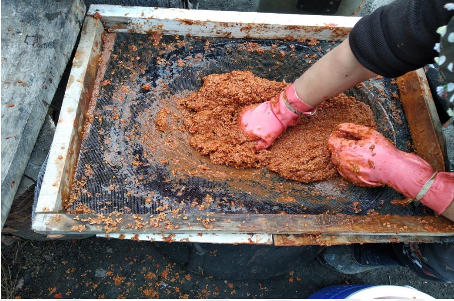
Görsel 34. Kuşburnu çıkarma işlemi