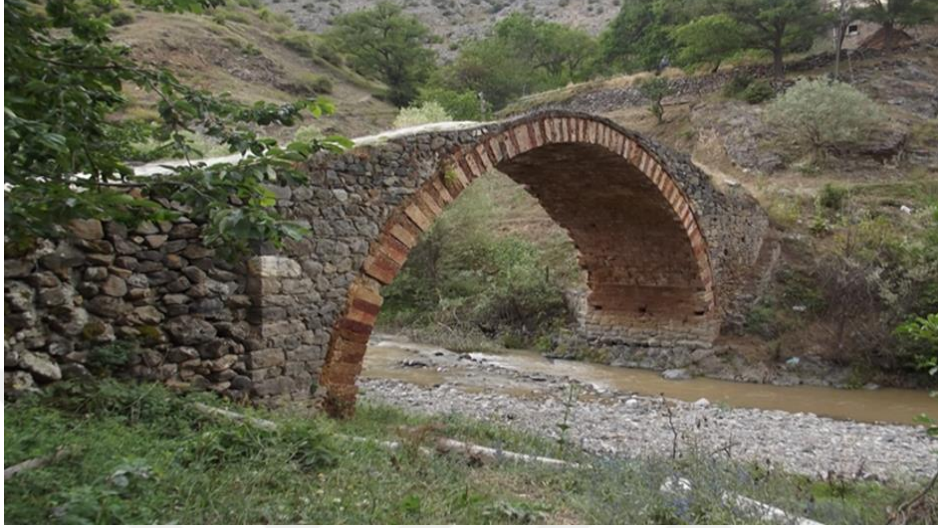
Görsel 14. Emruk mahallesi köprüsü

beşik tonozla örtülü olup çevresi duvarlarla çevrilidir. Köprü tek sivri kemerlidir.” 15 Kemer düzgün yontma taşla örülüdür. Günümüzde kullanmaya devam edilmektedir. Gümüşhane Kültür ve Turizm Müdürlüğü 2012 yılında alınan kararla restore edilecek 43 kemer köprüden biridir.