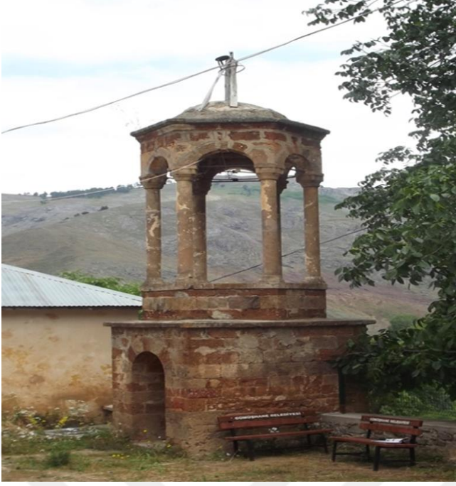
Görsel 11. Arpalı köyü kilisesi çanı

Demirkapı köyü mahalleleri olan Kayadibi, Kurtdüzü, Hıdırellez ve Emrukde bulunan kiliseler 18.yüzyılın ilk yarısına aittir.