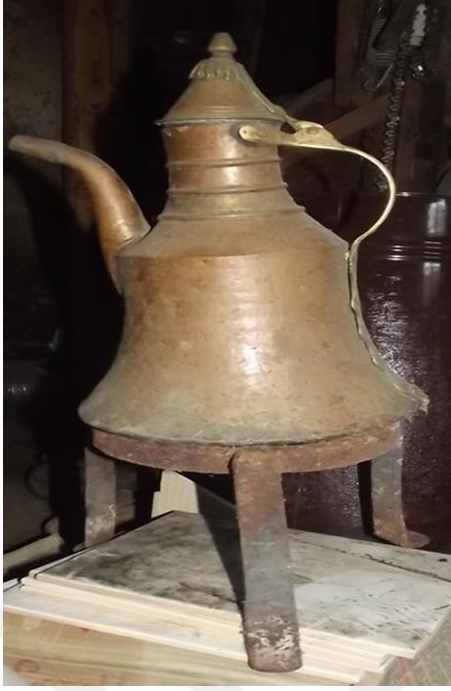
Görsel 26. Sacayağı