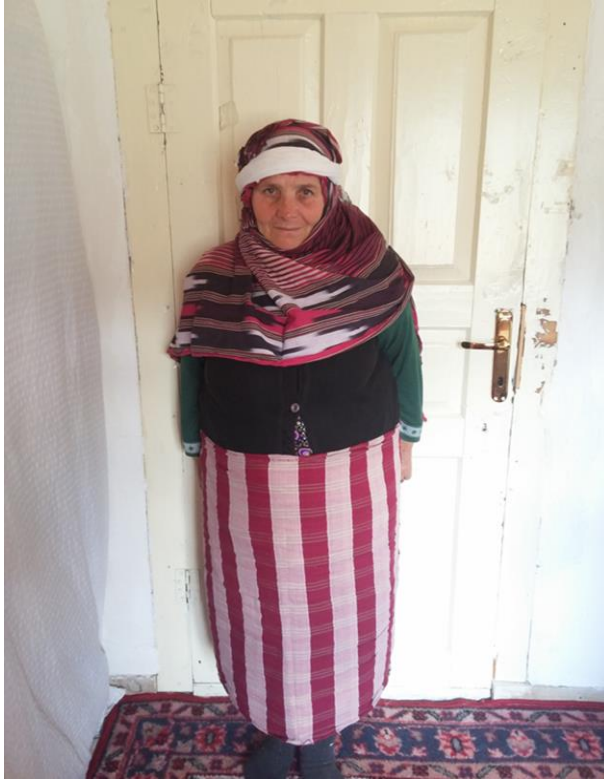
Görsel 20. Geleneksel kadın giyimi

Yörede başa keşan denen kalın örtü takılır, örtü düşmesin diye üzerine küçük bir çember dolandırılır. Alta giyilen belliğin (etek) üzerine kalın bir kuşak, kuşağın üzerine ise mutlaka peştamal sarılır. Bu örtüyü ise yaşlı genç herkes takmak zorundadır. Bu örtü olmadan dışarı çıkılmamalıdır. Peştamal olmadan gidilen yerde yabancı bir erkek olmamalıdır. Peştamal giymeyen kadının utanmasının olmadığına inanılır. Ayağa deriden yapılan çarık giyilir. İleriki yıllarda çarığın yerini kara lastik almıştır. Günümüzde ise keşan ve peştamal sadece yaşlılarda görülmektedir. Düğünlerde uzun ipek bir entari giyilir. Gelin almaya gidilirken de geline çarşaf giydirilir, çarşafın üzerine bir duvak geçirilir (KK30, 17, 1, 31).