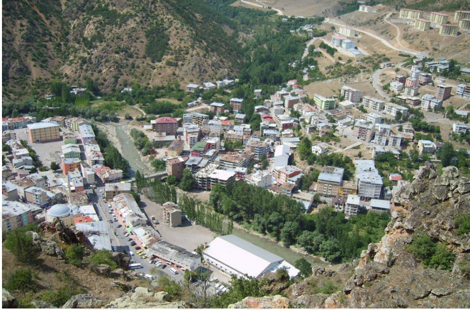
Görsel 2. Torul ilçesi

Torul ilçesi turizm bakımından oldukça zengindir. Karaca Mağarası, Zigana Dağı, Limni Gölü, Yedi göller, Tarihi İpekyolu Köprüsü bunlardan bazılarıdır. 2018 yılında açılan Cam Seyir Terası ise turistlerin ilgisini çekmektedir.