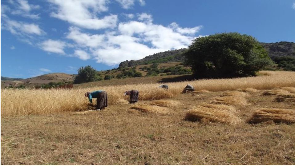
Görsel 19. İmece usulü ile buğday biçme

Köylerde genel olarak tarım ve hayvancılık yapılmaktadır. Tarlaların engebeli olması, çalışmanın tamamen insan gücüne bağlı olması özellikle tarla işlerinde yardımlaşma gerektirmektedir. Köylerde imece usulünün en çok görüldüğü alan tarımdır. Köyde tarla işlerinde imece usulü ile tarlayı çapalamak, orakla ekin biçmek, harman savurmak, patates sökmek, sebze toplamak, fasulye toplamak ve tarlaları sulamak yapılan işlerdendir (KK1, 3, 8, 11, 17, 14, 31, 33, 30).