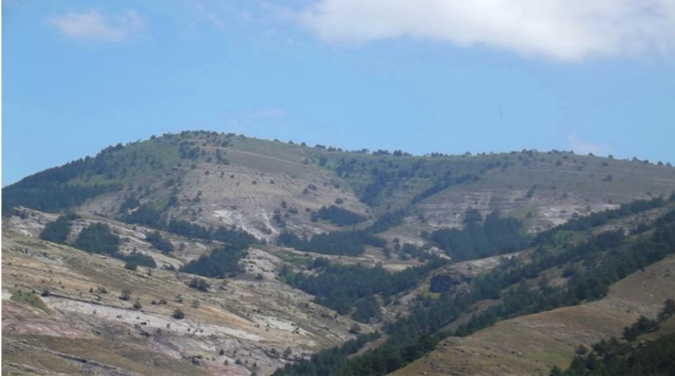
Görsel 3. Kankana savaşının yaşandığı bölge