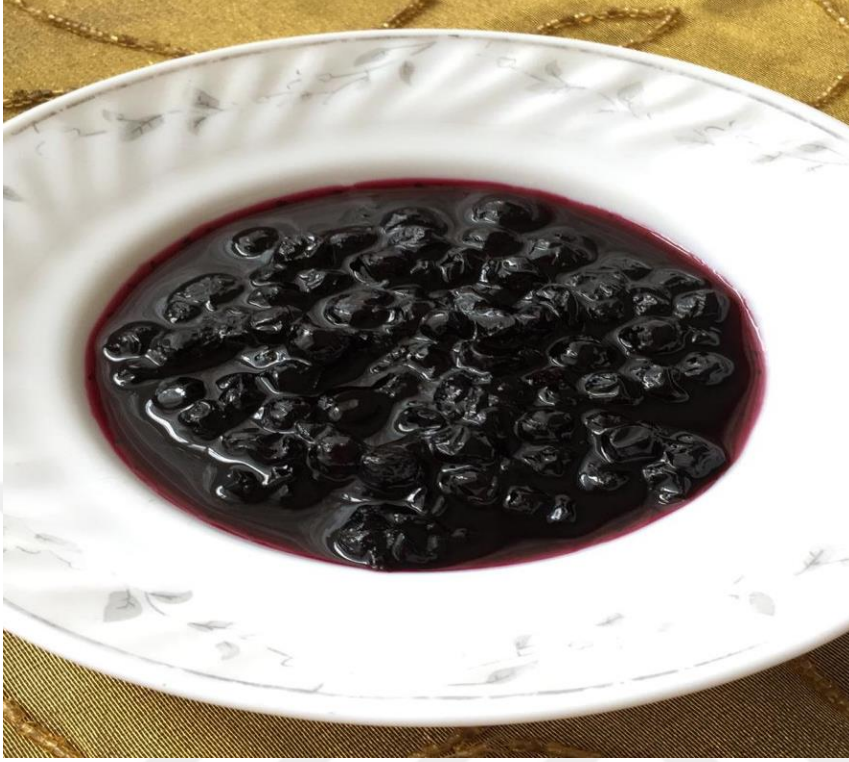
Görsel 35. Dağ Çileği Reçeli

alınır ve kavanozlara koyulur. Rengi siyaha yakındır. Ayrıca bu reçel sulanarak hoşaf olarak da içilebilir (KK35).