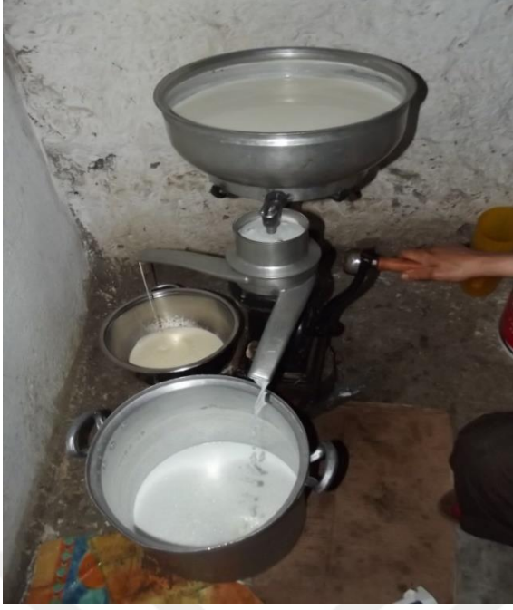
Görsel 27. Süt makinesi ile yağı ayrılan süt