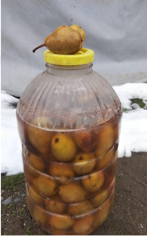
Görsel 32. Armut Sirkesi

Ağaçta tamamen olgunlaşmış küp armutları yaprakları seçilerek yıkanır. Temizlenen armutlar büyük bir bidona yerleştirilir ve üzerine su dökülür. Suyu ağzına kadar dökülünce üzerine bir avuç tuz eklenir ve bidonun ağzı sıkıca kapatılır. Yaklaşık bir ay serin bir yerde asitlenmesi beklenir. Bir ay geçince kontrol edilir asitlenmesi tamamlanmışsa yenilebilir. Bu armudun suyu hem insanlara hem de hastalanan hayvanlara iyi gelir (KK35).