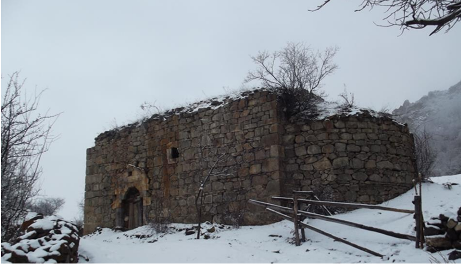
Görsel 12. Kayadibi mahallesi kilisesi

Kurtdüzü mahallesinde bulunan kilise ise özellikle içerisinde bulundurduğu semboller ve resimlerle çok dikkat çekicidir. Kilisenin tüm duvarları düzgün yontma taşla yapılmış, giriş kapısı güney tarafta olup, kapının üzerinde küçük bir ker geçişi vardır. Yapı sağlam durumdadır. Yüksek yerleşim alanlarında yapılan kiliselerde olduğu gibi burada da tabiat şartlarına bağlı olarak çatısı üçgeni geçişle tamamlanmıştır.