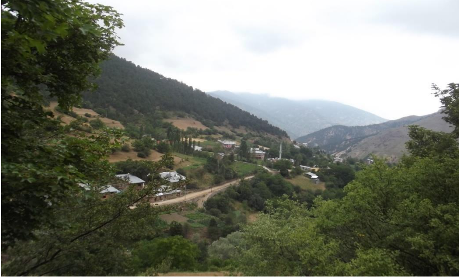
Görsel 5. Arpalı köyü