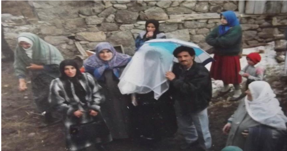
Görsel 17. Gelin alayında çarşaf giydirilmiş gelin

Kız evine giden yengelere kızın kardeşleri tarafından kahve ikram edilir. Yengeler kahve içerken önlerine ayak eni denilen bir bez serilir ve bu bez bir yengenin önüne serildiğinde ondan bahşiş istenir. Yengeler kahvelerini içerken kız kardeşler eğer onları iğneyle oturdukları yere dikebilirlerse kardeş ipliği çözmek için yengeden bahşiş ister. Yengelerden birinin başına doruk sakızı veya zif yapıştırılmaya çalışılır ancak yenge çok dikkatli olmalıdır. Yengenin üzerine çökelek sürülür. Çökeleğin temizlenmesi için yengenin çökeleği sürene bahşiş vermesi gerekir. Bu sırada yengelerden yaşı en küçük olan yenge, kız evinden bir şey çalmalı ve gelin çıkana kadar çaldığı şeyi gizlemelidir. Eğer gizleyemez yakalanırsa yengenin yüzüne çökelek sürülür (KK1, 9, 21, 31).