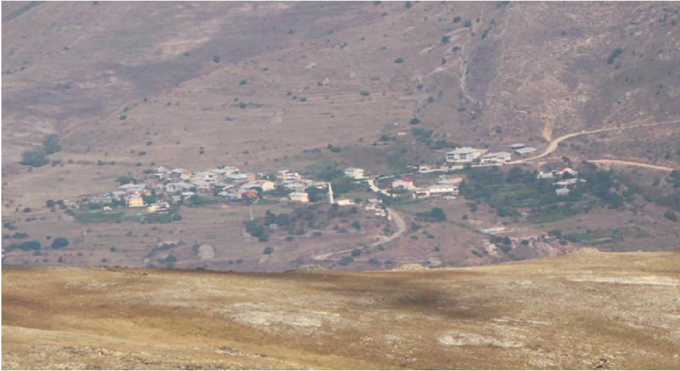
Görsel 6. Güzeloluk köyü

Güzeloluk köyü Torul ilçesine 28 km uzaklıktadır. 2017 tarihli nüfus sayımına göre köyün 27'si erkek 27'si kadın olmak üzere toplam nüfus 54'dür. Bu köyün gerçek nüfusu çeşitli sebeplerle göç etmiş, nüfus ve yerleşim oranı düşmüştür. Bu köyün diğer adı Beşkilise' dir. Bu isim köyde Rumlara ait olan 5 tane kiliseden dolayı verilmiştir. Köyün 1 camisi vardır (Üçüncüoğlu, 1988c, s.209).