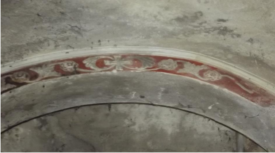
Görsel 15. Emruk mahallesi kilisesi içindeki şekiller

Köylerde her mahallenin birbirine yakınlığı veya uzaklığı dikkate alınmadan kilise inşa edilmesi, Rumların dinî vazifelerine ne kadar önem verdiğini göstermektedir. Demirkapı köyünün eski mahallelerinden biri olan Arpalı Köyü'nde papaz yetiştirme okulunun olduğu ve buradan yetişen papazların her pazar ayin için mahallelere ve diğer köylere gönderildiği bilinmektedir (KK10, 12). Rumların yörede tarım için inşa ettikleri yapıların sağlamlığı yöre halkını şaşkın bırakmakta, teknoloji olmadan bunu yapabilmiş olmaları yöre halkınca hayranlıkla karşılanmaktadır (KK8).