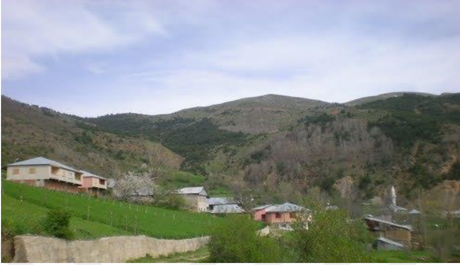
Görsel 7. Almyayla köyü

adı Macara ' dır. Bu köyün gerçek nüfusu çeşitli sebeplerle göç etmiş, nüfus ve yerleşim oranı düşmüştür. Köyün 1 camisi vardır (Üçüncüoğlu, 1988ç, s.235).