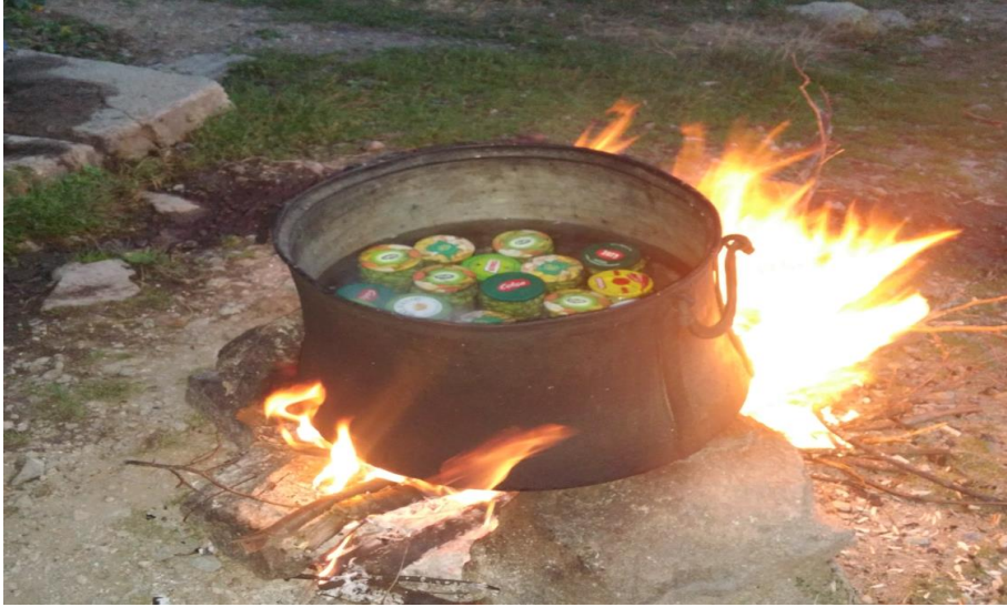
Görsel 30. Konserve şişelerinin pişirilmesi

Taze fasulyeler kırılır ve temizlenir. Yumuşayınca kadar kaynatılır, tuzu eklenerek kavanozlara koyulur. Kavanozlara koyulan fasulyeler bir kazana yerleştirilir ve bir saat pişirilir. Kışın kullanılmak üzere soğuk bir odada saklanır (KK21, 22, 26, 23, 31).