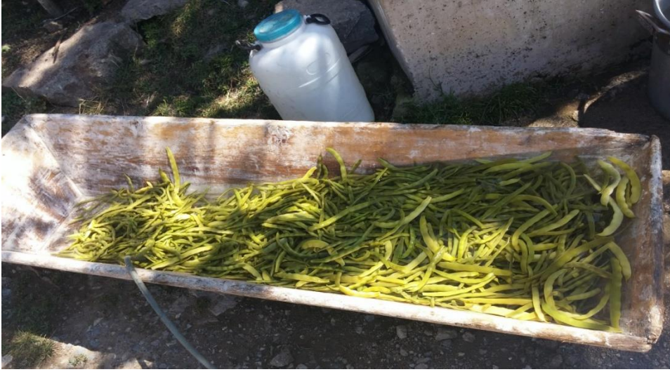
Görsel 31. Turşu için haşlanan ve külekte bekletilen fasulyeler

Fasulyelerin dipleri seçilir ve solması beklenir. Bir gün içinde solan fasulyeler on dakika haşlanır. Fasulyelerin çok yumuşamamasına dikkat edilir. Haşlanan fasulyeler bir gün soğuk suda bekletilir. Başka bir kaba soğuk su koyulur. Bu suyun içerisine acı biber, kalın tuz ve bir miktar sarımsak atılır. Fasulyeler bu kaptaki tuzlu suya bastırılır ve turşunun bekletileceği büyük kavanoza koyulur. Bu kavanoza turşular koyulurken sıkıca bastırılması ve kavanozda boşluk kalmamasına dikkat edilir. Kavanozun ağzına temiz bir bez örtülüp kapağı sıkıca kapatılır. İki ay bekledikten sonra turşu yenmeye hazır hâle gelir (KK1, 3, 5, 8, 17, 18, 21, 22, 33).