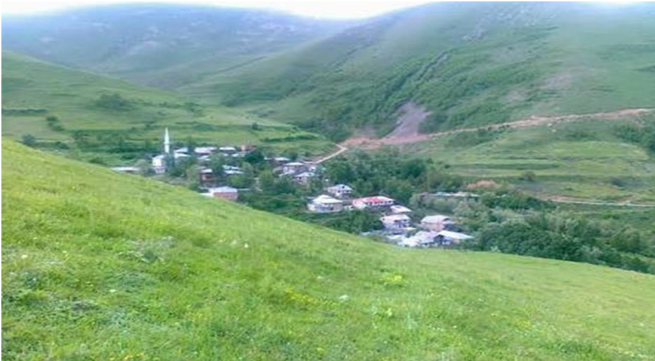
Görsel 8. Dağdibi köyü

Dağdibi köyü Torul ilçesine 39 km uzaklıktadır. 2017 tarihli nüfus sayımına göre köyün 13'ü erkek 8'i kadın olmak üzere toplam nüfus 21'dir. Bu köyün eski adı Fidikar ' dır. Köyün eski adının Rumlar tarafından verildiği düşünülmektedir. Osmanlı-Rus savaşının yaşandığı ve çokça şehit verilen Olukman Yaylası bu köy sınırları içerisinde. Köyün 1 camisi vardır (Üçüncüoğlu, 1988d, s.234).