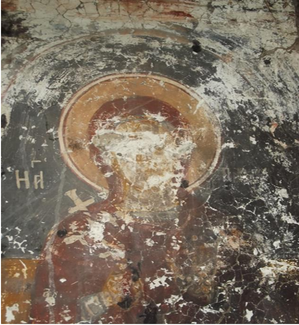
Görsel 13. Kurtdüzü mahallesindeki kilise içi şekilleri

Kurtdüzü mahallesinde bulunan kilise ise özellikle içerisinde bulundurduğu semboller ve resimlerle çok dikkat çekicidir. Kilisenin tüm duvarları düzgün yontma taşla yapılmış, giriş kapısı güney tarafta olup, kapının üzerinde küçük bir ker geçişi vardır. Yapı sağlam durumdadır. Yüksek yerleşim alanlarında yapılan kiliselerde olduğu gibi burada da tabiat şartlarına bağlı olarak çatısı üçgeni geçişle tamamlanmıştır.