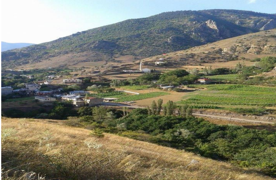
Görsel 4. Demirkapı köyü

Demirkapı köyü Torul ilçesine 26 km uzaklıktadır. 2017 tarihli nüfus sayımına göre köyün 93'ü erkek 111'i kadın olmak üzere toplam nüfus 194'tür. Bu köyün gerçek nüfusu çeşitli sebeplerle göç etmiş, nüfus ve yerleşim oranı düşmüştür. Bu köyün eski adı Manastır, Monasteri' dir. Bu isim burada yaşayan Rumlar tarafından verilmiştir. Köy tarihî ve kültürel olarak oldukça zengindir. Diva tipi bir yerleşime sahiptir. 1 camisi ve 3 adet köy okulu vardır, ancak köy okullarında eğitim-öğretim yapılmamaktadır (Üçüncüoğlu, 1988a, s.229).