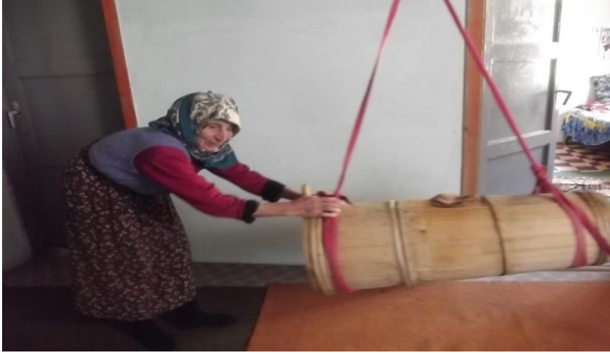
Görsel 29. Odun yayık ile yağ çalkalama