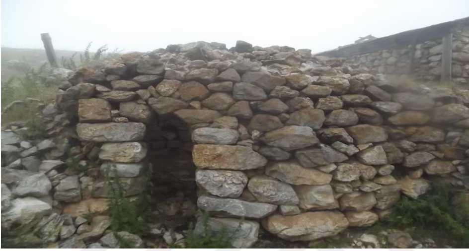
Görsel 23. Arpalı yaylasındaki Rum kelifi