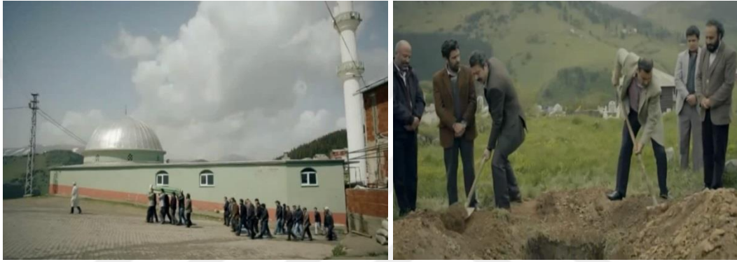
Resim 47. Bir Sevda İşi, Cenaze Kaldırma ve Toprağa Verme

insan haklarına saygılı olmak, İslam'ın değişmez kurallarından biridir. Filmde de bu kavramların önemi, Ökkeş dayının örnek hareketiyle yansıtılmaya çalışılmıştır. Diğer bir dinsel kod ise Ökkeş dayıya yapılan cenaze törenidir. İslamiyet dininde ölen bir kimse için önce camide cenaze namazı kılınır ardından toprağa gömülür. Cenaze töreninde, ilk önce önde giden imam sahnede görünür. Üzerinde cübbesi vardır ve kafasında da takkesi bulunur. O sırada camiden sela sesi gelir ve köy halkından birkaç kişi tabutu omuzlarına alır. Musa da yüksek sesle “Allah rahmet eylesin, mekânı cennet olsun” diye bağırır. Köy halkıda “amin” diye cevap verir. Sonra da toprağa verilir.