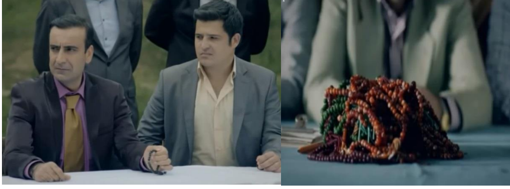
Resim 48. Bir Sevda İşi, Tespih Çekme ve Tespihle Oy Sayma Sahnesi