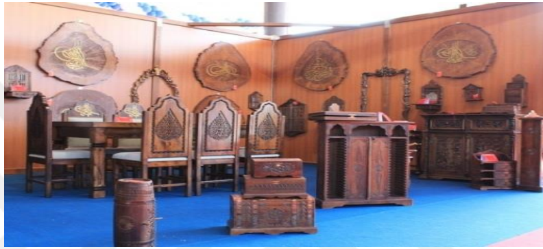
Resim 3. Kastamonu Ahşap Oymacılığı (Kastamonukultur.gov)