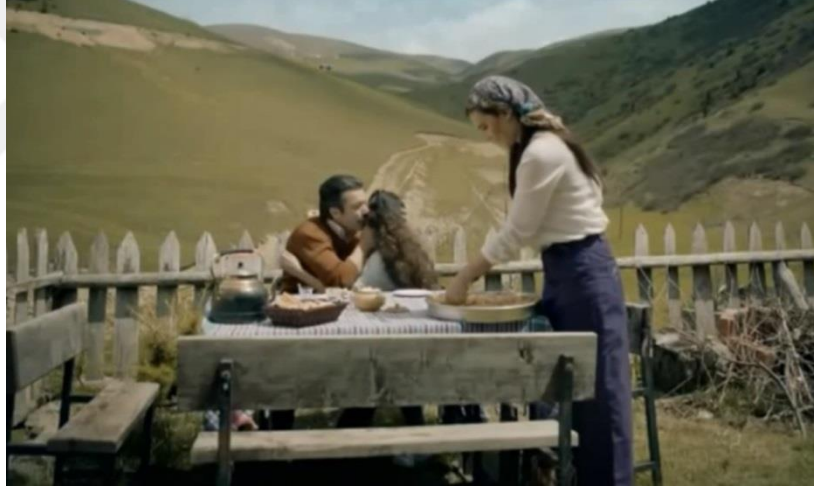
Resim 46. Bir Sevda İşi, Ailenin Sofraya Oturduğu Sahne

Seçim zamanında iki adayda konvoy oluşturmuştur. Toplu bir biçimde hareket etmek ve bir arada bulunmak başkan adaylarının kendilerini daha güçlü hissetmelerini sağlamıştır. Türklerde, kutlama, düğün, seçim gibi zamanlar olduğunda peş peşe arabalar dizilerek korna çalılıp tur atılır. Göçebe toplumlardan itibaren insanlar sürekli bir arada yaşamış ve birbirlerine destek olmuşlardır. Bu da günümüze kadar Türk kültüründe alışılmış bir ritüel olmuştur. Filmde geçen diğer bir sahnede ailenin birlikte sofrada oturup yemek yemesidir. Yasin'in eşi, eve kocası gelmeden yemeğe oturmaz. Burada da kadının ailedeki görevi belirtilmiş, evde yemek yapıp çocuğuna bakan bir profil çizilmiştir. Filmde, hep birlikte muhabbet ederek yemek yemeleri, ailenin birlik beraberliği güçlendirici yönünü vurgulamıştır.