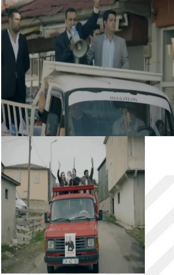
Resim 41. Bir Seveda İşi, Megafonla Seçim Aracında Gezdikleri Sahne

Köy meydanında yapılan düğünde, uzun masalar kurulmuştur. Ampuller asılmış ve balonlarla meydan süslenmiştir. Diğer bir taraftan da davul zurna çalmaya başlamıştır. Türk kültüründe davul zurna ile düğün yapmak gelenek ve görenek içerisinde yer alır. Türk coğrafyasında davul zurna, simgesel değerler taşır. Örneğin; Orta Asya Türklerin’de bazı mezarların içerisinde davul bulunduğu bilinmektedir. Ayrıca yine davul zurna musikisiyle birlikte hastaları tedavi ettikleri için özel bir değer atfedilmiştir. Davul, aynı zamanda Türk devletlerinde bir sembol haline de gelmiş ve güçlü bir yapıyı da vurgulamıştır. Filmin son sahnesinde Musa’nın odasında yansıtılan dekorlar ise duvara asılı Atatürk portresi, koltuk, masa ve üzerinde de Türk bayrağı, telefon, kalemlik bulunmaktadır. Türkiye Cumhuriyeti’nin kurucusu Mustafa Kemal Atatürk’ün portresi her kamu kurumunda bulunmaktadır. Ayrıca Türk bayrağı da Türk milletinin simgesini oluşturması bakımından, bu iki değerli unsurun sade bir biçimde dekore edilen belediye başkanı odasında kullanıldığı görülmüştür.