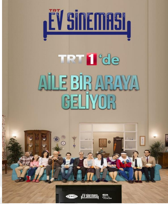
Resim 6. TRT Ev Sineması Kuşağı Afişi

TRT birçok dizi, program ve belgeselin yanı sıra son olarak da televizyon filmi çekmeye başlamıştır. Türk sinemasına yeni eserler ve genç senaristler kazandırmak, projenin diğer hedeflerinden biridir. Böylece proje internet sitesinde söylendiği gibi 'hikâyesi olan herkese açık' bir şekilde tasarlanmıştır. Ayrıca sitede, senaryo yazmayı bilmeyen fakat senaryo göndermek isteyenler için "Senaryo Nasıl Yazılır" köşesinde, The Script Lab ile beraber hazırlanan senaryo dersleri bulunmaktadır. Yine bu süreçte, hayata geçirilecek projelere yönelik, alanında uzman senaristler ve senaryo doktorları ile birlikte gerçekleştirilecek "Senaryo Geliştirme Atölyeleri" ve dünyanın en ünlü sinema okullarından "New York Film Akademisi"nin Hollywood deneyimli uzman eğitmenleri eşliğinde gerçekleşecek "Yapım Geliştirme Atölyeleri" ile filmlerin sanatsal ve yapım niteliklerinin artırılması amaçlanmaktadır ( http://www.trttvfilmleri.com/tr/proje-hakkinda , E.T._03.02.2019). Bu atölyelerde 12 gün süre ile 6-10 kişilik ekipler şeklinde çalışmalar yürütülür ve eğitmenler tarafından dramın evrensel ilkeleri ile senaryo değerlendirilerek çekilecek filmler bu süreçlerden sonra belirlenmiş olur.