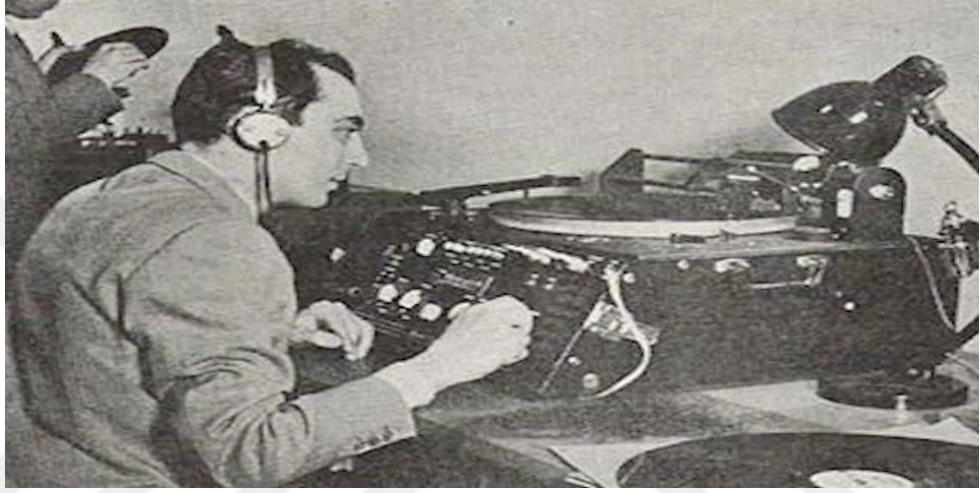
Resim 4. TRT'nin İlk Radyo Anonsu, (TRT Haber, 2018)

"Alo Alo Muhterem Samiin (dinleyiciler), Burası İstanbul Telsiz Telefonu... 1200 metre tulu mevç (dalga boyu), 250 kilosıkl. Şimdi akşam neşriyatımıza başlıyoruz. (Şefik, 1927: ilk radyo anonsu)" 6 Mayıs 1927'de Sirkeci Büyük Postane'sinin bodrum katında 5 kilovat vericiyle yapılan ilk radyo yayını, Eşref Şefik'in yaptığı bu anonsla başlamıştır (Açıklan, 2018, s.10).