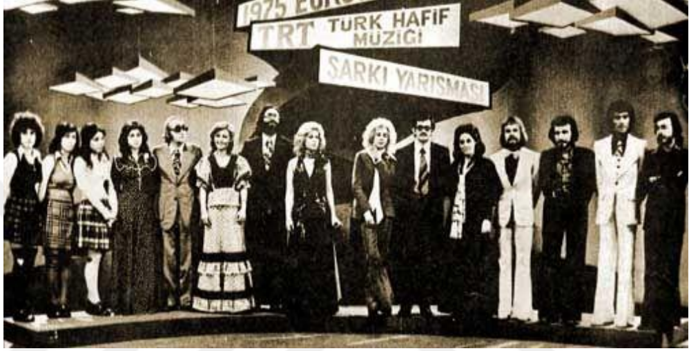
Resim 5. TRT Eurovision Ulusal Elemeleri ( https://eurovision-turkey-love.tr.gg/Eurovision-Ser.ue.venimiz.htm , 2013)

televizyon ekranından yansımıştır. 1973’de ise, Türkiye Cumhuriyeti’nin 2. Cumhurbaşkanı İsmet İnönü’nün cenaze töreni naklen yayınlanmıştır. 20 Temmuz 1974’de başlayan Kıbrıs Barış Harekâtından tüm Türkiye ve Avrupa TRT yayınlarıyla haberdar olmuştur. Eurovision Şarkı ve Beste Yarışması’na Türkiye, ilk kez 1975’de TRT’nin organizasyonu ile girmiştir. 1978’de ilk kez su altı kameraları kullanılarak “Derinlerdeki Geçmiş” adlı belgesel renkli film çekilmiştir ( https://www.trt.net.tr/Kurumsal/tarihce.aspx , E.T. 01.02.2019).