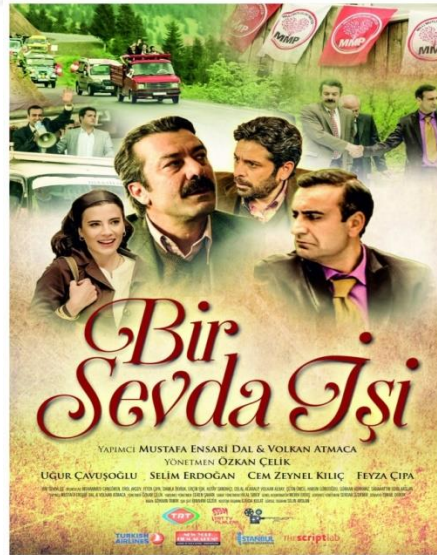
Resim 34. Bir Sevda İşi Filmi'nin Afışı

TRT TV Filmleri kapsamında 2016'da çekilen Bir Sevda İşi filmi, dram-komedi ağırlıklı olup 95 dakika sürmektedir.