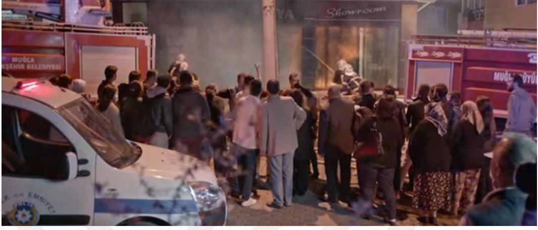
Resim 21. Ekisporter, Dükkanın Yandığı Sahne

sopayla döver. Tayyar, gece içmiştir ve gider Turan Usta'nın dükkanını ateşe verir. Bunu duyan Turan Usta, dayanamaz ve kalp krizi geçirerek hastaneye kaldırılır.