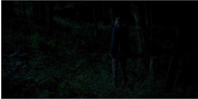
Resim 10. Son Kuşlar, "İşte Sizin Çocuklarınıza Karşı Benim Çocuğum" Babasının Kuşlara Karşı Seslendiği Sahne

Gece olur ve köy halkı, Bekir'in evine gelir. Bekir'e, "her şeyimiz ters yüz oldu ne zamandır, buralı değilsin gideceksin, artık acısını bizden çıkaracaklar" diye söylenmeye başlarlar. Bekir de bağınıza bahçenize sahip çıkamıyorsunuz, çocuğunuzu evlendireceğinize kavga ediyorsunuz, sonrada kapıma gelip benden hesap mı soruyorsunuz, defolun gidin kapımdan" diyerek çıkışır köy halkına. O esnada Ayşe hala Bekir'in babasına, "haydi erkekler kalkıp gereğini yapsın" diyerek Bekir'i cezalandırmanın vakti geldiğini söyler. Bekir, İstanbul'a gitmek için yola çıkmıştır ve köy halkı yolda Bekir'i durdurur. Babası, Bekir'in elini bağlayarak ormana götürür. Bekir'e dönüp; "sana söyledim, anlattım, beni dinlemedin, başımı öne eğdirdin" der. Bekir'i gece ormanda eli kolu bağlı bırakır ve ormandaki kuşlara dönüp: " işte sizin çocuklarınıza karşı benim çocuğum" diyerek ormandan ayrılır. Film, Bekir'in "baba yapma ne olur, baba" inlemeleriyle biter.