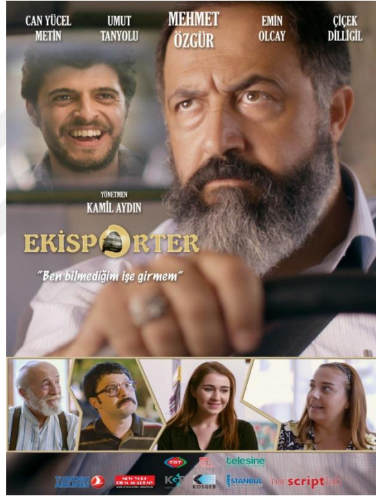
Resim 18. Ekisporter Filmi'nin Afışı

TRT TV Filmleri kapsamında 2016'da çekilen Ekisporter filmi, dram-komedi ağırlıklı olup 90 dakika sürmektedir.