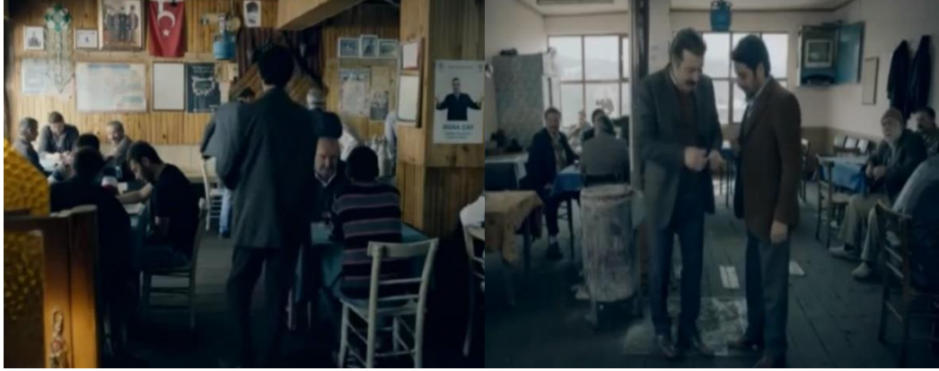
Resim 40. Bir Seveda İşi, Kahvehanede Kullanılan Dekor