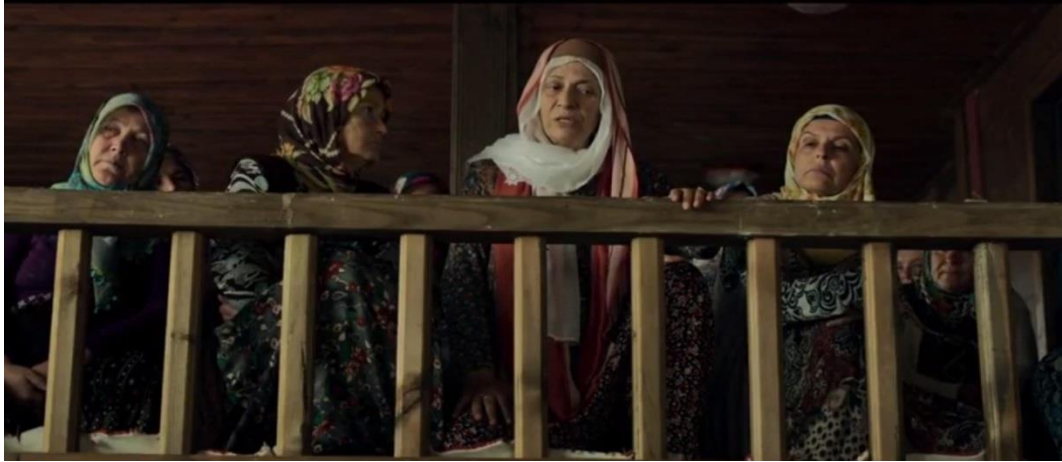
Resim 13. Son Kuşlar, Köy Kadınlarının Giyimi