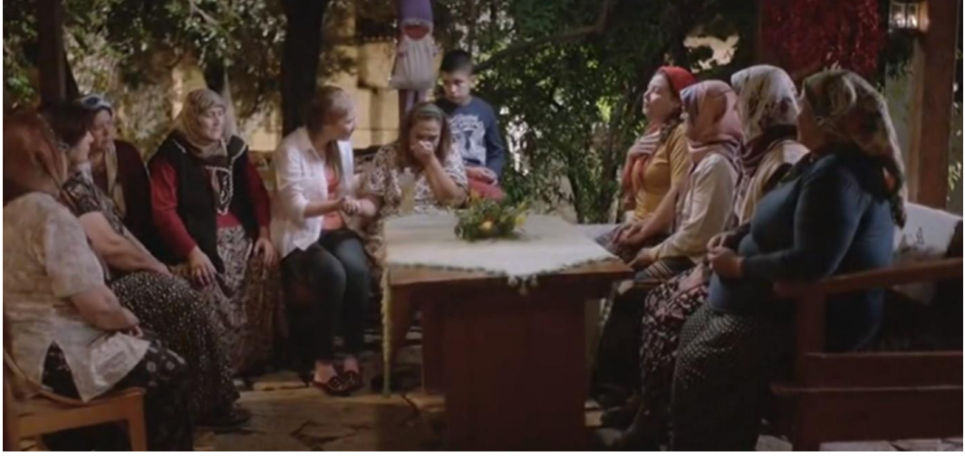
Resim 28. Ekisporter, Komşuların Kıyafetleri