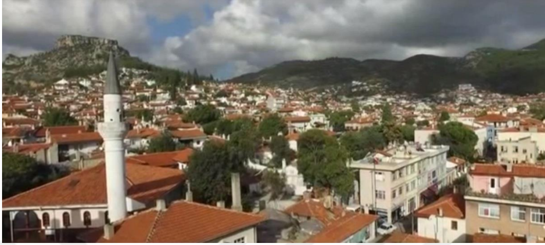
Resim 32. Ekisporter, Geçiř Sahnesinde Minarenin Kullanımı

beraberliğin oluřtuđu, sevginin saygının geliřtiđi, kulların kendini Allah'a daha yakın hissettiđi mekândır.