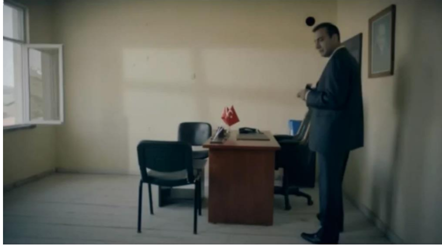
Resim 38. Bir Sevda İşi, Musa'nın Makamına Geldiği Sahne