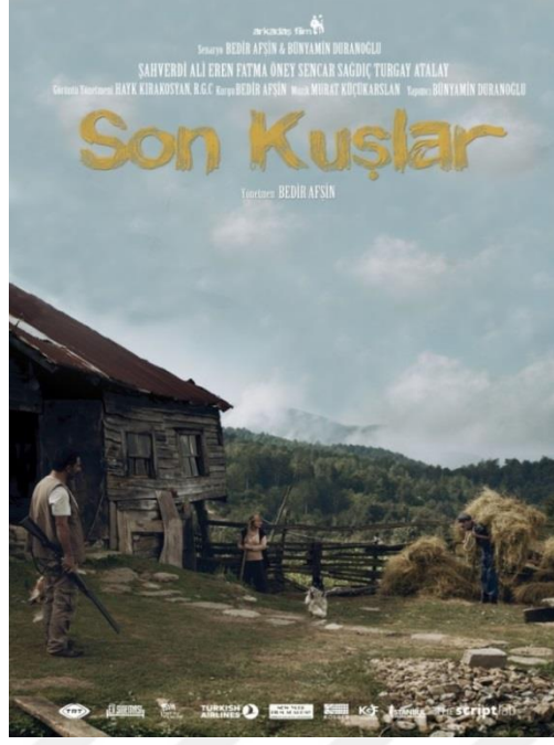
Resim 7. Son Kuşlar Filmi'nin Afişi