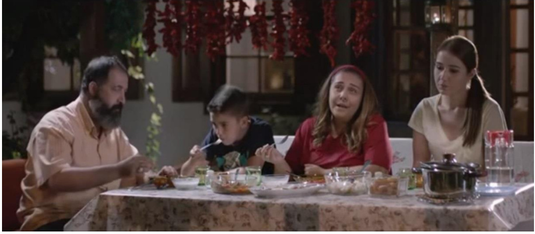
Resim 29. Ekisporter, Ailenin Sofrada Birlikte Yemek Yemesi

Filmde, komşuların yardımlaşması ve esnaf dayanışması da sıkça görülmektedir. Zeliha, bilmediği bir el işi örneğini öğrenmek için komşusuna gider ve ondan yardım ister. Diğer bir sahne ise Turan Usta'nın karakola düştüğünde, komşuların teselli için hemen Zeliha'nın yanına gelmeleridir. Türk toplumunda komşunun yeri, her daim çok önemli sayılmıştır. Bu yüzden "komşu komşunun külüne muhtaçtır, ev alma komşu al" gibi Türk atasözleri de bu değeri desteklemektedir. Aynı şekilde esnaf arkadaşları da Turan Usta'nın hastanede olduğunu öğrenince, ona yardım etmek istemişlerdir. Fuat Usta da hastaneye kaldırılan Turan Usta için alacaklılarla bir bir konuşarak, borçlarının askıya alınmasını rica etmiştir. Ayrıca Türkler de anlaşma anlamında yapılan el sıkışma ritüeli de halen kullanılmaktadır.