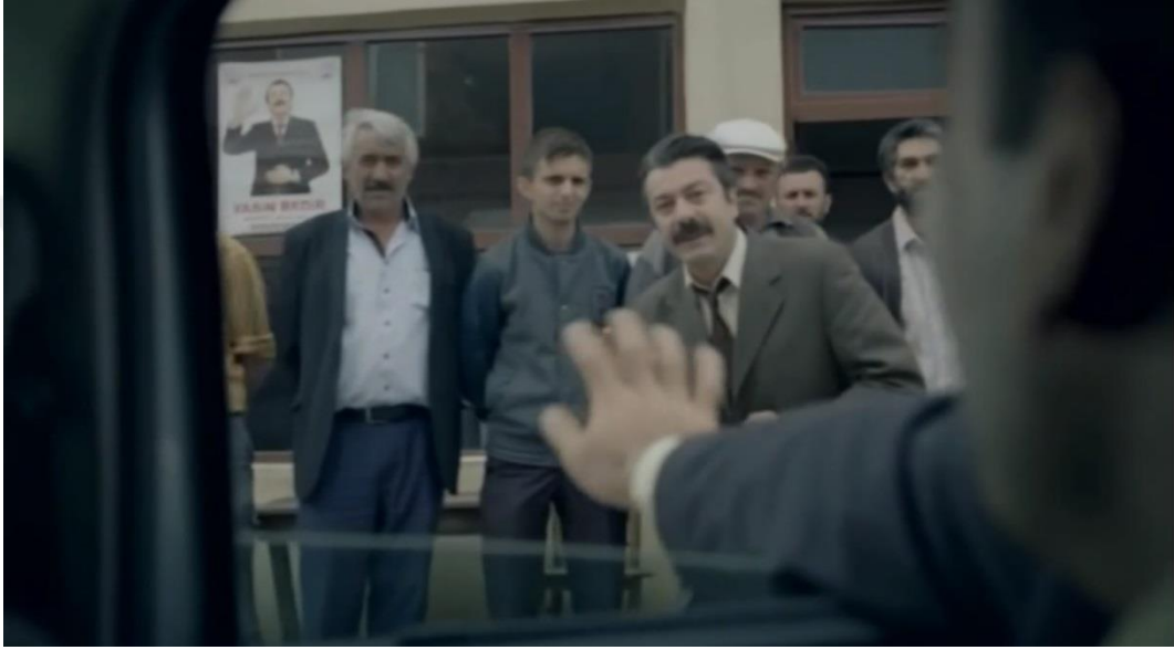
Resim 39. Bir Sevda İşi, Milletvekilinin Meydanda Köy Halkını Selamlaması

faaliyetin de yürütüldüğü yerlerdir. İnsanların, eskiden dış tehditlere karşı kendilerini korumak ve ortak bir alanda toplanarak kontrolü sağlamaları sebebiyle meydanlar ortaya çıkmıştır. Köy meydanı da filmde kamusal bir alan olarak yansıtılmıştır. Son mekân olarak; Kümbet Belediye binasında Musa'nın makam koltuğuna oturduğu sahne görülmektedir. Köyde makam odası gösterişsiz yani daha sade yansıtılmıştır.