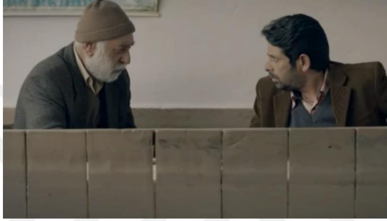
Resim 42. Bir Seveda İşi, Köydeki Erkeklerin Giyimi

Filmde geçen kostümlere bakıldığında; erkekler gömlek, süveter, yelek ve üstlerine ceket giymektedirler. Bazı köy büyüklerinin kafasına da takke taktığı görülür. Kadınlar ise başörtü olarak yazma, basma etek ve üstlerine şal almıştır. Türk kültüründeki köy giyimini yansıtması bakımından filmde tutarlı kostümler seçilmiştir.