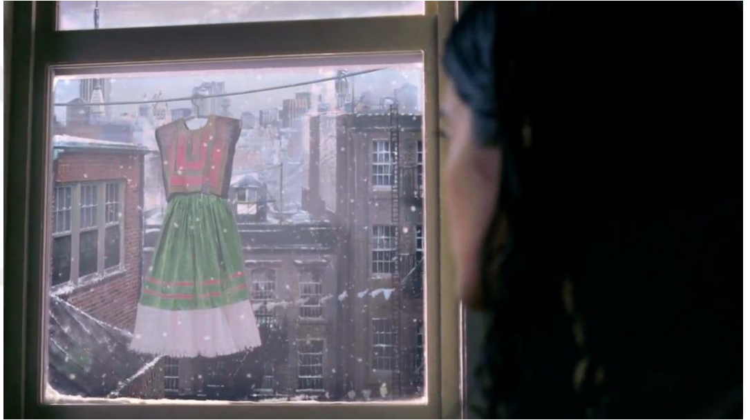
Görsel 2: Frida, New York'tadır ve Meksika'ya dönmek istemektedir.

robotlara benzeterek korkuları ifade edilmektedir. Frida ve Diego sergi için New York'a gittiklerinde, Frida, onu Empire State binasına tırmanan King Kong olarak hayal etmektedir. John D. Jr'ın, Diego'yu, Lenin'in portresinin yaptığı için babasını gücendireceğini söyleyerek bu detayı değiştirmesini istediğinde, Diego, bunu yapmadığı için şine son verildiğinde ise Frida, Diego'yu, Empire State binasından düşmekte olan King Kong olarak hayal etmektedir. Bu olaydan sonra Frida, eve dönme zamanının geldiğini düşünse de, Diego, eve dönmek istememekte hemen sonrasında ise Frida, pencereden dışarı baktığında ipte asılı duran yeşil ve kırmızı renkli bir elbise görmektedir.