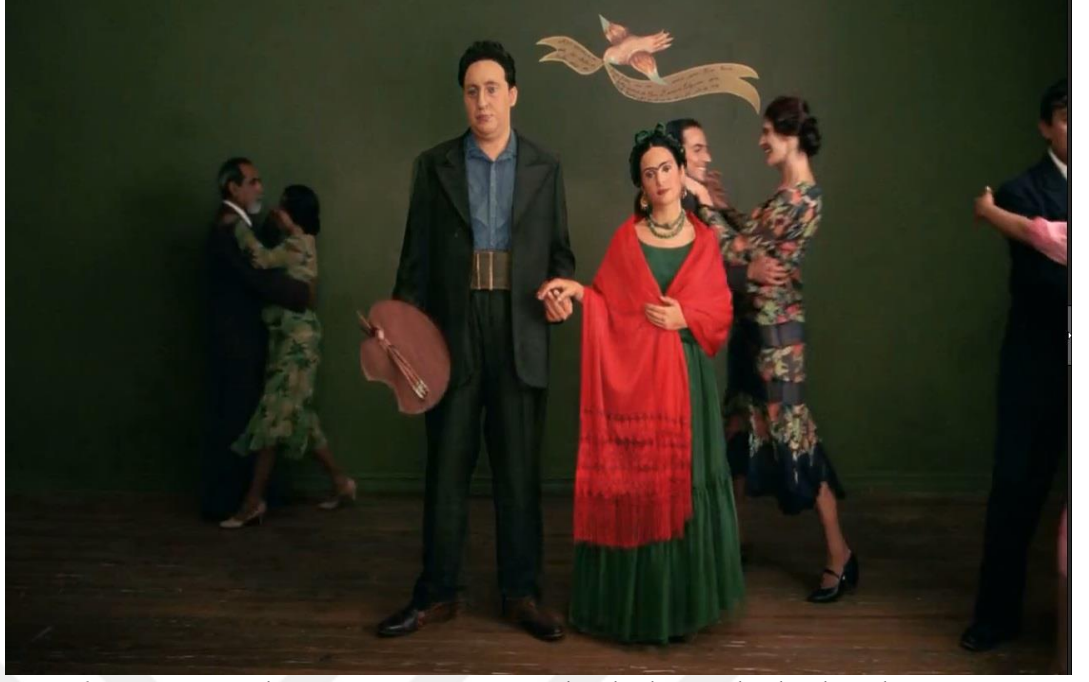
Görsel 3: Frida'nın düğün günü, resmin canlandırılma yoluyla aktarılması.

Kırmızı ve yeşil renklerden oluşan kıyafeti düğün sahnesinde de verilmektedir. Kırmızı rengin tutkuyu, yeşil rengin ise utangaçlık, içe kapanıklık, aynı zamanda doğanın ve gelişme potansiyelinin de renkleri olduğu belirtilmektedir (Ryan, Lenos, 2014, s. 44). Frida'nın giysilerinde kırmızı ve yeşil renklerin dengeli bir şekilde verilmediği görülmektedir. Özlem duyduğu Meksika'ya geri dönmeyi hayal ettiğinde düşündüğü elbisede yeşil renk baskınken, düğünde verilen kıyafetinin üzerine attığı şalın kırmızısı baskın olarak görülmektedir.