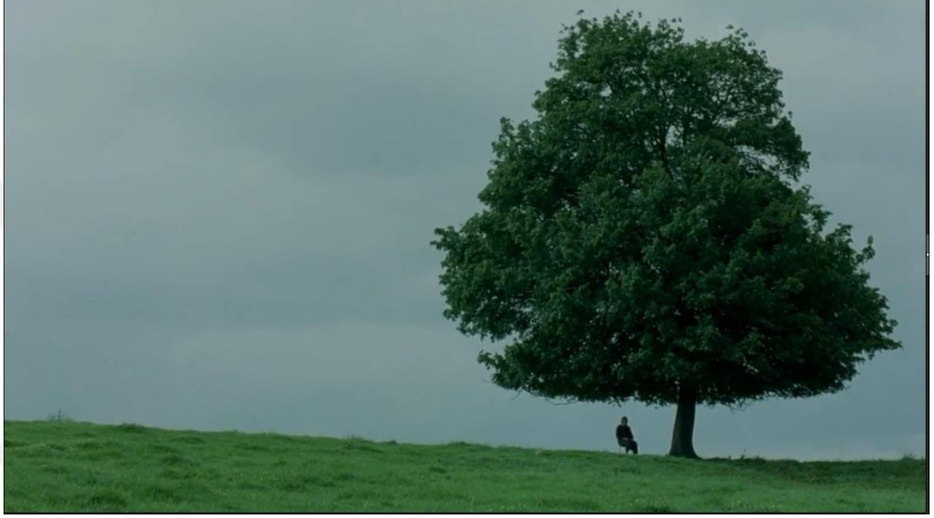
Görsel 11: Filmin son sahnesi.

sanatçı olsa da, kadınların sanattaki statüsü konusundaki bilincin hala zayıf olduğu düşünülmektedir. Daha da önemlisi, feminist ve genel olarak kadın sanatçılar statüleri için ne yapılması gerektiği konusunda anlaşma sağlayamamaktadırlar (Gouma-Peterson, Mathews, 2016, s. 62). Wilhelm'in de doğal yeteneğini gördüğü Seraphine'in resimlerinin sergilenmesi konusunda sürekli bir ötelemede bulunması, Seraphine'in kadın olması, onun resimlerine alıcı bulamayacağı düşüncesi ve güvenli bir yatırım olarak görmediği için buna cesaret edememiş olması düşünülebilmektedir.