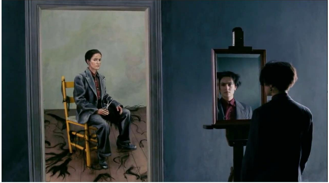
Görsel 4: Frida, Diego'dan ayrıldığında

Lacan'ın, sinema arařtırmaları alanında etkili olan ayna evresi alıřmaları, sinema ile onu evreleyen toplum arasındaki iliřkiyi özömlmek için bir yöntem sunması aısından önemli olduėu düşünölmektedir. Lacan ve Althusser'den faydalanan film teorisi, zihnin ve ruhun iřleyiři ile sinemasal aygıtlar arasındaki benzerlikleri arařtırmaya bařlamaktadır. Lacan “Özne-Ben'in İřlevini Oluřturan Ayna Evresi” bařlıklı alıřmasındaki aynanın, aynı zamanda toplumsalın metaforu olarak da kullanılabildiėi söylenmektedir. Lacan ayna imgesinin evrilmesinin, öznenin olgunlařması için bir önkořul olduėu da öne sürölmektedir (Diken, Laustsen, 2014, s. 29,30). Frida'nın yařadığı kötü olaylardan sonra filmde ayna karřısında verildiėi görölmektedir. İlk ayna sahnesi, Diego'nun Frida'yı kız kardeři ile aldattığı olayın sonunda salarını kestiėi sırada, diėeri ise, Frida'nın kangren olan bacağıının kesilmesinden sonra kendisini kırık sütun olarak resmetmesi verilmektedir.