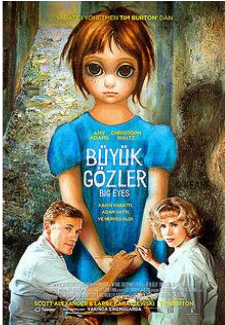
Görsel 12: “Big Eyes” Film Afişi

Afişler, film tanıtımında rol oynayan etkili görsellerdir. Film hakkında önemli ipuçları vermektedir. Dolayısıyla afişi inceleyerek filmin