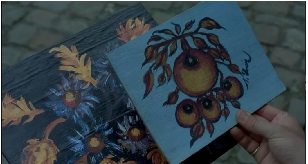
Görsel 7: Seraphine, resimlerini Wilhelm'e gösterir.

1905 yılında 41 yaşında olan Seraphine'in, kaba görüntüsüne rağmen naif karakterli bir yapısı bulunmaktadır. Yalnız yaşayan Seraphine, çamaşır yıkayarak ve temizlik yaparak geçimini sağlamaktadır. Bu yaşlarda, içinden gelen bir sesle resim yapmaya başlamaktadır. Hiç sanat eğitimi almamasına rağmen, kendine özgü çiçek ve meyve resimleri yapmaktadır. Temizlikten kazandığı tüm parasını boya malzemelerinin bir kısmını satın almak için kullanmakta pek çoğunu doğadan elde etmektedir. Seraphine'in, Wilhelm'e “biliyor musunuz, kendimi üzgün hissettiğimde, kırlarda yürüyüşe çıkarım ve ağaçlara dokunurum, kuşlarla, çiçeklerle, böceklerle konuşurum ve kendimi daha iyi hissederim, yemin ederim, daima çok daha iyi hissederim” ifadesinden onun doğaya olan sevgisi anlaşılabilir.