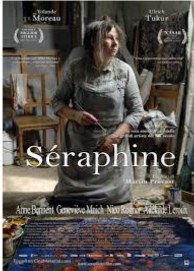
Görsel 6: "Seraphine" Film AfiŖi

"Seraphine" filmi afiŖinde, Seraphine, çerevenin ortasında konumlandırılmıŖ, elinde fırasıyla dizlerinin üzerinde ökmüŖ, yerde resim