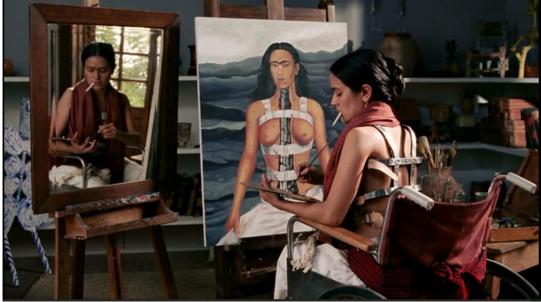
Görsel 5: Frida'nın kendisini kırık sütun olarak resmetmesi.

Lucien Dallenbach, iyi yerleştirilmiş bir aynanın arkamızda ne olup bittiğini görmemize ve görüş alanımızın dışında kalan şeyi açığa çıkarmaya olanak sağladığını söylemektedir. Andre Gide ise bir anlatıyı daha iyi aydınlatanın onun iç anlatısı olduğunu ifade etmektedir (Aktulum, 2011, s. 440). Filmin anlatım yapısının yansıma özelliği taşıyan bir ayna kullanılarak desteklendiği düşünülebilmektedir. Aynadan yansıyan anlatının filmde iki farklı yerde kullanıldığı ve her defasında duygusal bir çöküşten sonra yer aldığı görülmektedir. Filmin sekanslarında, izleksel ve anlamsal düzeyde bir benzeşiklik ilişkisi kurulmakta, paralel bir anlam üreterek, anlamı desteklemektedir.