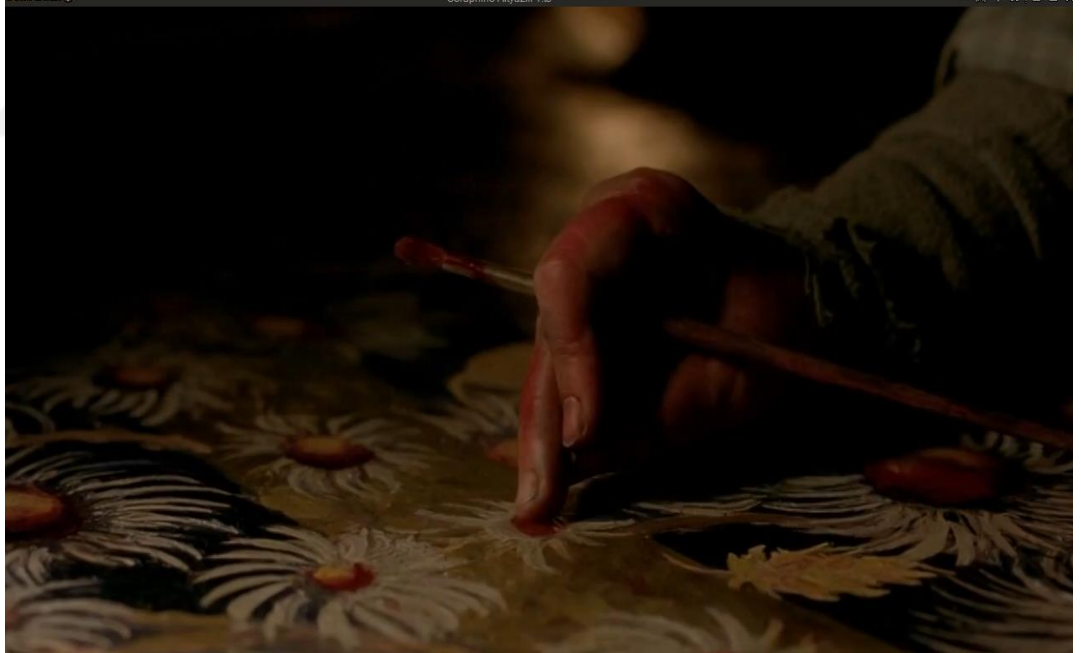
Görsel 8: Seraphine, elleriyle resim yapmaktadır.

Bir resmin iletisi zaman ve mekâna göre deęişkenlik gösterebilmektedir. Görünümsel ileti aynı kalsa bile önemi, değeri deęişebilmektedir, Resim, çok özgünken sıradanlaşabilmekte, bu sıradanlaşma halinde dahi kimi resim, ilk olma özelliğini korumaktadır (Erinç, 2009, s. 62). Seraphine'in kendine özgü bir tarzı bulunmaktadır. Onu keşfeden ise Picasso'nun resimlerinin ilk alıcısı ve Henri Rousseau'yu keşfeden Alman koleksiyoncu Wilhelm Uhde'dir. Wilhelm Uhde, bir akşam yemeğinde, ev sahibesinin evinde, yerde görerek ortaya çıkardığı Seraphine'in resmindeki yeteneęi görebilmektedir. Seraphine'in yaptığı resimlerde, Wilhelm'den önce ve sonrası arasında farklar bulunmaktadır. Wilhelm'den önce daha primitif olan resimleri küçük boyutlu ve tamamen doğal boya ile yapılmakta, sonrasında ise doğal olmayan boylarla daha renkli, daha büyük boyutlu ve soyut karakterli çiçekler içermektedir. Daha çok ellerini kullanarak, dizlerinin üzerinde yerde resim yapması ise deęişmemektedir.