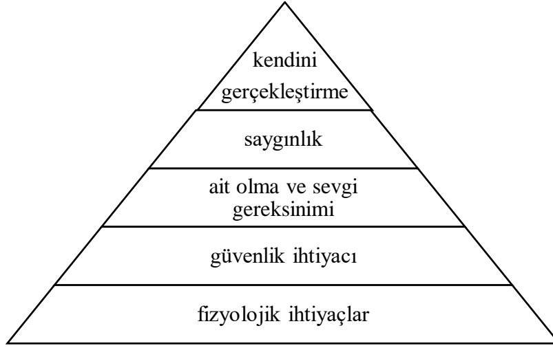
Őekil 2. Maslow'un insan güdülerinin piramidi