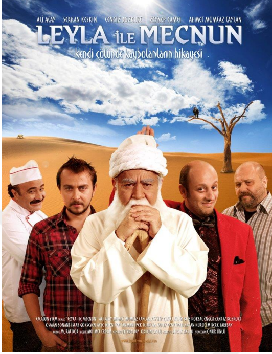
Görsel 1. Leyla ile Mecnun Dizisinin Afişi

Leyla ile Mecnun dizisi 2011- 2014 yılları arasında TRT 1’de 3. Sezon halinde 104 bölüm olarak yayınlanmıştır.