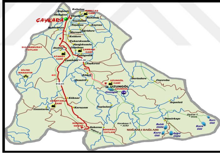
Şekil 3.1. Çalışma alanına ait harita (Anonim, 2016d)

Yüzölçümü bakımından Trabzon'un ikinci büyük ilçesi olan Çaykara, 33 mahalle den oluşmaktadır. İl merkezine 75 km, sahile uzaklığı ise 25 km'dir. Solaklı deresinin ayırdığı vadi boyunca uzanan ve bir vazo şeklini andıran ilçenin rakımı 250 metreden başlayıp 3376 (Demirkapı) metreye kadar çıkan yüksek derecede eğimli arazi yapısına sahiptir. 573 km 2 'lik alana sahip olan ilçenin toplam tarım alanı ise yaklaşık 30 km 2 'dir. İlçede ceviz ağaçları 1300 metre yüksekliğe kadar olan mahallelerde ve tek tek ağaçlar halinde bulunmakta, 1300 metreden yüksek mahallelerde (6 mahalle) ceviz ağacı bulunmamaktadır (Anonim, 2016).