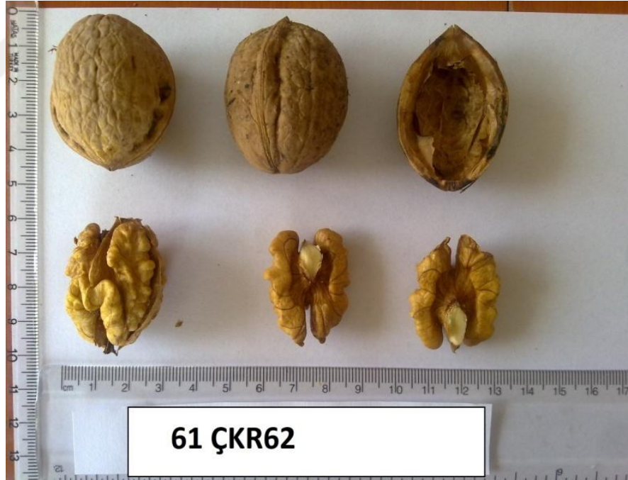
Şekil 4.1. Genotip 62' ye ait resim