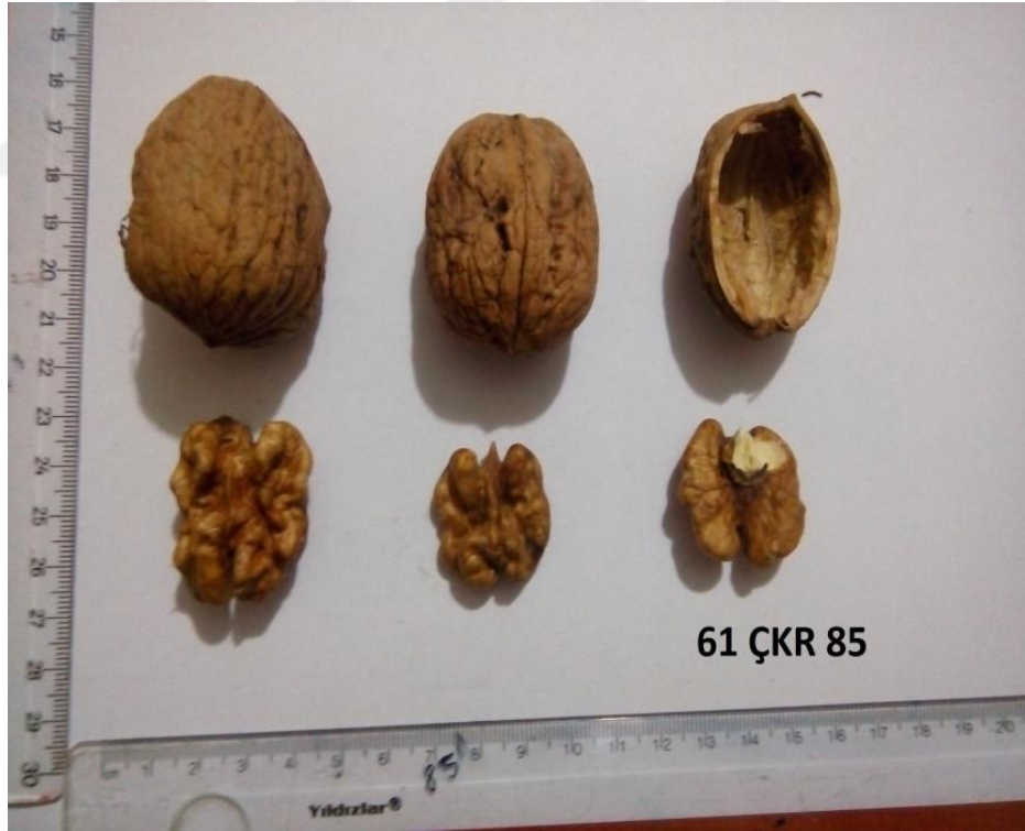
Şekil 4.9. Genotip 85'e ait resim