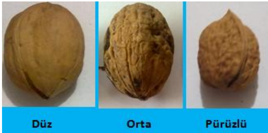
Şekil 3.4. Genotipler için kullanılan kabuk pürüzlülüğü skalası

3.2.1.8. Kabuk Pürüzlülüğü: İncelenen genotiplerde meyve kabuk yüzeyleri “düz”, “orta” ve “pürüzlü” olarak değerlendirilmiştir (Ölez, 1971).