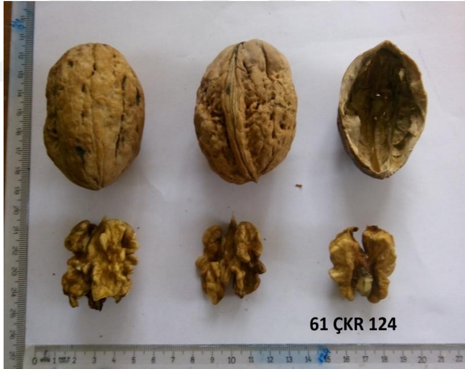
Şekil 4.3. Genotip 124'e ait resim