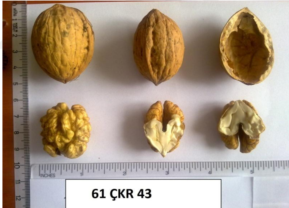
Şekil 4.6. Genotip 43'e ait resim