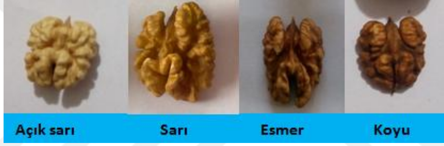
Şekil 3.3. Genotipler için kullanılan meyve iç renk skalası

3.2.1.7. İç Rengi: Meyveler iç rengine göre açık sarı, sarı, esmer ve koyu olarak değerlendirilmiştir (Yarılgaç, 1997).