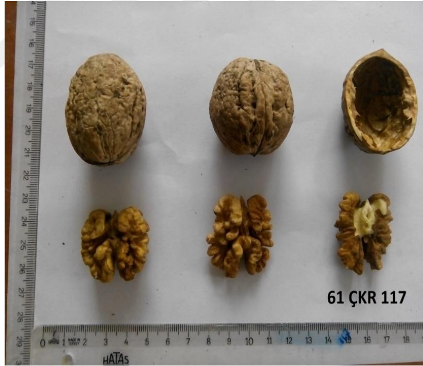
Şekil 4.2. Genotip 117' ye ait resim