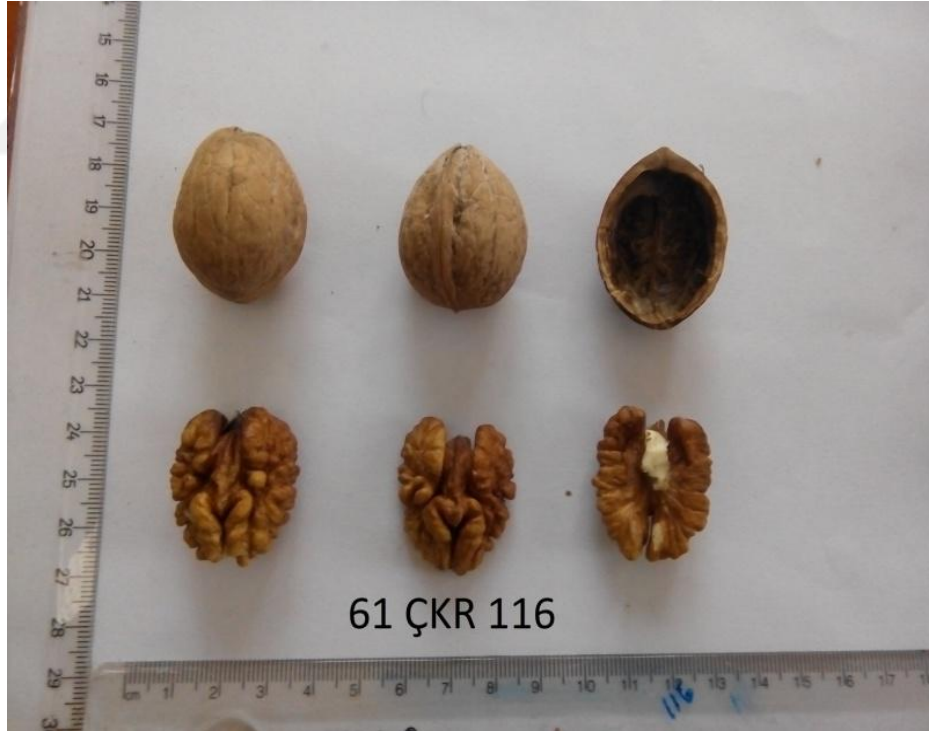
Şekil 4.10. Genotip 116'ya ait resim