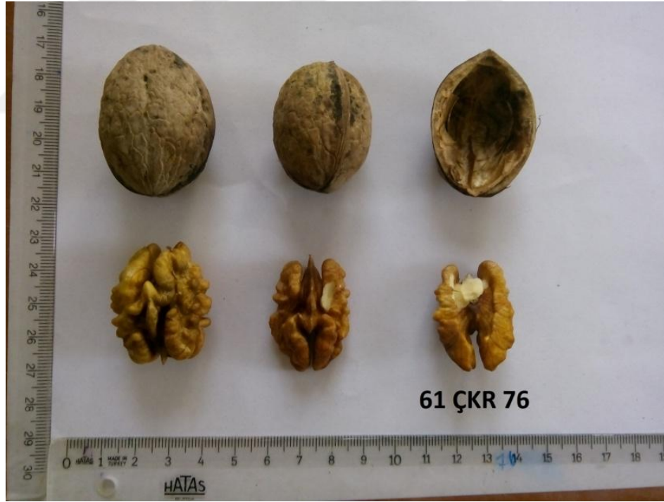
Şekil 4.4. Genotip 76'ya ait resim