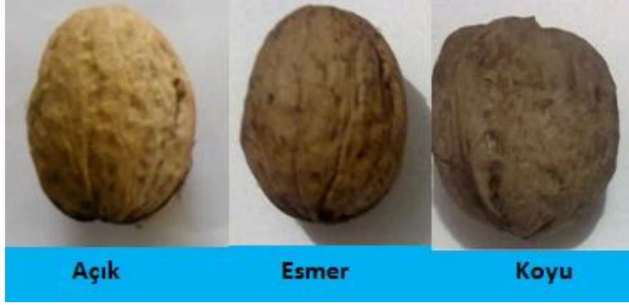
Şekil 3.2. Genotipler için kullanılan meyve kabuk renk skalası

3.2.1.7. İç Rengi: Meyveler iç rengine göre açık sarı, sarı, esmer ve koyu olarak değerlendirilmiştir (Yarılgaç, 1997).