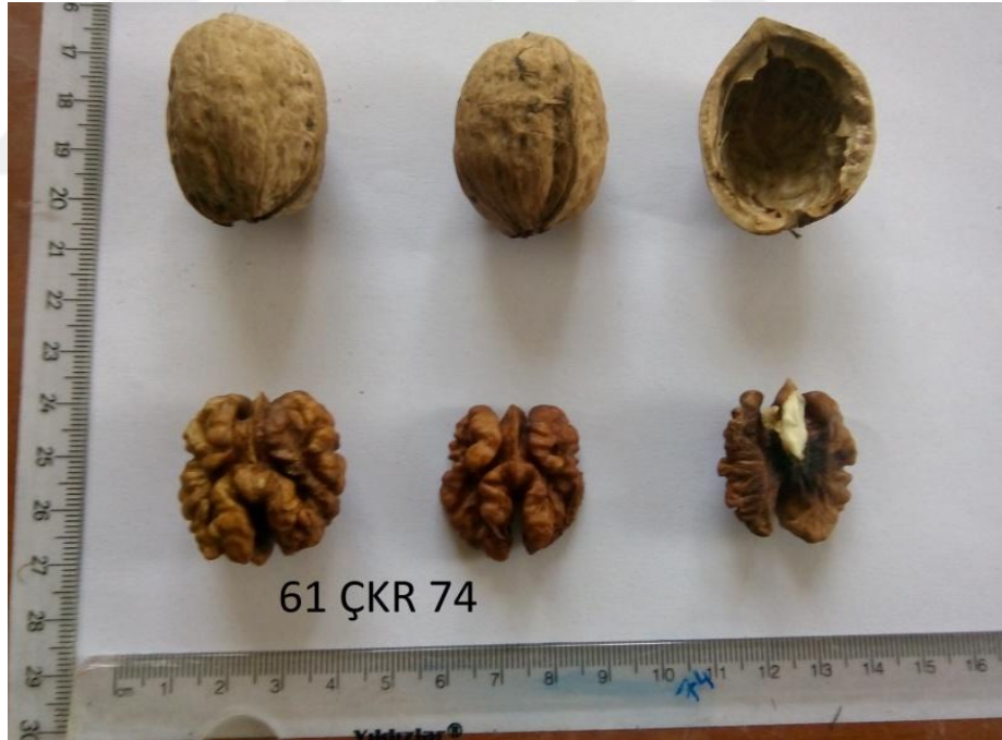
Şekil 4.8. Genotip 74'e ait resim