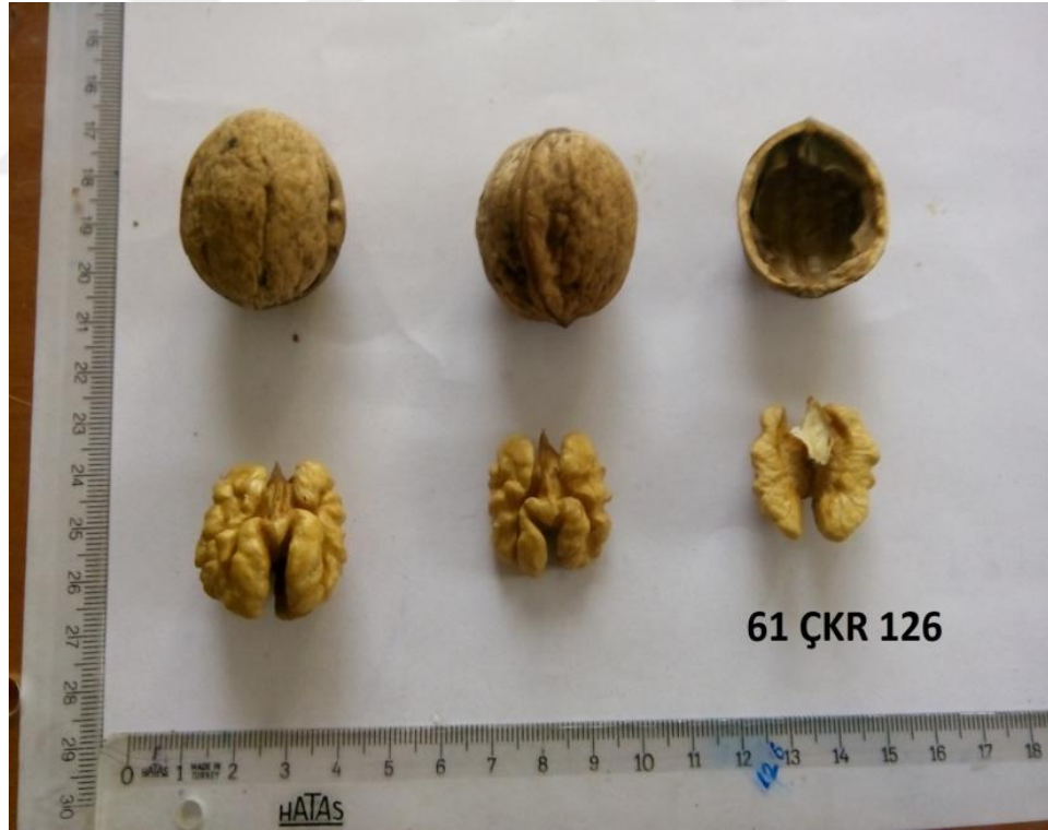
Şekil 4.5. Genotip 126'ya ait resim