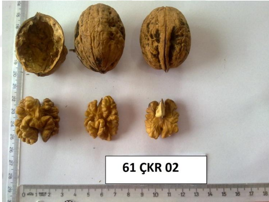
Şekil 4.7. Genotip 2'ye ait resim