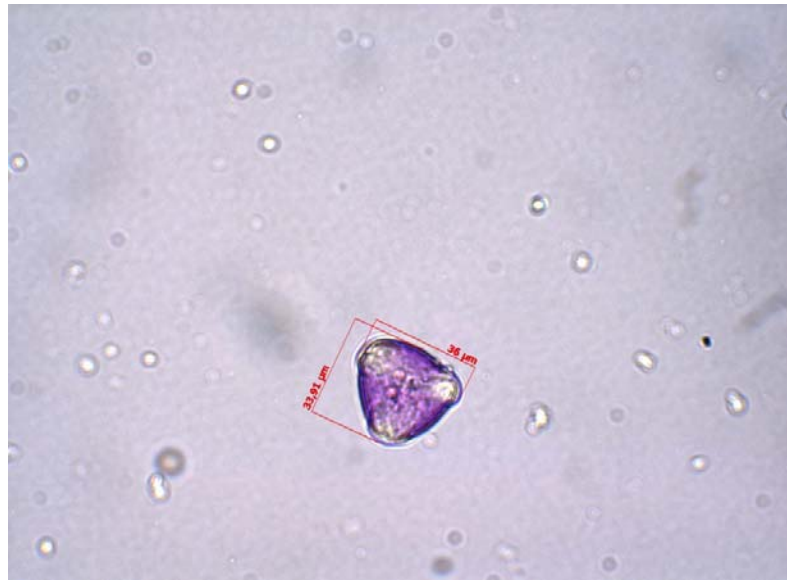
Şekil 3.8. Polenin Mikroskopta Görünümü

Polen şekilleri, kameralı ışık mikroskobunda 40x/0.65'lik objektifte AxioVision V 4.8 programı kullanılarak tespit edilmiş ve fotoğrafları çekilerek yatay-dikey olarak büyüklükleri ölçülmüştür. Polen pelet ağırlıkları, 0.1 mg hassaslıkta terazide tartılarak mg/pelet olarak hesaplanmıştır.