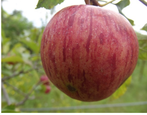
Şekil 3.5. Hasat (Jersey Mac)