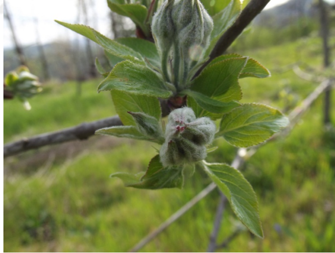
Şekil 3.2. Tomurcuk Patlaması

Tomurcukların kabarıp, tomurcuk örtülerinin açıldığı ve tomurcuk uçlarından yeşil yaprak uçlarının görüldüğü devre olarak esas alınmıştır.