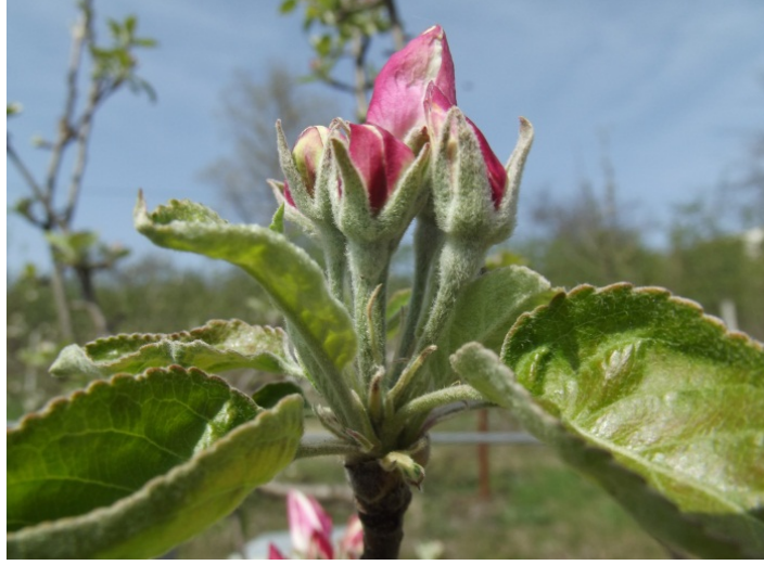
Şekil 3.3. Çiçeklenme Başlangıcı