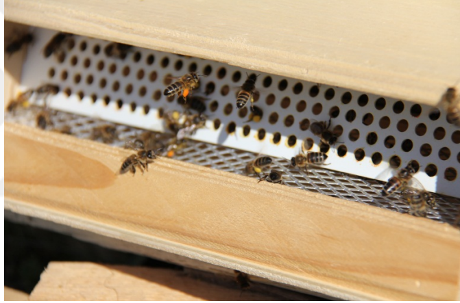
Şekil 3.7. Bal Arılarının Polen Toplaması

Polen şekilleri, kameralı ışık mikroskopunda 40x/0,65'lik objektifte AxioVision V 4.8 programı kullanılarak tespit edilmiş ve fotoğrafları çekilerek yatay-dikey olarak büyüklükleri ölçülmüştür. Polen pelet ağırlıkları, 0.1 mg hassaslıkta terazide tartılarak mg/pelet olarak hesaplanmıştır.