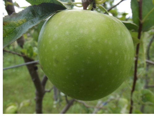
Şekil 3.6. Hasat (Granny Smith)