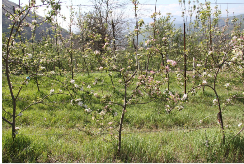
Şekil 3.4. Tam Çiçeklenme

Çiçek tomurcuklarının % 70-80 oranında çiçek açtığı dönem tam çiçeklenme dönemidir. Bu dönemin tam olarak tayini, gözlemcinin tecrübesine bağlıdır.