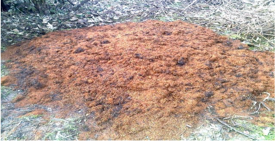
řekil 3.1. ay öpü yıęını

Sera kořulları altında yürütölen denemede, 0-20cm derinlikten alınan kumlu killitn tekstüre sahip toprak kullanılmıřtır. Organik materyal olarak, ay fabrikası iřleme atıęı olan ay öpünden elde edilen kompost,bitki materyali olarak Lumbard F1 sivri tatlı biber fidesi, tuz uygulamasında NaCl tuzu kullanılmıřtır.