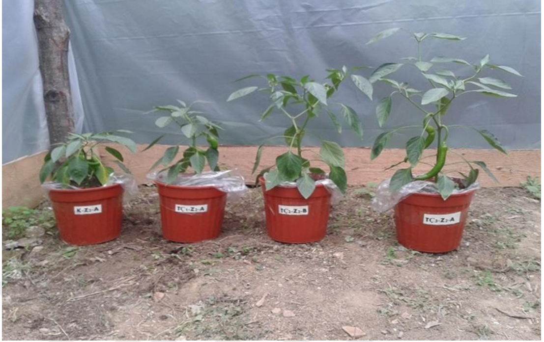
Şekil 4.3. Aynı miktarda tuz dozu ve artan düzeyde çay çöpü kompostu uygulamalarının biberin bitki boyu üzerine etkisi

Biber bitkisine uygulanan tuz uygulamalarının etkisi incelendiğinde, bitki boyunun kontrol dozunda 34.42 cm, 0.75 dSm -1 tuz uygulamasında 30.83 cm, 1.5dSm -1 tuz uygulamasında 28.33 cm, 2.5 dSm -1 tuz uygulamasında 28.08 cm, 3.5dSm -1 tuz uygulamasında 25.54 cm olarak bulunmuştur. Bitki boyu açısından kritik dozun,0.75 dSm -1 olduğu, artan düzeyde tuz uygulamasının boy uzamasını azalttığı, diğer incelenen özelliklerde olduğu gibibitki boyunu olumsuz etkileyerek azalmasına neden olmuştur. Tuz uygulamasındaki artışa bağlı olarak bitki boyunda meydana gelen düşüşü Şekil 4.4’ de görülmektedir. Yapılan birçok çalışmada da benzer bulgular ortaya konulmuştur.Topaloğlu, (2010), chili biberlerinde yüksek dozlarda tuza maruz kalan bitkilerdeki kök ve gövde uzunlukları ile yaş ve kuru ağırlıklarında ilerleyen günlerle birlikte oldukça azaldığını rapor etmiştir. Benzer şekilde, Sonar ve Lamuyo hibrit biber çeşitlerine farklı dozlarda (0, 10, 25, 50, 100 ve 150mM) NaCl uygulamalarından, 25 mM ve üstünde tuz uygulanan ortamlarda yetiştirilen bitkilerde bitki uzunluğu, kuru ağırlık ve yaprak alanlarında azalmalar meydana geldiğini bildirmişlerdir (Chartzoulakis ve Klapaki, 2000).