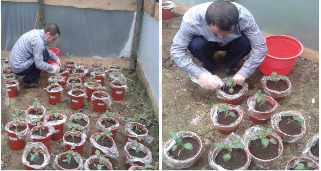
Şekil 3.5. Fide dikim aşaması

için tuza tolerans eşik düzeyi 1.5 \text{ dSm}^{-1} baz alınmıştır. 4 kg toprak alan saksıların içine polietilen torbalar yerleştirildikten sonra belirlenen oranlarda karışımlar ayrı ayrı hazırlanıp doldurulmuştur. Bu şekilde drenaj önlenmiştir. Uygulanacak tuz miktarları NaCl tuzundan hesaplanarak, hazırlanan tuz çözeltileri saksılara ayrı ayrı ilave edilerek karıştırılmıştır. Tuz çözeltisi ilave edilen her saksıya 1 adet biber fidesi dikilmiş ve saksılara tarla kapasitesinin %75'i düzeyinde su verilmiştir. Temel gübreleme amacıyla \text{KH}_2\text{PO}_4 gübresinden 100ppm K/saksı, 125ppm P/saksı, azot için 100 ppm/saksı CAN gübrelemesi uygulanmıştır. Deneme süresi boyunca, başka gübreleme yapılmamıştır. Denemenin dikim ile ilgili bütün işlemleri bir günde tamamlanmıştır.