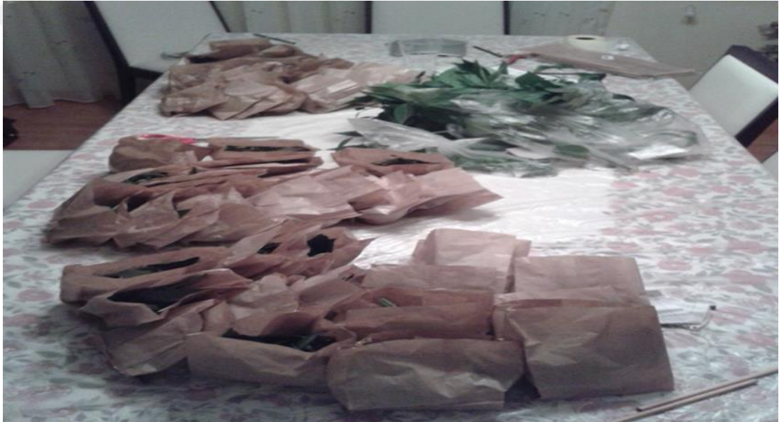
Şekil 4.2. Yaş yaprakların etüve konulmak üzere hazırlanması

Aşık ve Kütük, (2012), çim bitkisine uygulanan çay atık kompostu ile kuru ot veriminde önemli düzeyde artış meydana geldiğini ifade etmiştir. Keskin, (2015) tarafından, organik materyal uygulamalarında, yeşil aksam uzunluğu, aks uzunluğu, verim, kuru madde miktarı, kök uzunluğu, bitki yaprak sayısı ile birlikte bitkilerin K ve Na içeriklerine etkilerinin kontrol parsellerine göre önemli düzeyde etkili olduğu, Şenlikoğlu, (2015), ıspanak bitkisinin yaş ve kuru ağırlıkları üzerine gübre uygulaması ve organik materyal uygulamaları ve bunların farklı dozlarının istatistiksel olarak % 1 düzeyinde önemli olduğunu bildirmiştir. Orman toprağı, kum ve ahır gübresi kullanılarak hazırlanan farklı yetiştirme ortamların, gövde ve kök yaş ve kuru ağırlıkları gibi morfolojik özellikleri etkilediği bildirilmiştir (Akın, 2009).