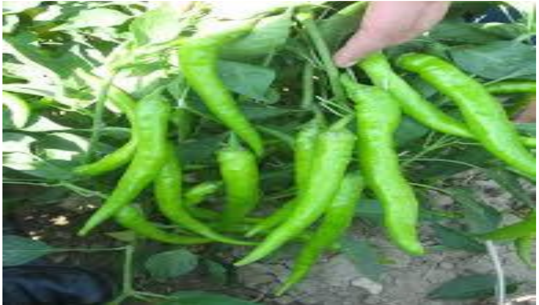
řekil 3.2. Lumbard F1 sivri tatlı biber