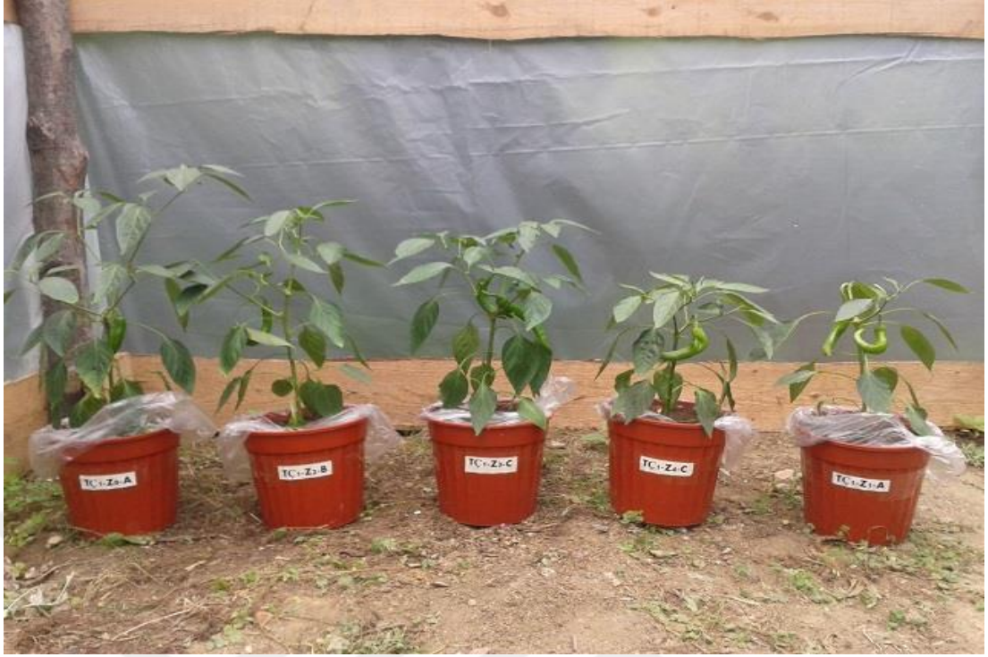
Şekil 4.4. Aynı miktarda çay çöpü kompostu ve artan düzeyde tuz dozu uygulamalarının biberin bitki boyu üzerine etkisi

Tuz stresine bağlı olarak fotosentez azalır, hormonal dengede yıkım meydana gelir, nitrat alımının düşmesiyle protein sentezinde azalma meydana gelerek bitki boyu kısalmaktadır (Robinson ve ark., 1983). Tuzluluğun artmasıyla domatesin gövde ağırlığı, bitki boyu, yaprak sayısı ve kök uzunluğunun önemli düzeyde azaldığı ifade edilmiştir (Mohammed ve ark., 1998). Biber bitkisine uygulanan sulama suyunda tuzluluğunun artışı ile bitki boyu, bitki verimi, bitki çapında ve bitki dal sayısında belirgin bir şekilde azalma olduğu bildirilmektedir (Tezcan, 2009). Patlıcan ( solanum melongena ) bitkisine özellikle yetiştirme mevsimi başlarında uygulanan tuzlu suyun, bitki su tüketimini, bitki boyunu ve bitki ağırlığını önemli ölçüde azalttığı saptanmıştır (Öztürk, 2002).