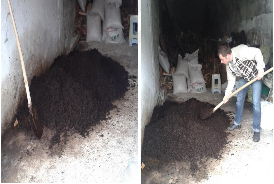
Şekil 3.3. Kompost haline getirilmiş çay çöpüyığınları

Denemeye başlamadan önce, çay fabrikalarından temin edilen çay çöpleri kompost haline getirilmiştir. Denemede gereken kompost miktarı dikkate alınarak toplanan çay çöpleri, üzeri kapalı olan açık bir alanda yığın oluşturularak kompostlanma işlemine tabi tutulmuştur. Çay çöpleri (yaklaşık 10cm kalınlığında) serildikten sonra üzerine toprak serilerek (yaklaşık 1cm kalında), kireç ve azotlu gübre serpilmiş, materyal bitene kadar bu işleme devam edilmiştir. Her kattan sonra sıkıştırma ve nemlendirme işlemi yapıldıktan sonra yığının üzeri naylon örtü ile örtülmüştür. Kompost oluşum süresince yığının nem, sıcaklık kontrolü yapılarak, karıştırma ve sıkıştırma işlemi yapılmıştır. Doğal koşullar altında yaklaşık 4 ay sonunda materyalin kompostlaşması sağlanmıştır.