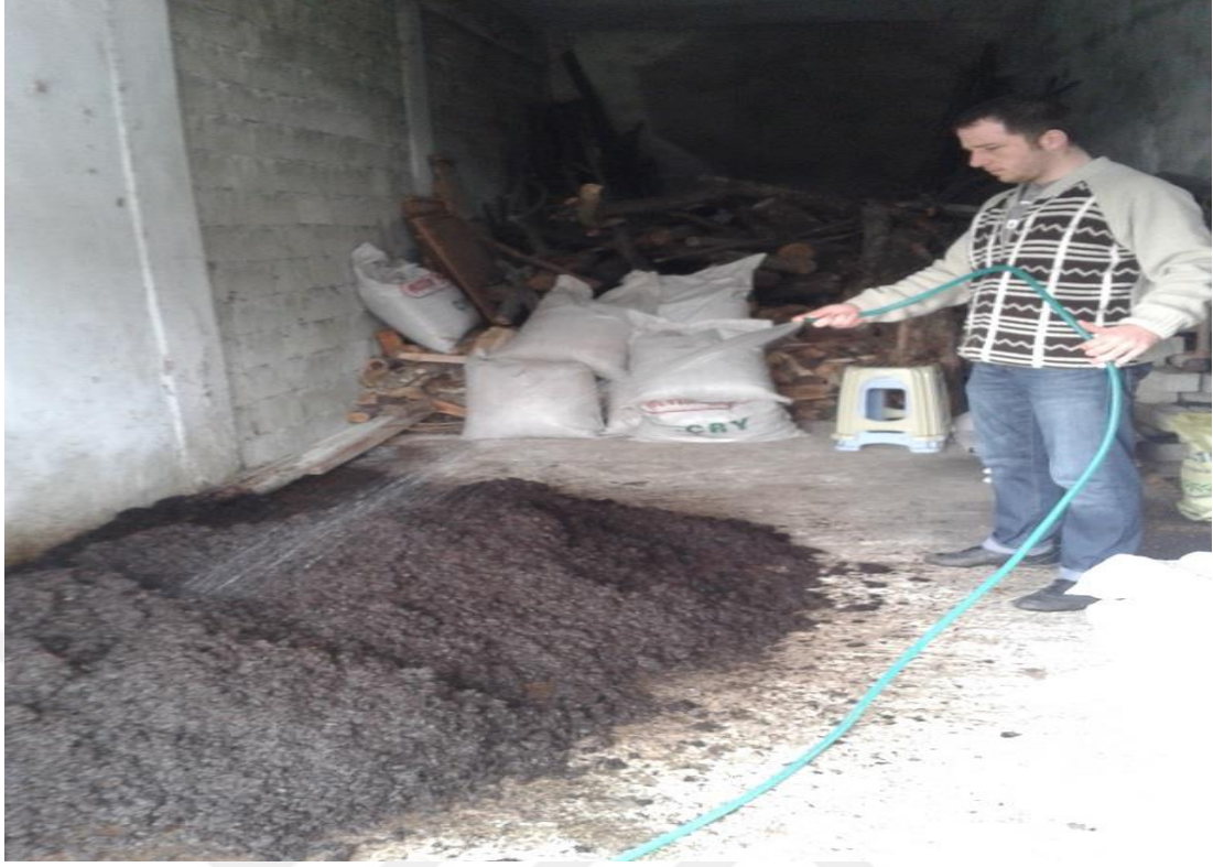
Şekil 3.4. Kompost yığınının sulanması

Deneme için kullanılacak olan çay çöpü kompostu ve toprak, alındıktan sonra kurutulup 6.35mm'lik elekten elenmiştir. Denemenin amacına uygun bir şekilde; toprak örnekleriyle çay çöpü kompostu hacimsel olarak değişik oranlarda karıştırılarak çeşitli ortamlar hazırlanmıştır. Karışım oranları 1 dekar toprağa karıştırılan materyal miktarları dikkate alınarak belirlenmiştir. Hazırlanan karışımlar şöyledir: