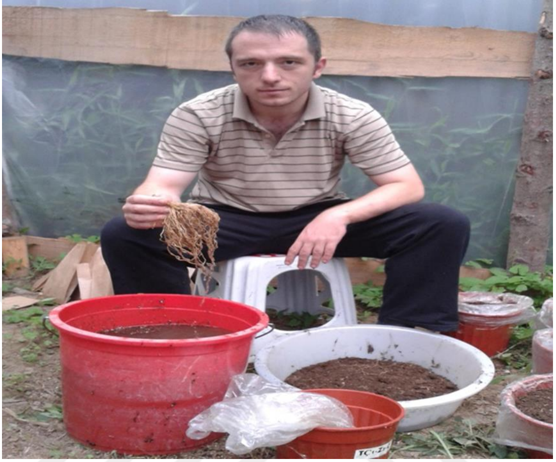
Şekil 4.1. Biber bitkisi kök kısmının topraktan sökülerek yıkanması

Biber bitkisine yapılan tuz uygulamalarının etkisi incelendiğinde, ortalama bitki kök yaş ve kuru ağırlıkları; kontrol bitkilerinde sırasıyla 4.35 g ve 2.20 g, 0.75 dSm -1 tuz uygulamasında 3.51 g ve 1.74 g, 1.5dSm -1 tuz uygulamasında 2.83 g ve 1.33 g, 2.5 dSm -1 tuz uygulamasında 2.65 g ve 1.23 g, 3.5dSm -1 tuz uygulamasında 2.32 g ve 0.97 g olarak bulunmuştur. Uygulanan tuz dozu arttıkça bitki kök yaş ve kuru ağırlıklarında azalma meydana gelmiştir ki bu da beklenen bir sonuçtur. Tuzluluk, bitkilerin su alımını, ozmotik potansiyel, iyon eşitliği ve besin alımındaki dengeyi bozması nedeniyle çimlenme, büyüme, fizyoloji ve verimini olumsuz etkilemektedir (Niu ve ark., 1995). Toprağa tuz uygulaması yapılması ile bitkiler tuz stresinden olumsuz etkilenmiş, 1000 ppm NaCl uygulamasının (1.5 dSm -1 ) olduğu 2. dozun kritik nokta olduğu görülmüştür. Biber hasat sezonu süresince birçok biyotik ve abiyotik koşullara (özellikle tuzluluk) maruz kalmaktadır. Biber tuz toleransına hassas bir bitki olduğu için tuzluluk onun gelişimini olumsuz etkilemektedir (IbnMaaouia-Houimli ve ark., 2011). Geçer, (2003), artan dozlarda uygulanan tuz