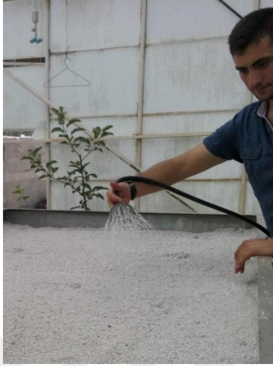
Şekil 3.1. Köklendirme ortamının hazırlanması