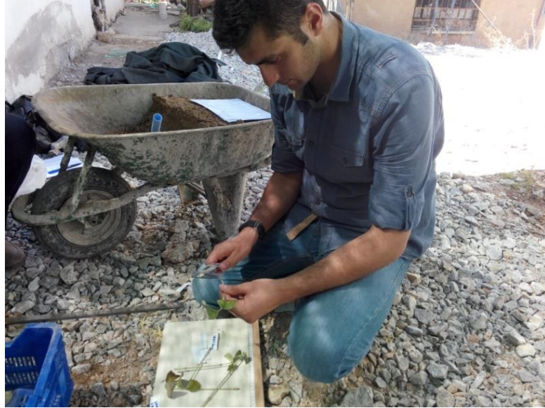
Şekil 3.6. Sökülen çeliklerde ölçümlerin yapılması

Köklendirme ortamına dikimi yapılan çeliklerde 5 hafta sonra (haziran ayında alınan yeşil çelikler 20 Temmuz'da, temmuz ayında alınan yarı odun çelikleri 18 Ağustos) söküm işlemi gerçekleştirilmiştir. Sökülen çeliklerde köklenme oranı, kallüslenme oranı, en uzun kök, en kısa kök, kök dallanması, yaşayan çelik oranı ve köklenme kalitesi özellikleri incelenmiştir.