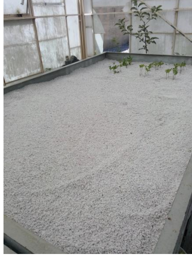
Şekil 3.2. Köklendirme ortamı