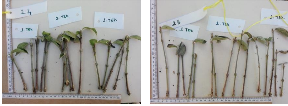
Şekil 4.5. 24 ve 25 genotipine ait köklenmiş çeliklerin görünümü