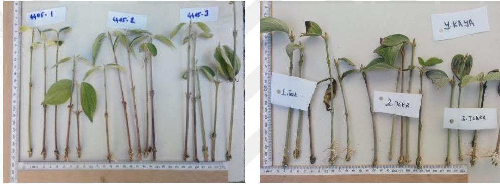
Şekil 4.6. 44-05 genotipine ve Erolbey-77 çeşidine ait köklenmiş çeliklerin görünüm

Aynı sütünde aynı harf ile gösterilen ortalamalar arasındaki farklılık istatistiksel olarak önemsizdir ( p < 0.05 )