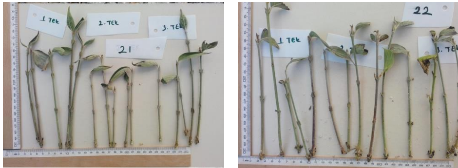
Şekil 4.4. 21 ve 22 genotipine ait köklenmiş çeliklerin görünümü

Aynı sütünde aynı harf ile gösterilen ortalamalar arasındaki farklılık istatistiksel olarak önemsizdir ( p<0.05 )