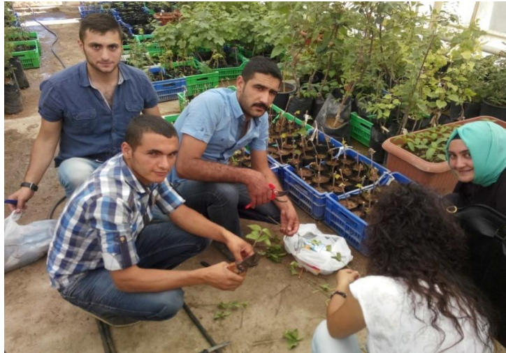
Şekil 3.4. IBA uygulaması ve çeliklerin hazırlanması

15 Haziran tarihinde alınmış olan yeşil çeliklere kontrol ve 3500 ppm IBA, 15 Temmuz tarihinde alınmış olan çeliklere ise kontrol ve 4000 ppm IBA uygulaması yapılmıştır. Çeliklere IBA, 5 sn süre ile batırma şeklinde uygulanmıştır. IBA uygulanan çelikler, köklendirme ortamına aktarılmadan önce alkolün uçması için gölge bir ortamda bekletilmiştir. Çelikler Tesadüf Parselleri Deneme Desenine göre 4 tekerrürlü ve her tekerrürde 5 çelik olacak şekilde dikilmiştir. Dikim çelikler sıra arası ve sıra üzeri 10 cm x 10 cm ve çeliklerin 2/3'ü köklenme ortamında kalacak şekilde yapılmıştır. Çelikler olası bir fungal hastalığa karşı, CAPTAN 50 WP (CAPTAN'H) ile haftada bir ilaçlanmıştır.