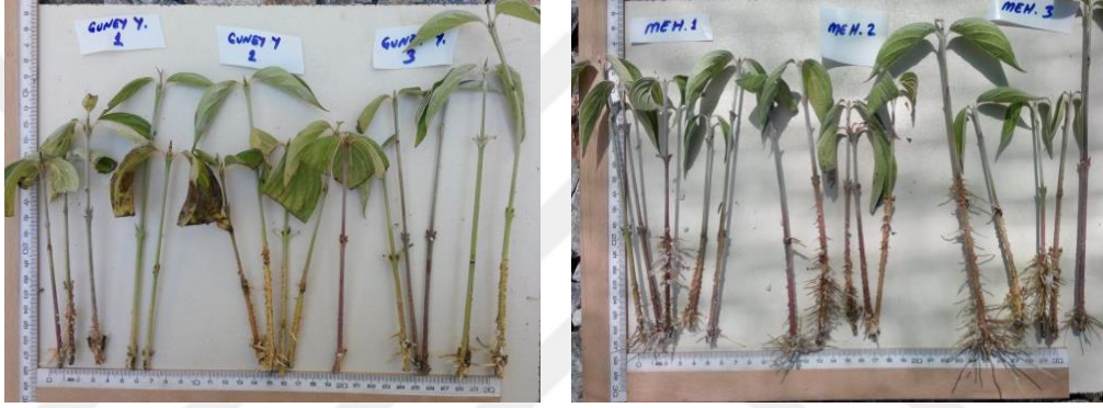
Şekil 4.2. Güney Yuvarlak ve Mehmet genotipine ait köklenmiş çeliklerin görünümü

Aynı sütünde aynı harf ile gösterilen ortalamalar arasındaki farklılık istatistiksel olarak önemsizdir ( p < 0.05 )