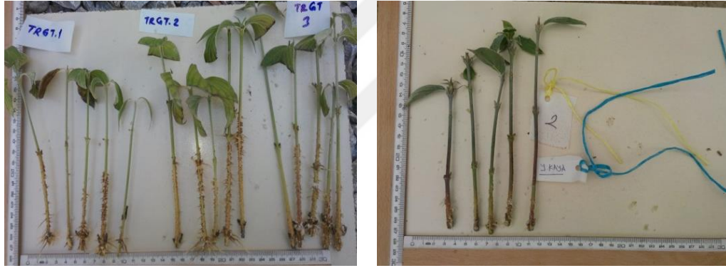
Şekil 4.3. Turgut genotipi ve Yalçinkaya-77 çeşidine ait köklenmiş çeliklerin görünümü

Aynı sütünde aynı harf ile gösterilen ortalamalar arasındaki farklılık istatistiksel olarak önemsizdir ( p<0.05 )