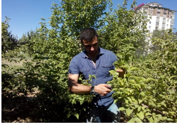
Şekil 3.3. Çeliklerin alınması

15 Haziran tarihinde alınmış olan yeşil çeliklere kontrol ve 3500 ppm IBA, 15 Temmuz tarihinde alınmış olan çeliklere ise kontrol ve 4000 ppm IBA uygulaması yapılmıştır. Çeliklere IBA, 5 sn süre ile batırma şeklinde uygulanmıştır. IBA uygulanan çelikler, köklendirme ortamına aktarılmadan önce alkolün uçması için gölge bir ortamda bekletilmiştir. Çelikler Tesadüf Parselleri Deneme Desenine göre 4 tekerrürlü ve her tekerrürde 5 çelik olacak şekilde dikilmiştir. Dikim çelikler sıra arası ve sıra üzeri 10 cm x 10 cm ve çeliklerin 2/3'ü köklenme ortamında kalacak şekilde yapılmıştır. Çelikler olası bir fungal hastalığa karşı, CAPTAN 50 WP (CAPTAN'H) ile haftada bir ilaçlanmıştır.