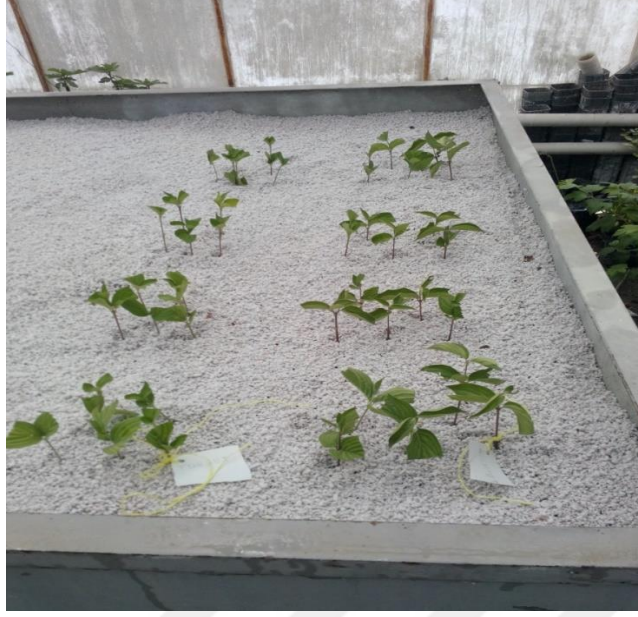
Şekil 3.5. Çeliklerin köklendirme ortamına dikilmesi

Köklendirme ortamına dikimi yapılan çeliklerde 5 hafta sonra (haziran ayında alınan yeşil çelikler 20 Temmuz'da, temmuz ayında alınan yarı odun çelikleri 18 Ağustos) söküm işlemi gerçekleştirilmiştir. Sökülen çeliklerde köklenme oranı, kallüslenme oranı, en uzun kök, en kısa kök, kök dallanması, yaşayan çelik oranı ve köklenme kalitesi özellikleri incelenmiştir.