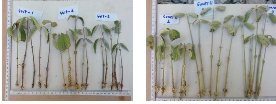
Şekil 4.1. 44-18 ve Güneyuzun, genotiplerinin köklenmiş çeliklerine ait görünüm