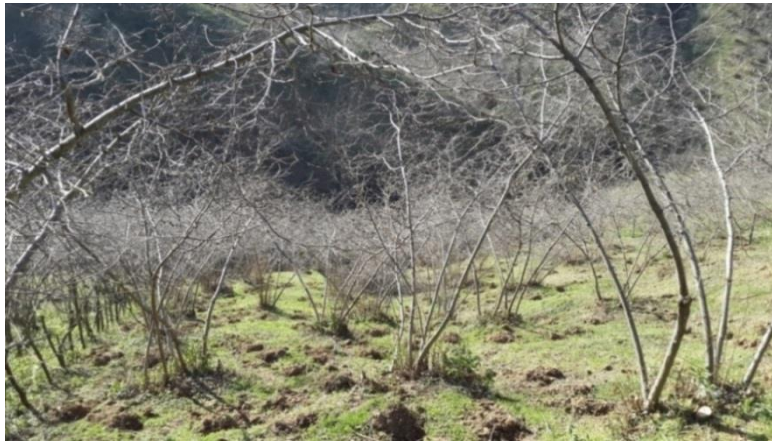
Şekil 3.2. Araştırma alanının genel görünümü