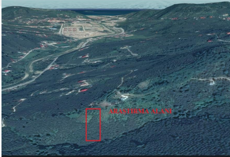
Şekil 3.1. Araştırma alanının konumu

Bu çalışma, 2015-2016 yıllarında Giresun iline bağlı Barça köyünde Ali TONKAZ adlı kişiye ait fındık bahçesinde yetiştirilen Tombul fındık çeşidi ile yürütülmüştür. Araştırma alanının konumu 40.87222338441944^{\circ} , enlemi 40.872222900390625^{\circ} ve boylamı 38.44194412231445^{\circ} olarak belirlenmiştir. Bahçenin rakımı 110 metredir. Bahçenin tesis yaşı bahçe sahibinin beyanı ile 100 yıl olarak belirlenmiştir. Bahçenin eğimi yaklaşık olarak %60 ve ocaklar arasındaki mesafe ortalama 4 metredir. Ocaklardaki dal sayısı 5 adet olacak şekilde fazla dallar kesilmiştir. Araştırma alanının konumu ve genel görünümü Şekil 3.1 ve Şekil 3.2’de gösterilmiştir.