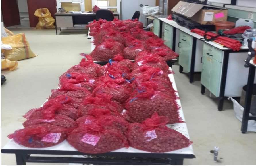
Şekil 3.7. Laboratuvar koşullarında fındığın depolanması