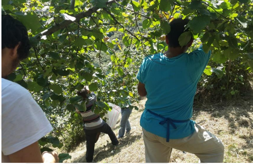
Şekil 3.5. Hasadın el ile daldan yapılması

önceki yıldan biraz daha erken olarak 8 Ağustos 2016 tarihinde yapılmıştır. Toplanan fındıklar gerekli ölçümler yapıldıktan sonra ertesi gün patoz makinesi ile zuruflarından ayrılmıştır. 5 gün süre ile güneşte kurutulan fındıklar naylon filelere konularak laboratuvara alınmıştır (Şekil 3.7).