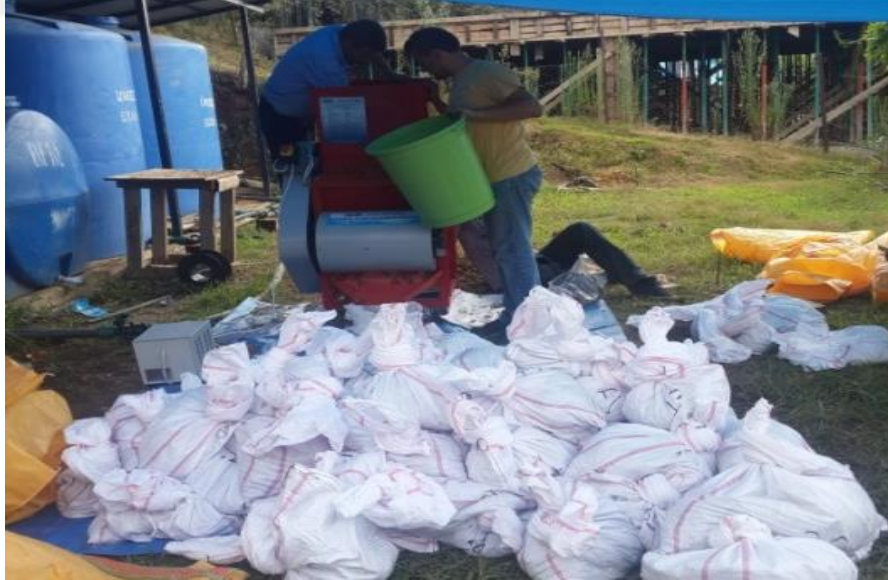
Şekil 3.6. Patozda çotanaktan danelerin ayırma işlemi