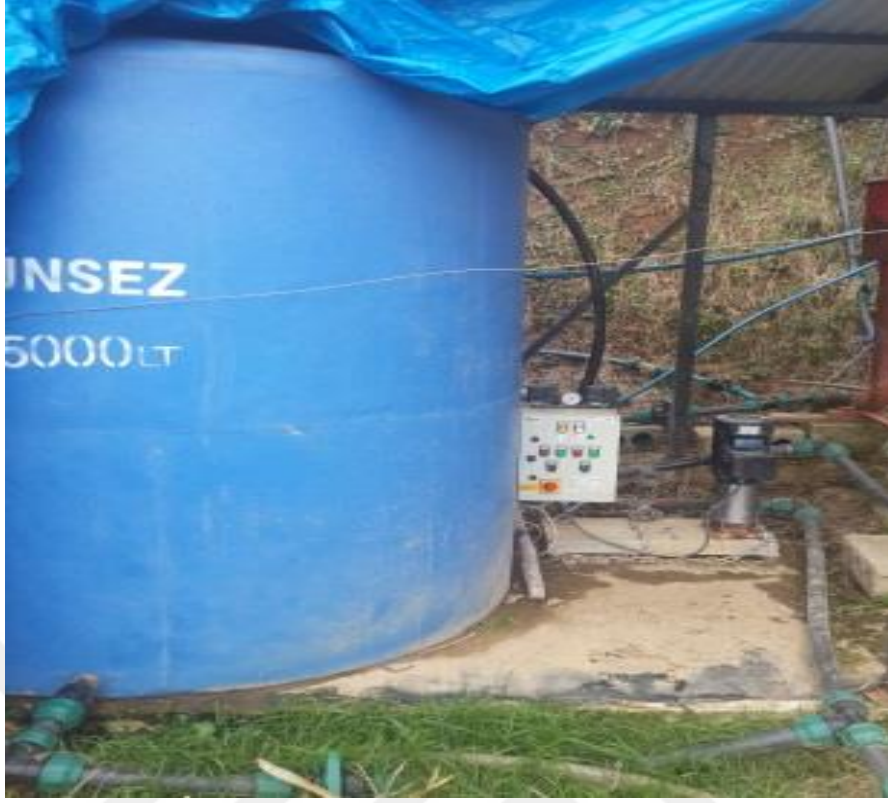
Şekil 3.4. Polietilen tank ve dikey pompa sistemi

Çalışmamızda fındık bitkisi gelişme dönemlerine göre aşağıdaki şekilde 3 farklı döneme ayrılmıştır (Bostan, 1998).