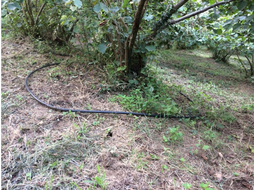
Şekil 3.3. Ocağın etrafına uygulanan halka şeklindeki boru sistemi

Bahçede yabancı ot temizliği yapıldıktan sonra damla sulama sisteminin uygulaması yapılmıştır. Pompaj tesisinden yaklaşık 300 m uzaktaki deneme alanına 50 mm çapındaki boru ile ulaştırılan su, deneme desenine göre arazi içerisinde dağıtım yapılmıştır. Bu amaçla arazinin uzun eksenini boyunca sağ ve sol yanında 32 mm'lik borular döşenmiştir. 32 mm'lik borulardan 20 mm'lik damla sulama borusu ile alınan su, ocağın etrafından halka şeklinde uygulanarak boru sabitleme aparatlarıyla sabit hale getirilmiştir (Şekil.3.3). Sulama suyu kaynağı olarak yakınlarda var olan mini bir akarsudan yararlanılmıştır. Kapalı boru sisteminde sulama suyu polietilen tanklarda depolanmış, depolanan su dikey pompa ile araziye pompalanmıştır (Şekil 3.4). Sulama konularının başlangıcına yerleştirilen manometre ile basınç 1.5-2 atm olacak şekilde vana ile ayarlanmıştır. Verilen sulama suyu miktarı ise bir sayaç vasıtasıyla ölçülmüştür. Toprak nem içeriği gravimetrik yöntemle takip edilmiştir.