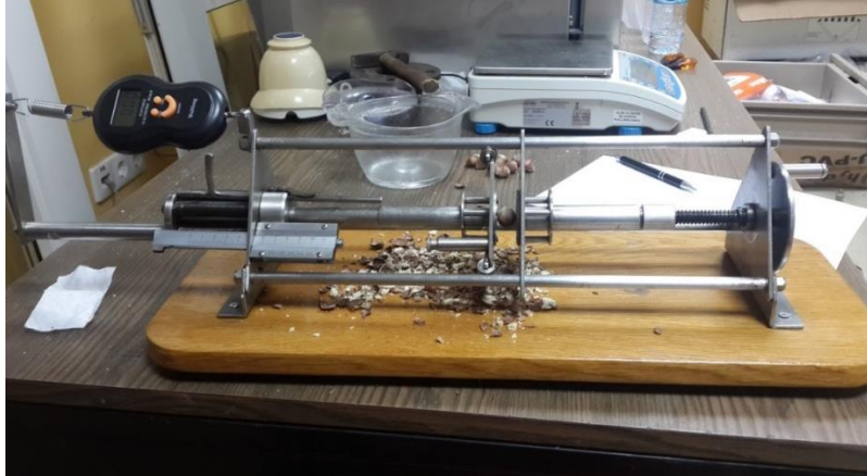
Şekil 3.8. Kabuk kırılma direnç ölçer

Portatif bir cihazla kabuk kırılma direnci ölçümü yapılmıştır. Cihaz hareketli iki silindirden oluşmaktadır. İki silindir arasına konulan kabuklu fındık, mekanik olarak sıkıştırılmış ve kabuğun kırıldığı anda kabuğun kırılma kuvveti dijital bir kuvvet ölçer ekranına kilogram olarak yansıtılmıştır. Yansıyan değerler Newton (N) birimine dönüştürülmüştür (Şekil 3.8).