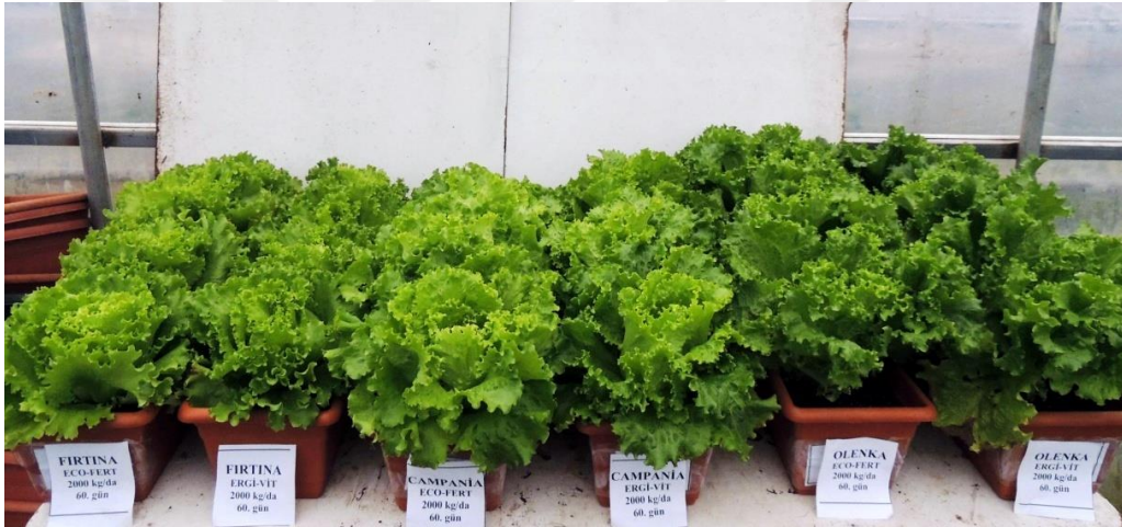
EK 17: 2000 kg/da gübre uygulaması bitkilerinin 60. gündeki görünümü