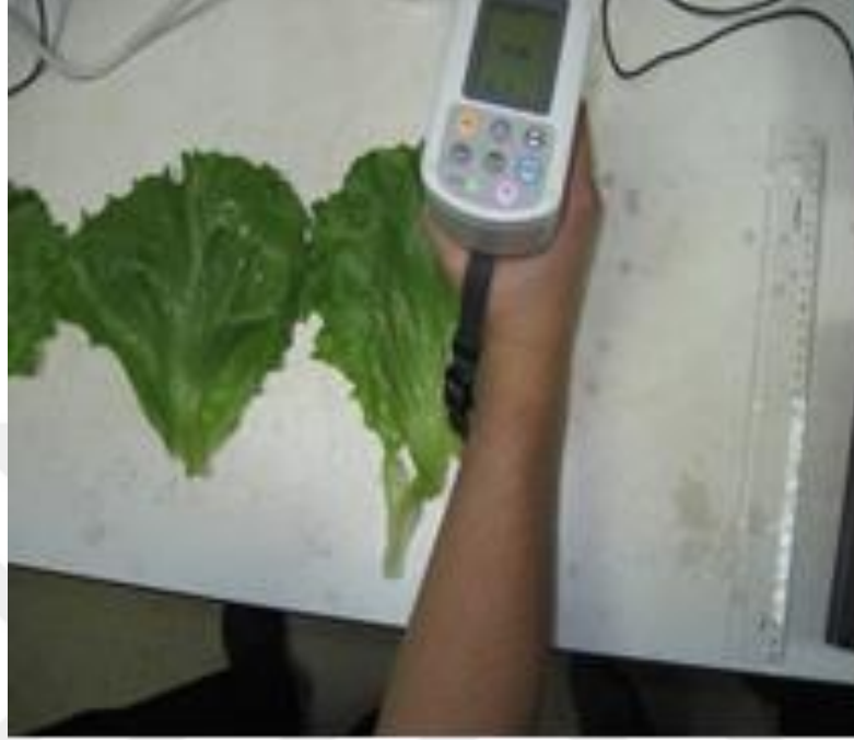
Şekil 3.5 Bitkilerde yaprak renginin ölçlmesi

kroma deęeri ise, rengin canlılıęını (parlaklıęını) ifade etmektedir. Kroma renginde 0 deęeri gri-akromatik rengi belirtir ve deęer bydke rengin canlılıęı artmaktadır (McGuire, 1992).