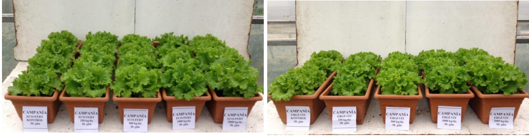
EK 1: Campania marul çeşidinde 30. günde gübre dozlarının etkileri