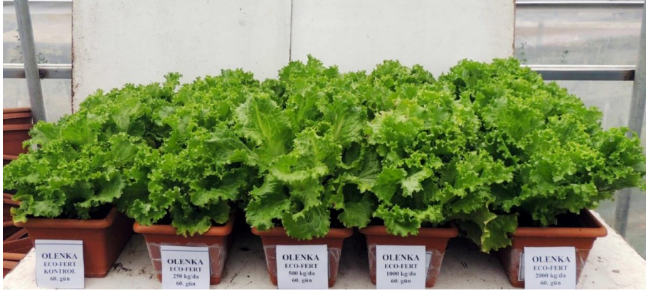
EK 11: Olenka marul çeşidinde 60. günde Ekofert gübre etkileri