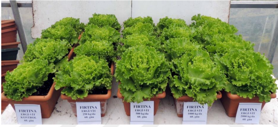
EK 9: Firtına marul çeşidinde 60. günde Ergivit gübre etkileri