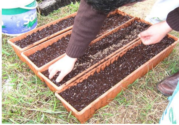
Şekil 3.1 a) Yetiştirme ortamının hazırlanması

Çalışma 2013-2014 sonbahar üretim sezonunda Ordu Üniversitesi Ziraat Fakültesi ısıtmasız araştırma serası ve labatuvarlarında yürütülmüştür. Fideler 75*16*14 cm ebatına sahip plastik saksılara dikilmiştir. Saksılar 3:1 oranında hazırlanmış torf-perlit karışımı ile doldurulduktan sonra ortama iki farklı gübrenin çeşitli doz uygulamaları yapılmıştır (Şekil 3.1). Dozlar 0, 250, 500, 1000 ve 2000 kg/da hesabıyla ortama ilave edilmiştir. Fideler 10.10.2013 tarihinde hazırlanan ortamlara dikilmiştir. (Şekil 3.2) Çalışma 4 tekerrürlü olarak tesadüf deneme desenine göre kurulmuştur. Dikimden hasada kadarki olan süre zarfı içerisinde tüm bakımlar eksiksiz olarak yerine getirilmiştir. Hasat ise 20.12.2013 tarihinde gerçekleşmiştir (Şekil 3.3). Hasat kök ile gövde arasından tutularak bıçak yardımı ile yapılmıştır.