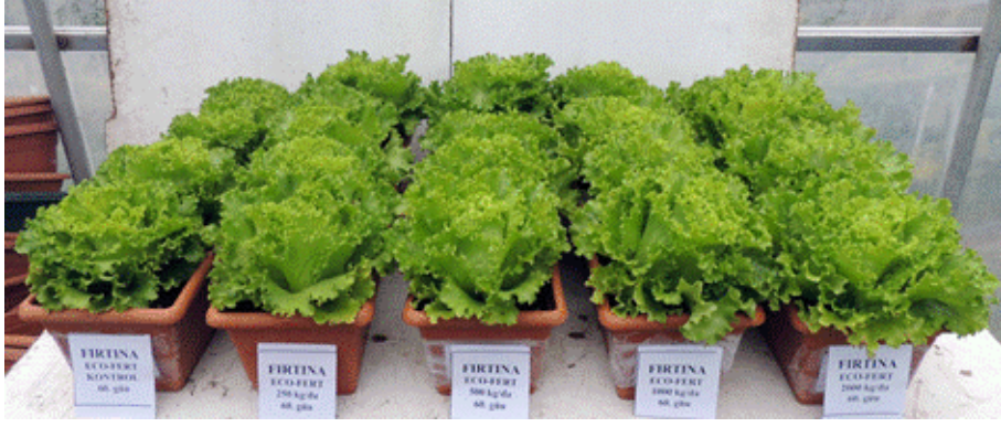
EK 8: Firtına marul çeşidinde 60. günde Ekofert gübre etkileri