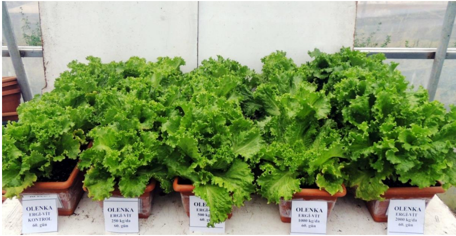
EK 12: Olenka marul çeşidinde 60. günde Ergovit gübre etkileri