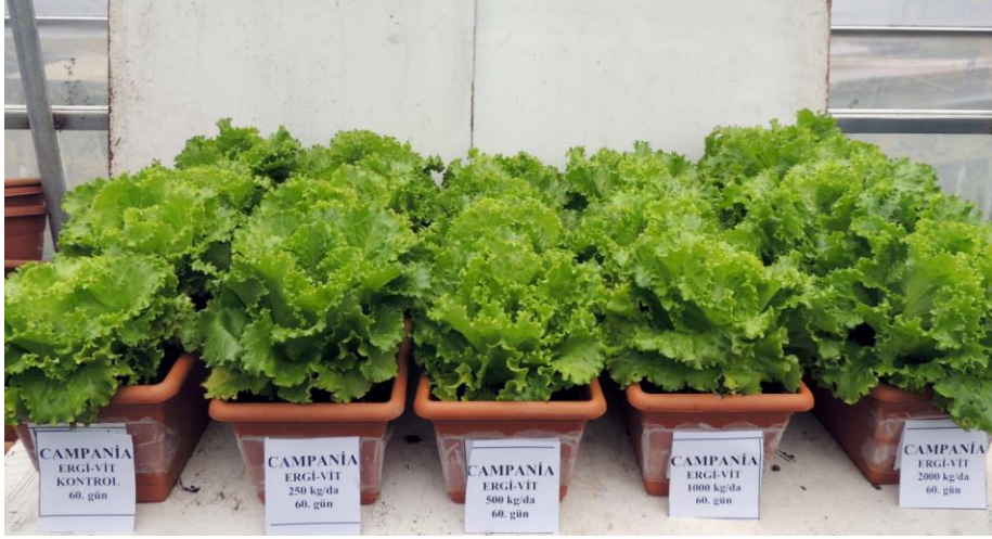
EK 6: Campania marul çeşidinde 60. günde Ergivit gübre etkileri