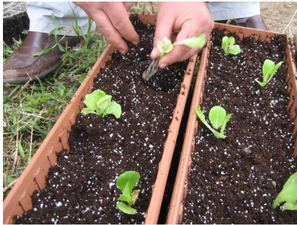
Şekil 3.2 Marul fidelerinin yetiştirme ortamına dikimi