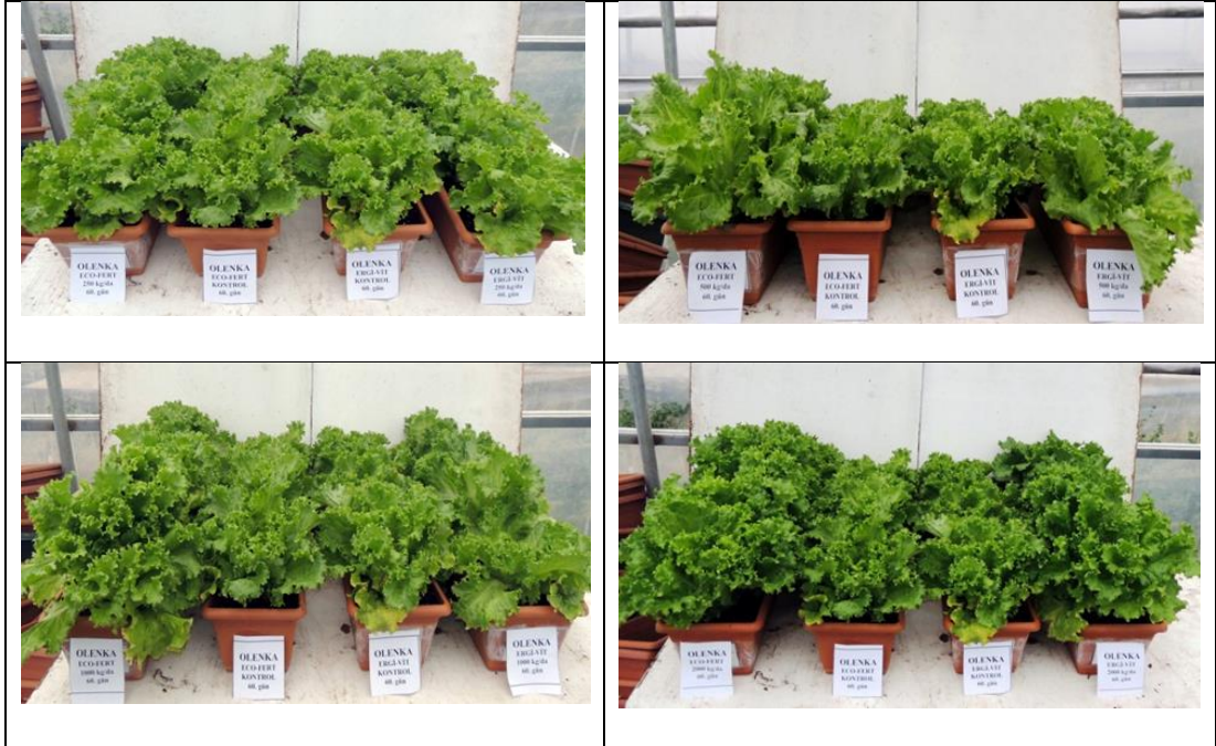
EK 10: Olenka marul çeşidinde 60. günde gübre dozlarının etkileri