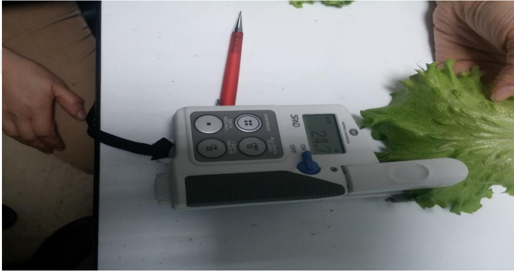
Şekil 3.4 Marul bitkilerinde SPAD ölçümü

Her saksıda bulunan 4 adet bitkinin tesadüfi olarak 3 yaprağında Minolta SPAD-502 Klorofilmetre (Konica Minolta Japan Leaf Chlorophyll Meter SPAD 502) ile toplam 10 adet ölçüm yapılarak yaprakların SPAD değerleri belirlenmiştir. Klorofilmetrenin üretici firma verilerine göre SPAD değer skalasında 1= klorotik veya sarı renk, 50 = koyu yeşil renk olarak ifade edilmiştir (Şekil 3.4).