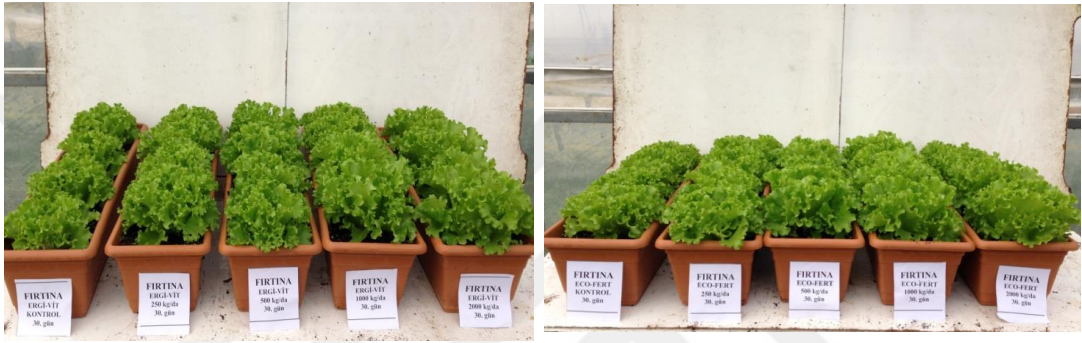
EK 2: Firtına marul çeşidinde 30. günde gübre dozlarının etkileri