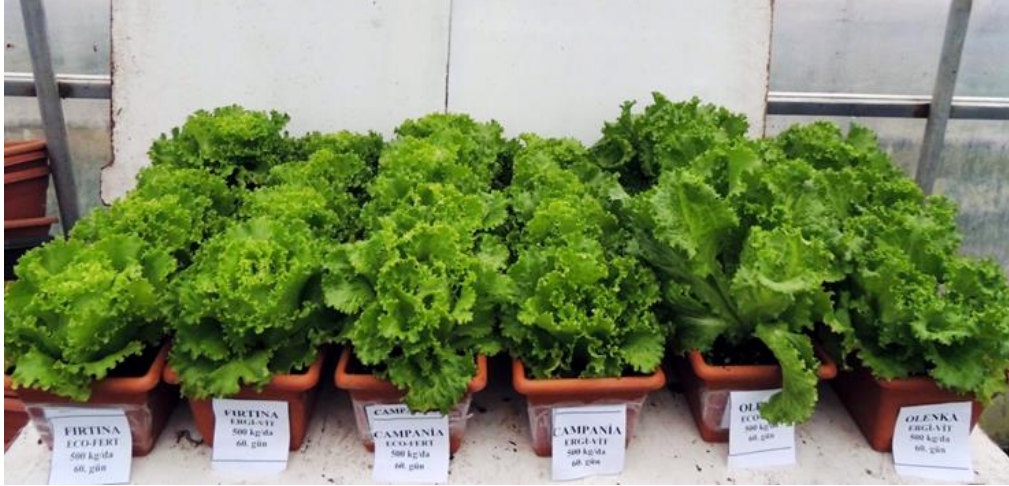
EK 15: 500 kg/da gübre uygulaması bitkilerinin 60. gündeki görünümü