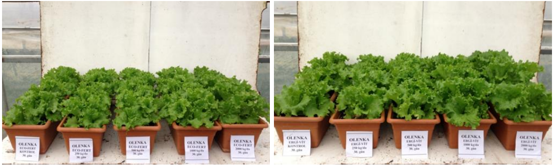
EK 3: Olenka marul çeşidinde 30. günde gübre dozlarının etkileri