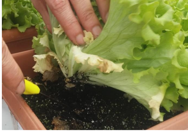
Şekil 3.3 Marul bitkilerinin hasadı