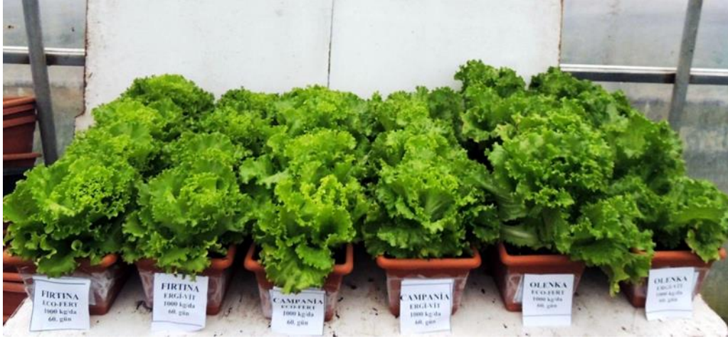
EK 16: 1000 kg/da gübre uygulaması bitkilerinin 60. gündeki görünümü