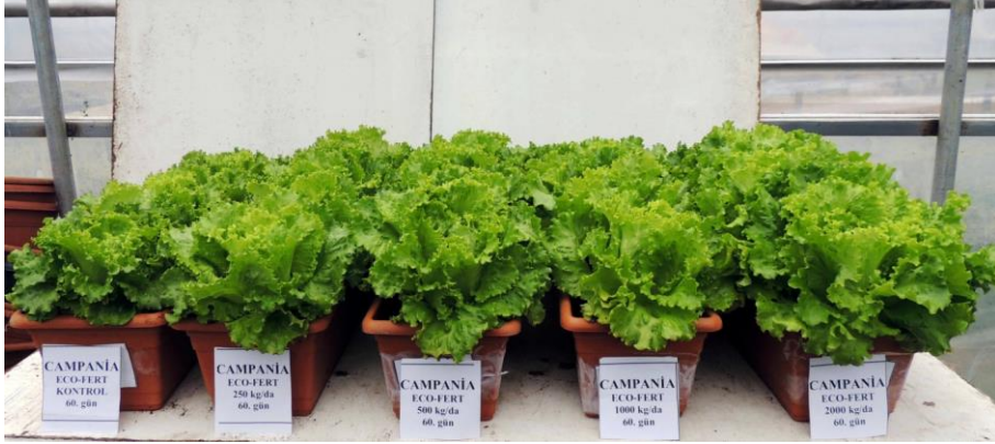
EK 5: Campania marul çeşidinde 60. günde Ekofert gübre etkileri