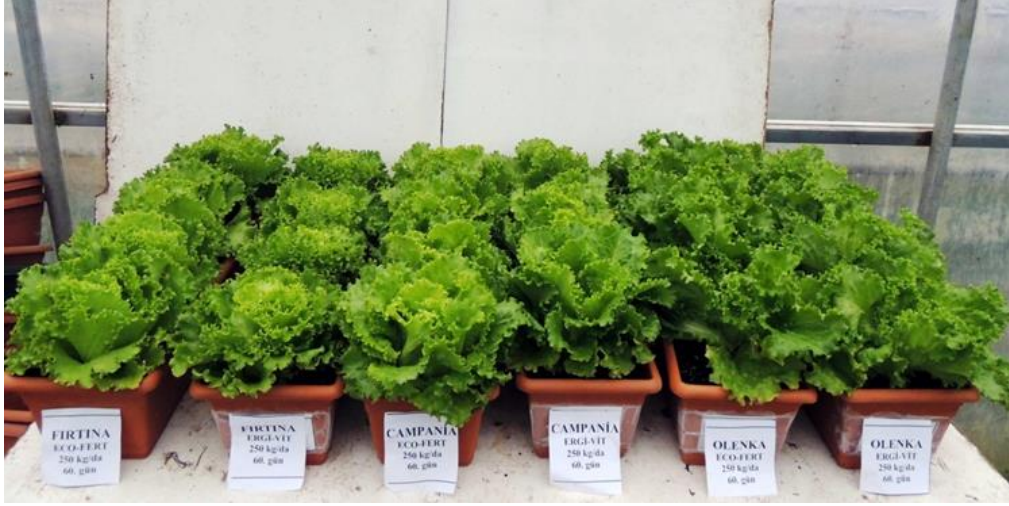
EK 14: 250 kg/da gübre uygulaması bitkilerinin 60. gündeki görünümü