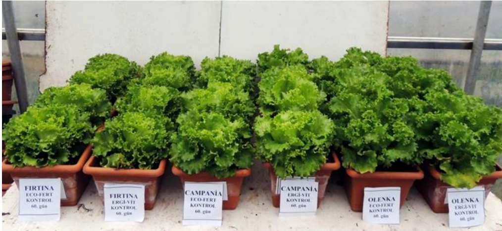
EK 13: Kontrol uygulaması bitkilerinin 60. gündeki görünümü