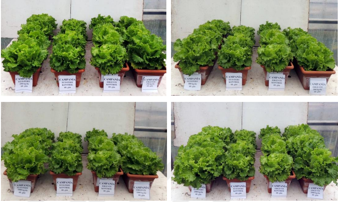
EK 4: Campania marul çeşidinde 60. günde gübre dozlarının etkileri