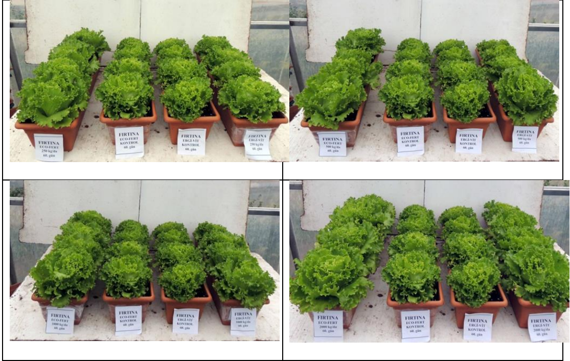
EK 7: Firtına marul çeşidinde 60. günde gübre dozlarının etkileri