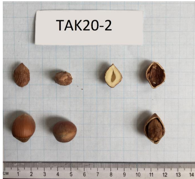
Şekil 3.8 TAK20-2 klonuna ait meyve resmi