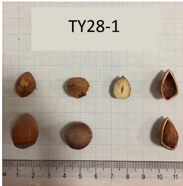
Şekil 3.7 TY28-1 klonuna ait meyve resmi