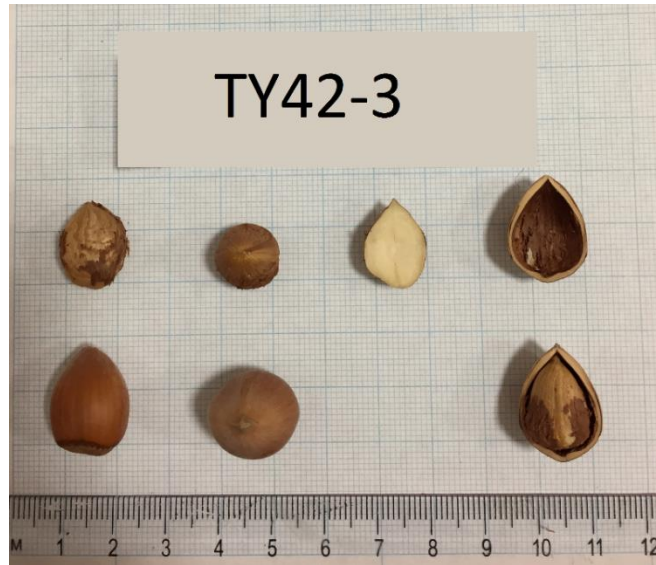
Şekil 3.2 TY42-3 klonuna ait meyve resmi