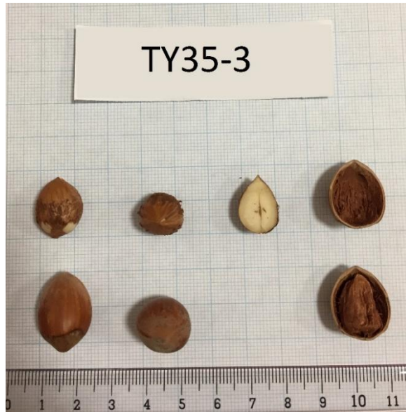
Şekil 3.5 TY35-3 klonuna ait meyve resmi