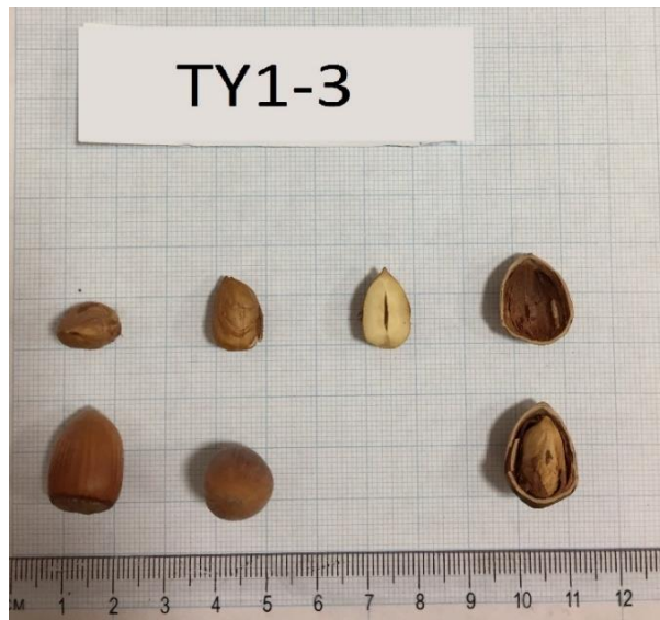
Şekil 3.4 TY1-3 klonuna ait meyve resmi