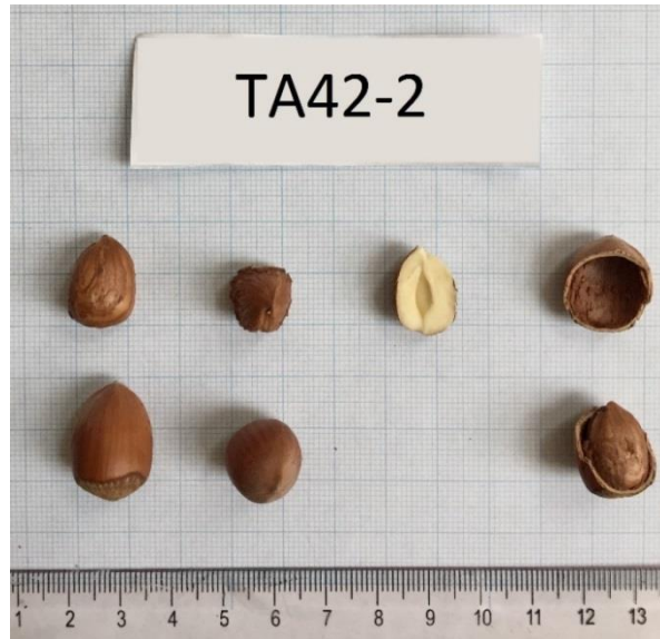
Şekil 3.3 TA42-2 klonuna ait meyve resmi