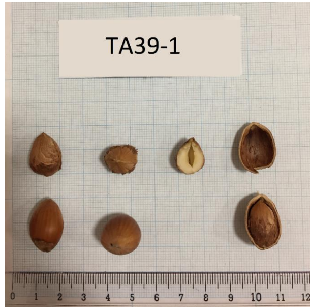
Şekil 3.6 TA39-1 klonuna ait meyve resmi