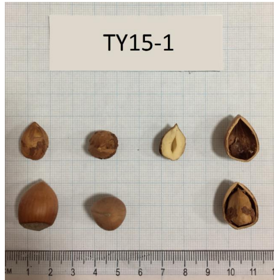
Şekil 3.9 TY15-1 klonuna ait meyve resmi