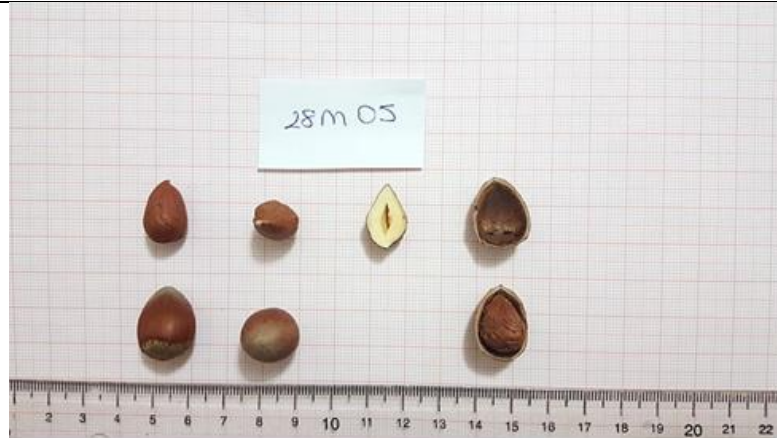
Şekil 4.1 28M-05 klonuna ait meyve resmi