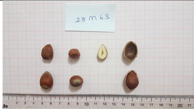
Şekil 4.2 28M-63 klonuna ait meyve resmi