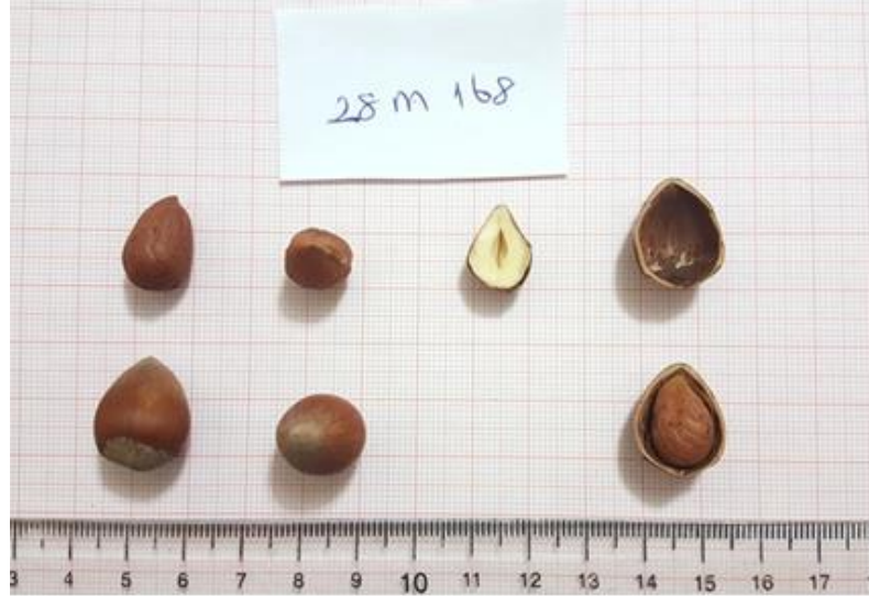
Şekil 4.5 28M-168 klonuna ait meyve resmi