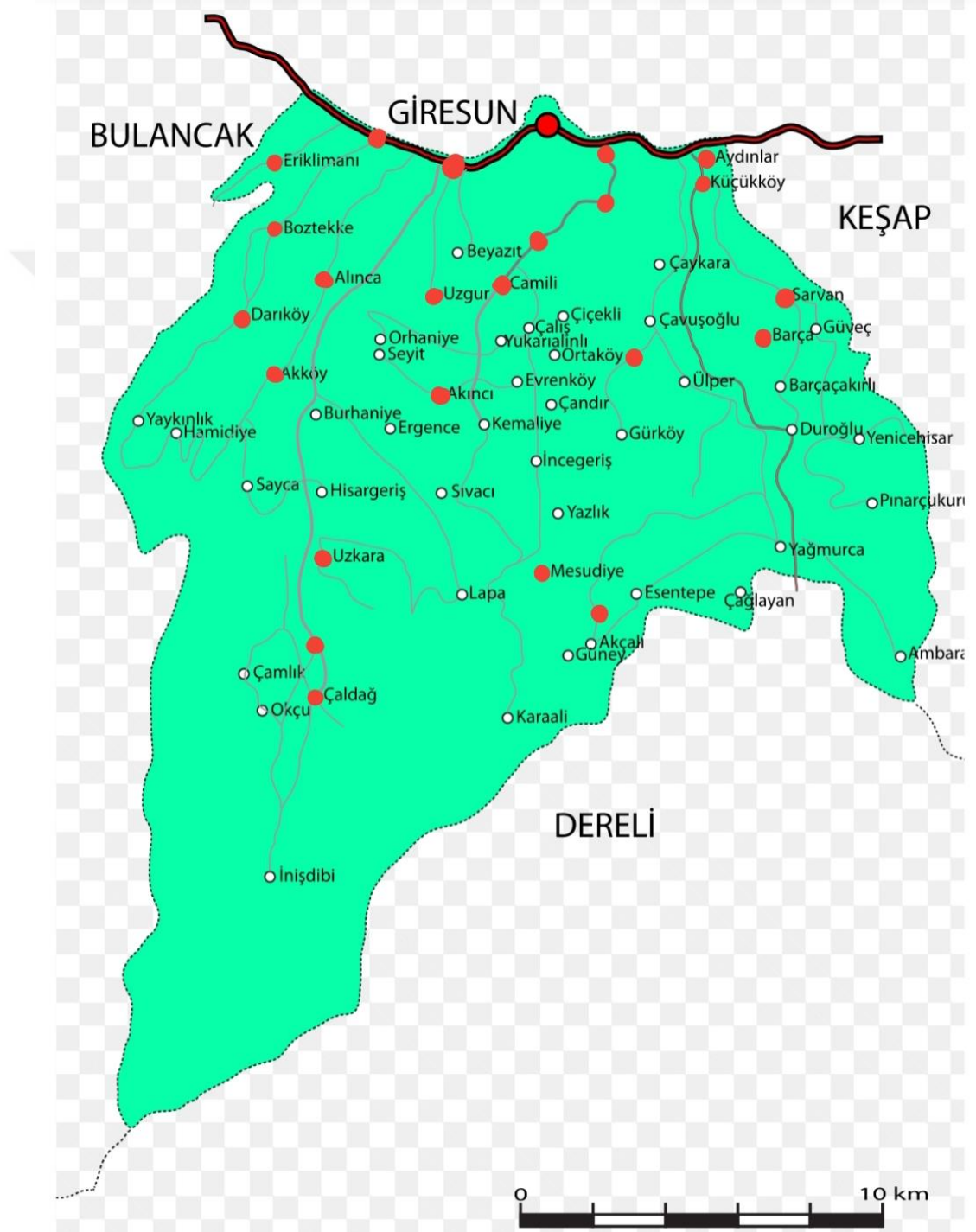
Şekil 3.1 Giresun ili merkez köyleri araştırma alanı