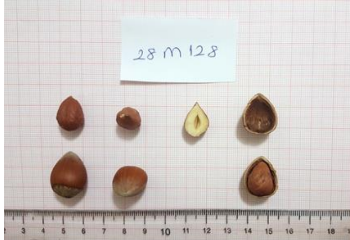
Şekil 4.4 28M-128 klonuna ait meyve resmi