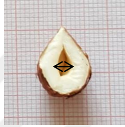
Şekil 3.3 Göbek boşluğunun ölçüldüğü kısım

Birleşen iki kotiledon arasında kalabilen boşluk göbek boşluğu olarak ifade edilir. Göbek boşluğunun en geniş çapı 0.01 mm'ye hassas kumpas ile ölçülmüş ve mm olarak ifade edilmiştir.