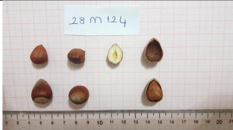
Şekil 4.3 28M-124 klonuna ait meyve resmi