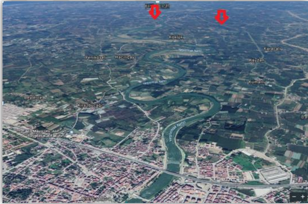
Şekil 3.1 Araştırmanın yürütüldüğü Çarşamba ovasının uydu görüntüsü

Çalışma alanı Yeşilirmak'ın biriktirdiği bir birikinti ovası olan Çarşamba ovasında (Şekil 3.1) bulunmaktadır. Çalışmanın yürütüldüğü bahçeler (Şekil 3.2, Şekil 3.3), Yeşilirmak'a yaklaşık 2 km uzaklıktadır. Yeşilirmak, Sivas ili Köse Dağlarından (2801 m) doğar, Canik dağlarını aşır Çarşamba ovasına ulaşır ve Civa burnundan Karadeniz'e dökülür (Anonim, 2019a).