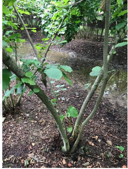
Şekil 3.6 Bakımlı bahçede bulunan ocaklara ait görünüm.