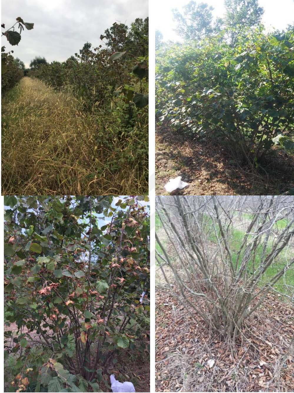
Şekil 3.5 Bakımsız bahçede bulunan ocaklara ait görünüm.