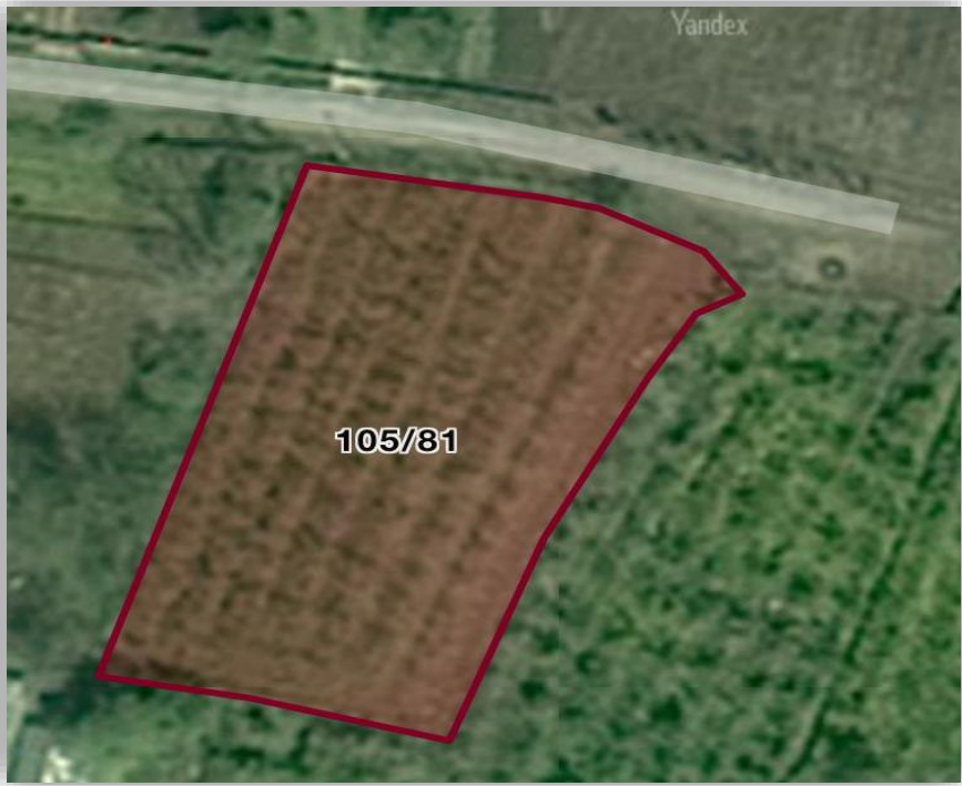
Şekil 3.3 Araştırmanın yürütüldüğü bakımsız bahçenin (Karacaköy) uydu görüntüsü