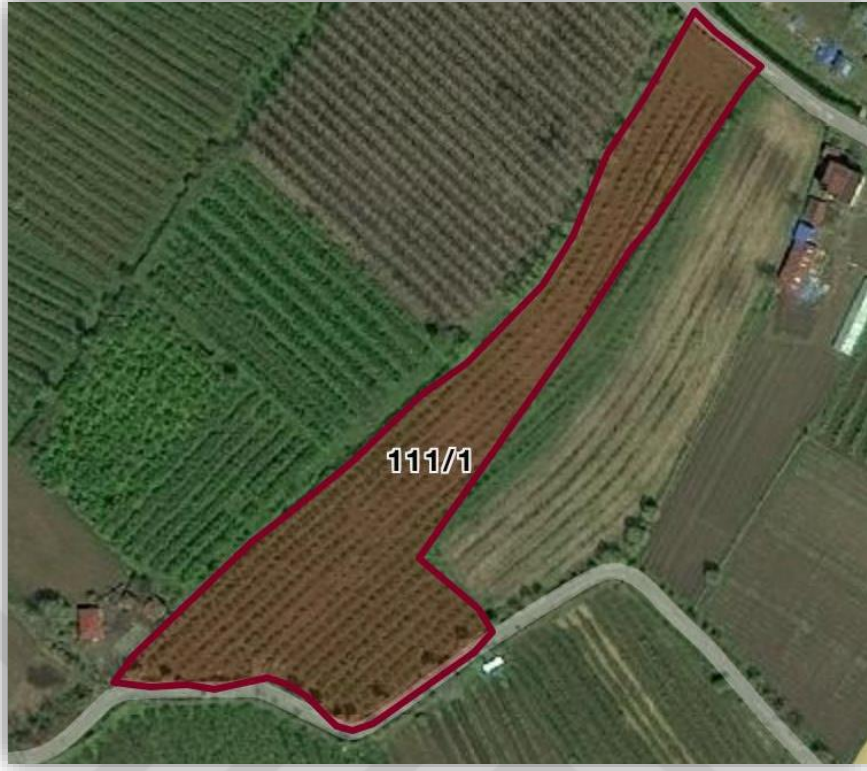
Şekil 3.2 Araştırmanın yürütüldüğü bakımlı bahçenin (Karamustafalı) uydu görüntüsü