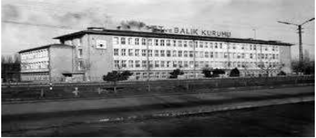
Şekil 2.1 Et ve Balık Kurumu (Anonim, 2019a)