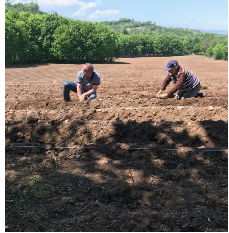
Şekil 3.2 Patates Dikimi

İlk çıkışlar 30.05.2018 tarihinde başlamış ve yaklaşık bir hafta içerisinde tamamlanmıştır. Çıkışlarda herhangi bir olumsuzluğa rastlanılmamış olup; istenilen ve beklenen seviyede çıkışlar gerçekleşmiştir. Akabinde bitki gelişiminin düzenli olması için yabancı ot kontrolünü sağlamak amacıyla çapalama yapılmıştır.