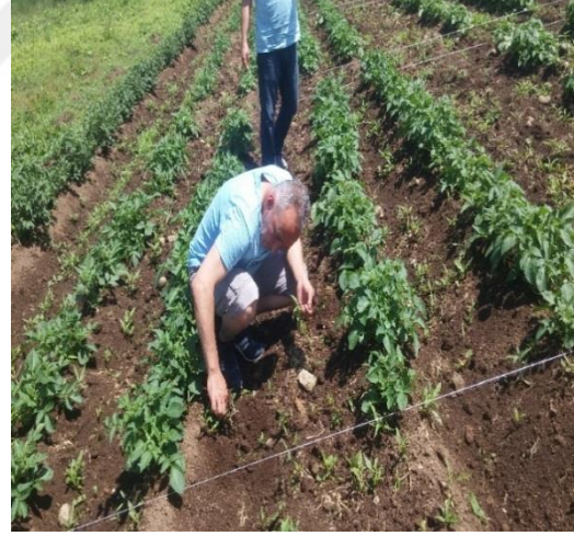
Şekil 3.3 Yabancı Ot Mücadelesi

İlk çıkışların görülmesinden yaklaşık 15 gün sonra 15.06.2018 tarihinde çapa ile boğaz doldurma işlemi gerçekleştirilmiştir. Bu arada aynı zamanda yabancı otlarla mücadelede yapılmıştır (Şekil 3.4-3.5).