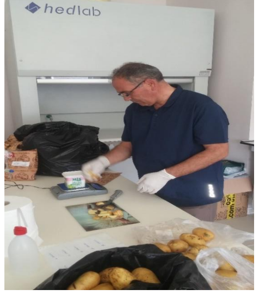
Şekil 3.7 Yumru Ağırlıklarının Belirlenmesi ve Yumruların Analizi İçin Hazırlanması