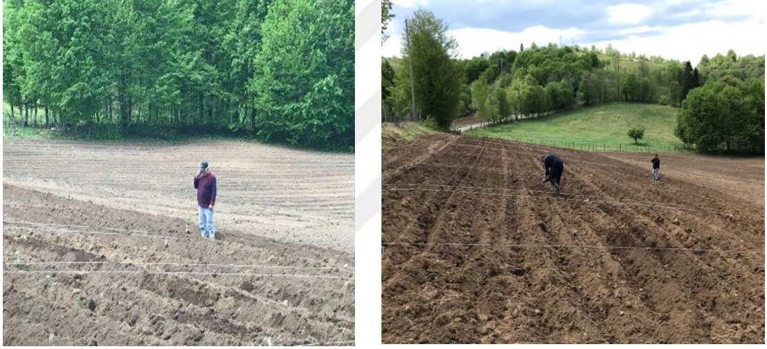
Şekil 3.1 Deneme Parselinin Düzenlenmesi ve Dikimden Önce Humik Asit Uygulaması

Deneme alanı Nisan ayının 3. haftasında sürülerek hazır hale getirilmiş ve parselasyon işlemi 01.05.2018 tarihinde yapılmıştır. Çalışma “Tesadüf Bloklarında Faktöriyel Denemeler” deneme desenine göre 3 tekerrürlü olarak yürütülmüştür. Deneme de toplam 24 adet parsel oluşturulmuş olup; parsel boyu 5 m, parsel genişliği 2.8 m olarak planlanmıştır. Her bir parsellerdeki sıra sayısı 4 adet, her sıradaki bitki sayısı ise 16 adet, sıralar arası genişlik 70 cm, sıra üzeri genişlik ise 30 cm olarak düzenlenmiştir (Kara, 2011; Er ve Uranbey, 2009). Buna göre 1 parselin alanı 14 m 2 Parseldeki bitki sayısı 64 adet olmuştur (Şekil 3.1).