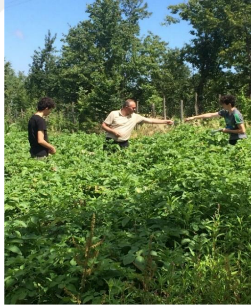
Şekil 3.5 Yapraktan Humik Asit Uygulaması ve Bitki Boyu İle Ana Sap Sayısı Ölçümü

Hasat olgunluk belirtilerinin görülmeye başladığı dönemde her bir parselde tesadüfen belirlenen 10 ocakta bitki ve ocaktaki ana sap sayısı ölçülerek kayıt altına alınmıştır (Şekil 3.5)