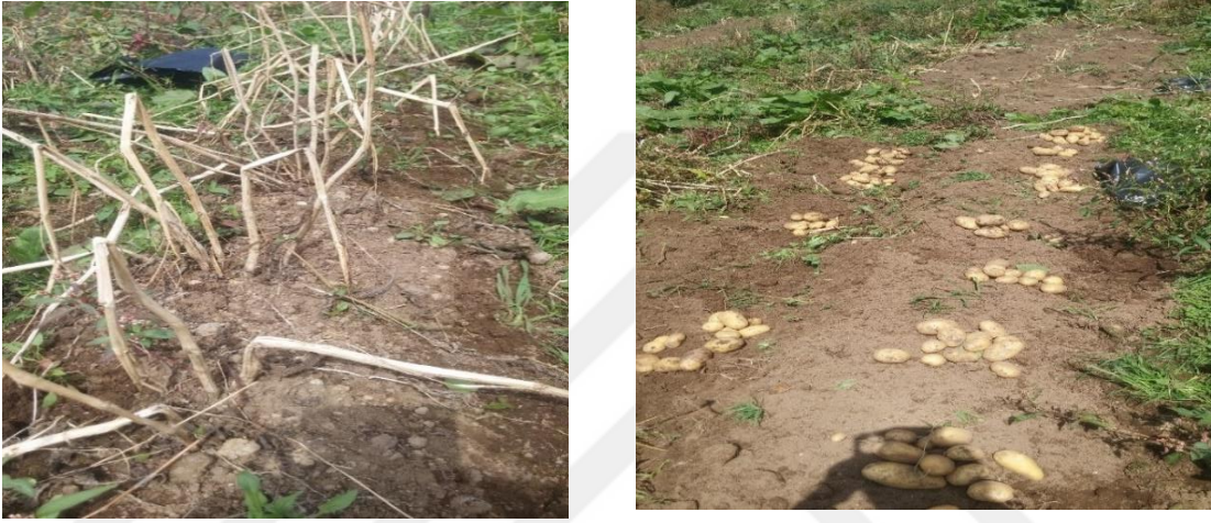
Şekil 3.6 Hasat Olgunluk Belirtisi ve Hasat İşleminde Görünüş

Hasat, bitkilerde yaprak ve sapların kahverengileşmesi ve kuruması, stolonların ana bitkiden ayrılabilmesi, yumru kabuğunun sertleşmesi ve tırnakla soyulmaması gibi olgunluk belirtileri göz önüne alınarak, 8-9 Eylül 2018 tarihlerinde elle yapılmıştır. Hasatta her bir parselde yumru özelliğinin belirlenmesi amacıyla öncelikle parselde ortada yer alan 2 sıradan tesadüfi olarak belirlenen 10 ocak hasat edilerek yumru özelliklerinin belirlenmesi amacıyla laboratuvara getirilmiştir. Daha sonra parselde kalan tüm bitkiler hasat edilerek parsel verimleri toplam parsel alanı üzerinden belirlenmiştir (Şekil 3.6).