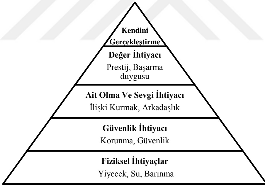
Şekil 1. Maslow İhtiyaçlar Hiyerarşisi

İnsancıl kuramın diğer bir öncüsü olan Abraham Maslow (1943), bireylerin doyurulması gereken ihtiyaçlarının olduğunu ve doyurulduğunda bir üst aşamadaki ihtiyaçlara geçtiğini savunmaktadır. Bunun üzerinden “İhtiyaçlar Hiyerarşisi” kuramını geliştirmiştir. Bu hiyerarşi beş basamaktan oluşmak ve birey birini tamamlamasa dahi diğer aşamaya geçebilmekte ya da bir alt aşamaya inebilmektedir (Hodgetts, 1999).