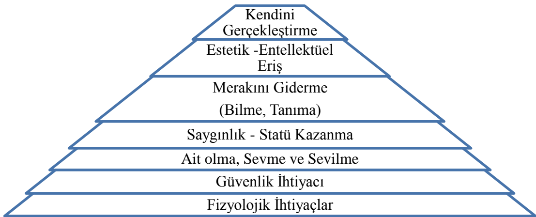
Şekil 2. Maslow'un ihtiyaçlar hiyerarşisi.

Maslow'a göre insanlar hayatları boyunca kendileri için bazı amaçlar doğrultusunda hayatlarını şekillendirirler. Bireyin kendini gerçekleştirme için belirli bir düzen içinde hayata ilişkin belirli amaçların ve bu amaçlara erişebilmek için bazı gereksinimlerin yerine getirilmesi gerekmektedir (Kula ve Çakar, 2015). Yedi ayrı basamakla açıklanan ihtiyaçlar hiyerarşi teorisine göre, bireylerin ihtiyaçları basamaklar şeklinde; bir üst basamağa geçmek için alt basamaklardaki ihtiyaçların giderilmesi şeklinde yapılandırılmıştır (Şeker, 2014). İlk dört basamak temel ihtiyaçlar olarak adlandırılırken son üç basamak üst düzey ihtiyaçlar olarak adlandırılmıştır (Ercoşkun, Nalçacı, 2005). Maslow'a göre alt basamağa ait olan gereksinimler giderilmeden bir üst basamaktaki gereksinimler giderilemez (Eren, 2015).