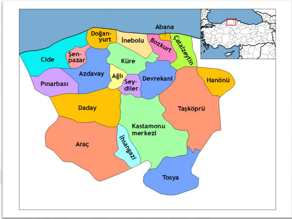
Şekil 2. Kastamonu ili ve ilçeleri ( http://www.wikizero.com , 15.10.2018)