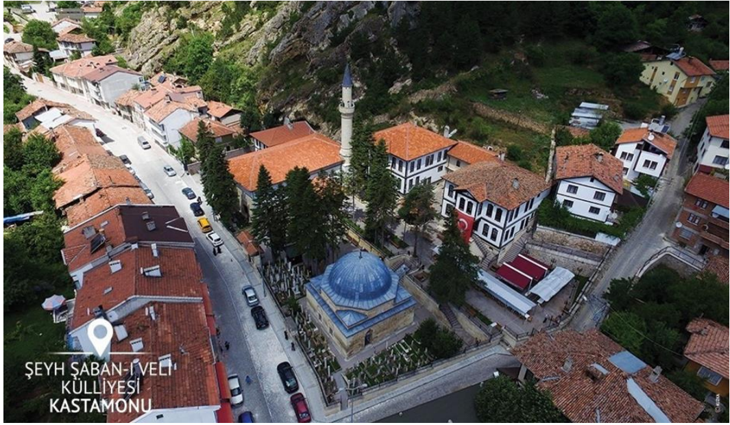
Resim 2. Hz. Pir Şeyh Şaban-ı Veli külliyesi