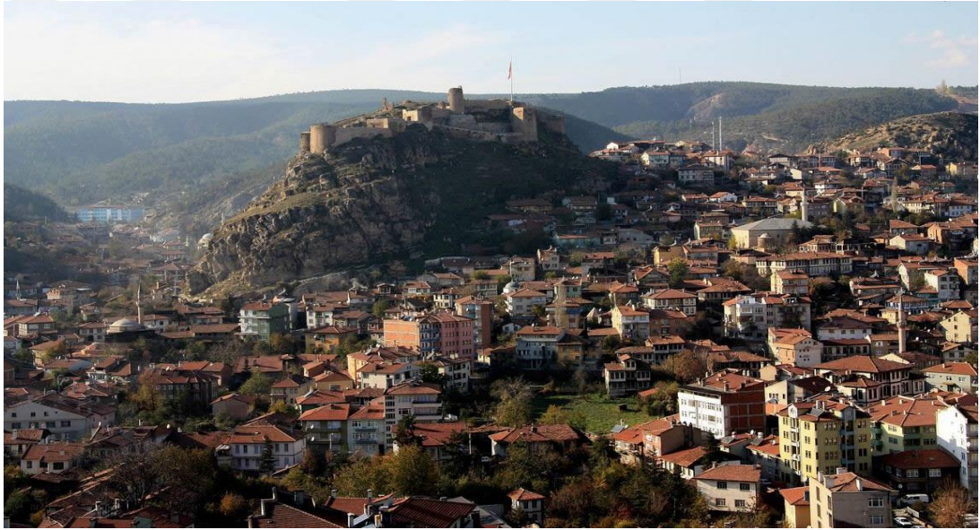
Resim 1. Kastamonu'dan bir görüntü