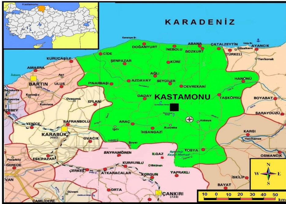
Şekil 1. Kastamonu coğrafi özellikleri haritası ( http://www.kastamonur.com , 15.10.2018)

Kastamonu ipek yolu güzergâhlarının kavşak noktasında bulunmaktadır. Kentte demiryolu ulaşımı yoktur. 2012 yılında açılmış olan havaalanı ulaşımında kolaylıklar sağlamıştır. Karayolu ulaşımı ise bölgenin coğrafi yapısından dolayı yeterli olsa da az geliştiği söylenebilir. Kastamonu ilinin denize kıyısı olan Cide, Abana, Çatalzeytin ilçelerinde de küçük tonajlı limanlar ile İnebolu ilçesinde uluslararası gemilerin yük alıp boşaltabilecekleri bulunmaktadır. Kastamonu merkez ilçesi dâhil toplam 20 tane ilçesi ve 1071 tane köyü bulunmaktadır. Kastamonu ilinin genel nüfusu, 2018 yılında "Adrese Dayalı Nüfus Kayıt Sistemi" sayımlarına göre 383.373 olarak güncellenmiştir Şehir merkezinin nüfusu ise 148.931'dir (tüik.gov.tr, 05.02.2019).