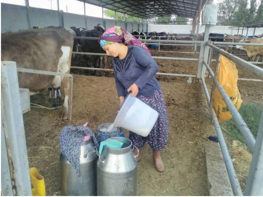
Fotoğraf 3.3. Süt sığırı işletmesinde aylık süt ölçümünü yapan yetiştirici

(Fotoğraf 3.3.) yapılır. Bu tezde kullanılan laktasyon verimleri bu günlük süt verimlerinin 305 günlük süt verimine çevrilmesiyle bulunmuştur.