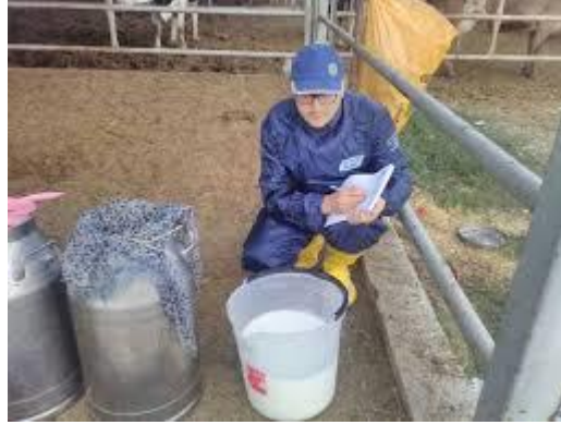
Fotoğraf 3.2. Süt ölçüm denetlemesi

Aylık rutin olarak yapılan Birlik üyesi işletme ziyaretlerinde süt ölçüm denetlemesi (yetiştiricinin yapmış olduğu ölçümün doğruluğunun kontrolü maksadıyla Fotoğraf 3.2.) her ay toplam üye sayısının yüzde 5'i kadar işletmeye önceden planlanan program dahilinde üyelere birlik aracılığıyla dağıtılan süt ölçüm kovalarıyla (Fotoğraf 3.1.) sabah ve akşam sağımalarının ölçümünü yapan yetiştiricilere gidilerek