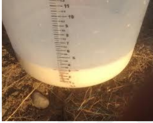
Fotoğraf 3.1. Üyelere Birlik aracılığıyla dağıtılan süt ölçüm kovası